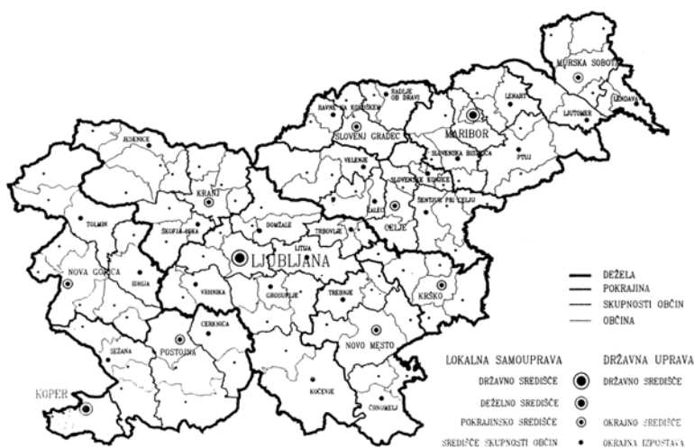
Figure 2: Proposal of regionalisation for territorial administrative reform 1993