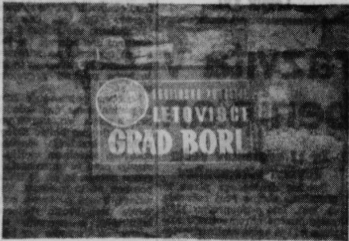
Letovišče grad Borl