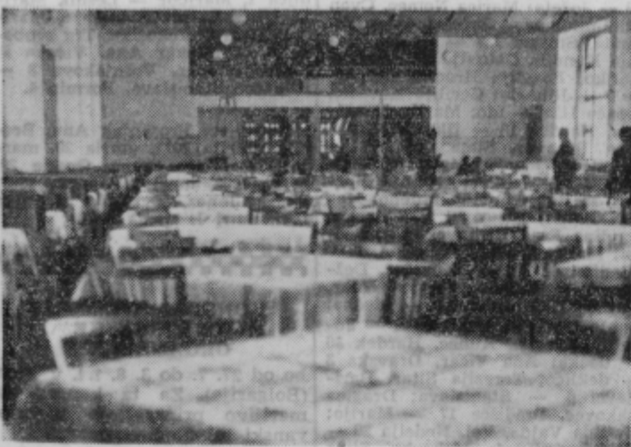
Velika dvorana restavracije v Kidričevem, kjer bo v soboto maturantski ples