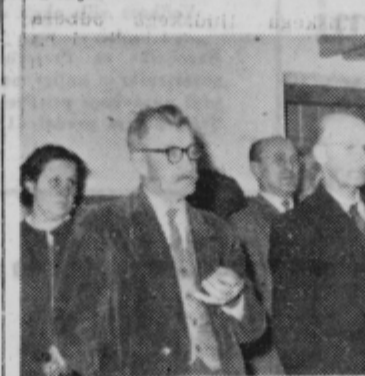
Del navzočih gostov