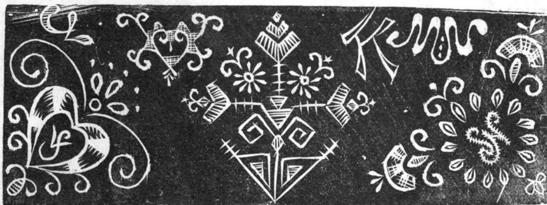
Monogrami za na robce z narodnimi okraski, izvedeni na razne nacine. Srednji okrasek v poljubne svrhe.