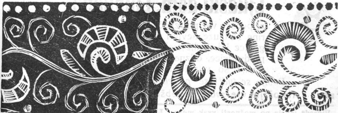
Bordura v narodnem slogu, vezena z belim na belo ali s kako drugo motno barvo, lahko pa tudi v dveh barvah (rdeče-modro ali rdeče-zeleno). Uporaba je uprav mnogovrstna.