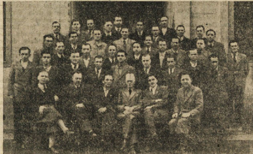
Udeleženci rudarsko-normirskega tečaja