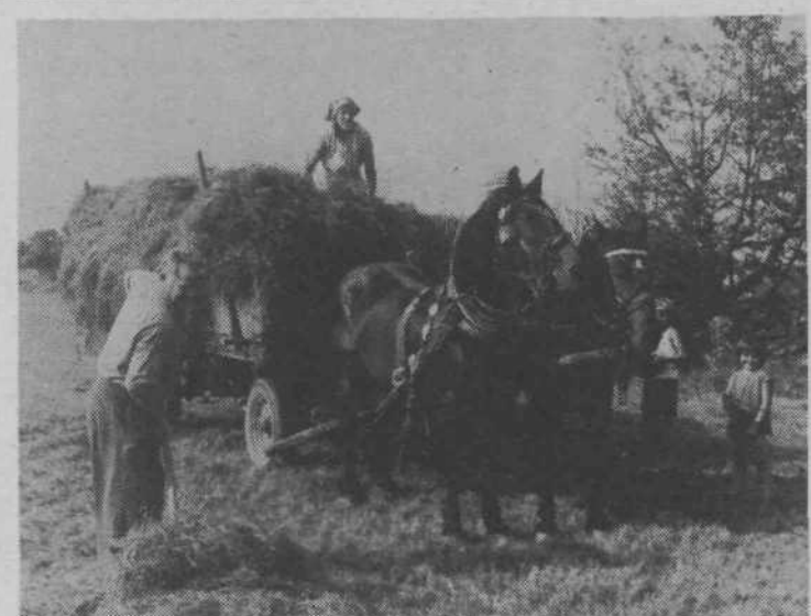
Družina Pečar (cesta v Zajčjo dobrovo) je „vpregla“ vse moči pri pospravljanju sena s travnikov, ki so v letošnjem letu vse prevečkrat mokri. Za razgovor niso imeli časa.

S preglednimi turnirji in prijateljskimi tekmami so pričeli delo najboljši igralci namiznega tenisa.