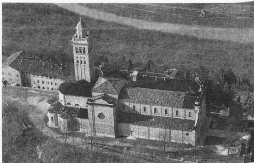
Podoba Svete gore

V tem tednu se je šolsko leto začelo tudi za otroke iz Benečije, ki obiskujejo dvojezični center v Spetru. Center je nastal po prizadevanjih slovenskih organizacij na Videmskem in je dosegel precejšnjo kvaliteto raven. Na žalost pa ta šola še ni rešila vseh problemov birokratske in upravne narave. Težave povzročata tudi prostorska stiska, tako da za vse otroke niti ni prostora. V vrtec se je vpisalo 12 otrok, v prvi razred osnovne šole pa 13, kar je že mali rekord.