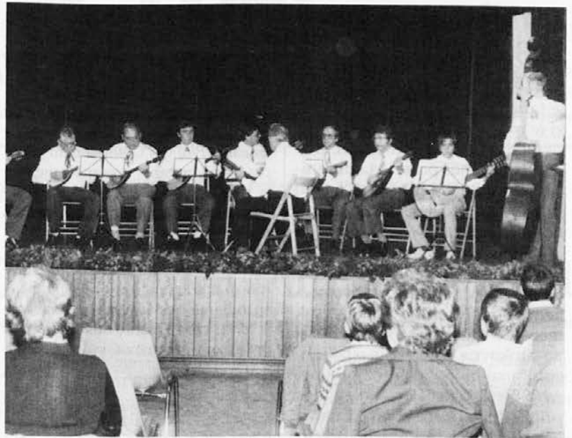
Tamburaška skupina KD »France Prešeren« iz Boljunca leta 1984

Ponovno je društvena dejavnost oživila v 60. letih in KD