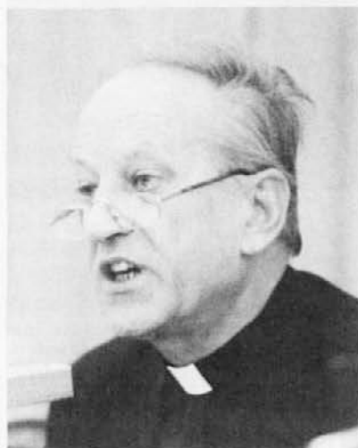
Dr. Franc Rode

Zadnji predavatelj na letošnjih študijskih dneh »Draga« je bil dr. Franc Rode, avtor številnih knjig, izrazito evropsko razgledan izobraženec, ki je zaposlen v Vatikanu kot tajnik Papeškega sveta za dialog z neverujočimi. Njegovo predavanje z naslovom »Da bi nam srca vnel za čast dežele« je vzbudilo veliko zanimanja. Dr. Rodeta smo zaprosili za pogovor.