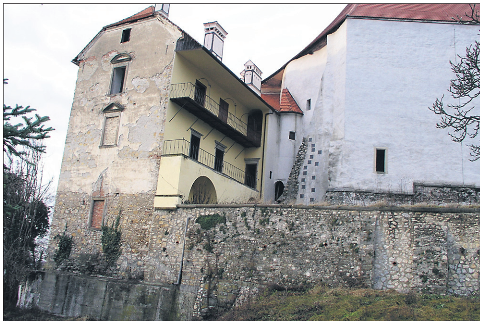
Grad Borl je po predavanju Preinfalka tipičen primer nepravilnega odnosa do grajske dediščine, ki je zaznamovala bližnjo slovensko preteklost, ko je bilo bolj ali manj namerno uničenih ogromno gradov v državi.

Druga večja prelomnica propadanja gradov v Sloveniji je bila po Preinfalkovih besedah prva in še bolj druga svetovna vojna: „Veliko graščakov se je izselilo, notranjost gradov je bila marsikje oropana, vrstili so se požari, bilo je celo