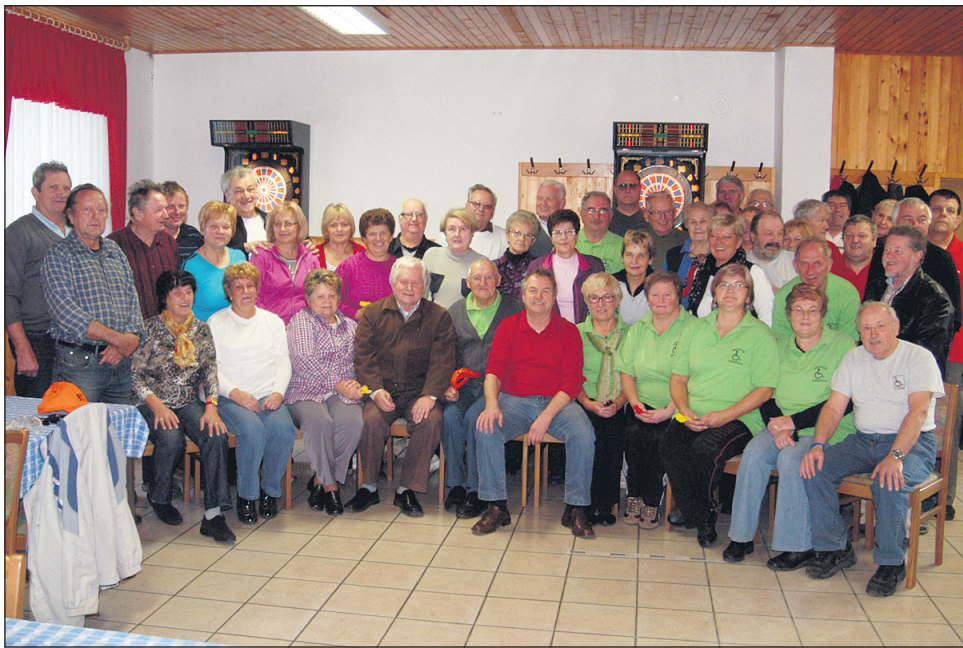
Meddruštvenega tekmovanja v pikadu se je v Lovrencu na Dravskem polju udeležilo okoli 60 tekmovalk in tekmovalcev iz Zveze društev Invalid Slovenije.

V ekipni konkurenci so med moškimi prvo mesto dosegli člani ekipe Termoelektrarne Šoštanj, ki so zbrali 2675 točk. 2. mesto je dosegla ekipa DI Vuzenica z 2591 točkami, 3. mesto ekipa DI Kidričevo (2289), 4. DI Konovo (2179), 5. ZI Brežice (2086). Med ženskimi ekipami je prvo mesto dosegla ekipa DI Kidričevo (2326 točk), 2. DI Vuzenica (2296),