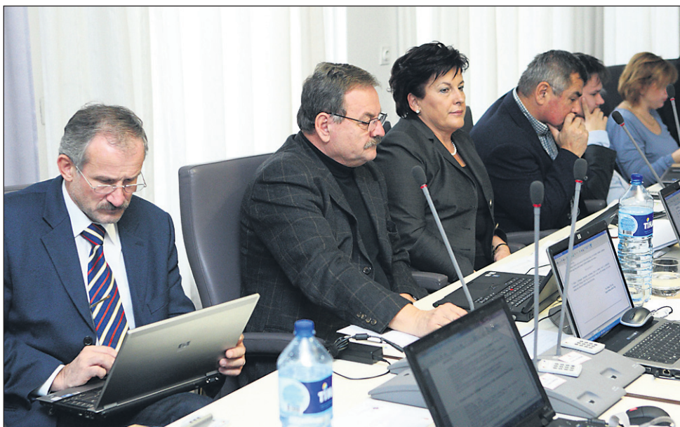
Ptujski mestni svetniki so na novembrski seji podali soglasje Javnim službam na zajem kredita.