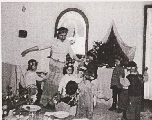
Tako-le je bilo v Waldorskem vrtcu Trnuljčica v Izoli. Zdaj so otroci zrasli in čaka jih klasična šola.

S pomočjo take pedagogike otroci razvijajo domišljijo, izražanje, kreativnost, sposobnost avtonomne iniciative. Pridobijo zaupanje vase in v svet. Naučijo se »biti« z drugimi, ker razvijajo močan čut za socialnost. Razvijajo močno voljo.