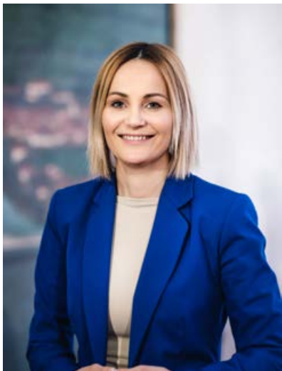
Nuška Gajšek, županja Mestne občine Ptuj