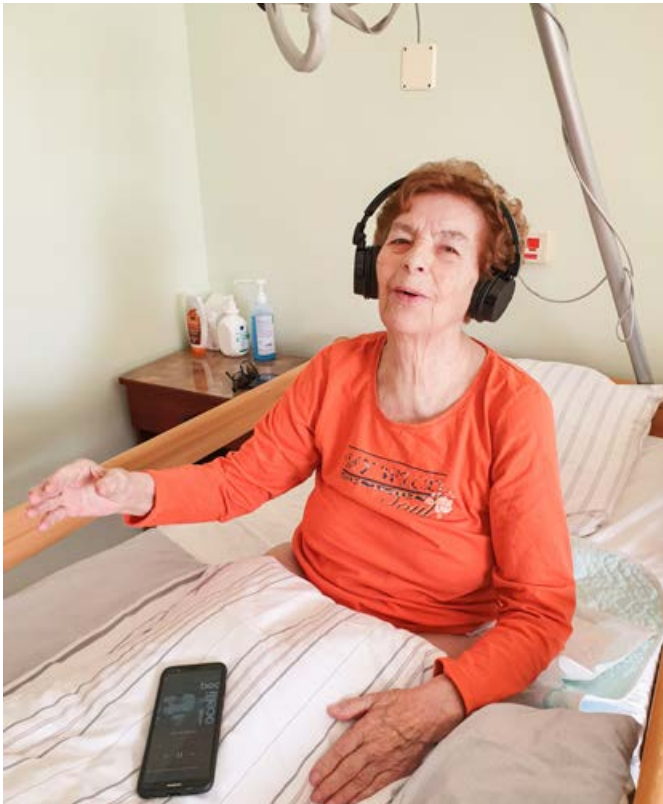
Glasba nas razvedri