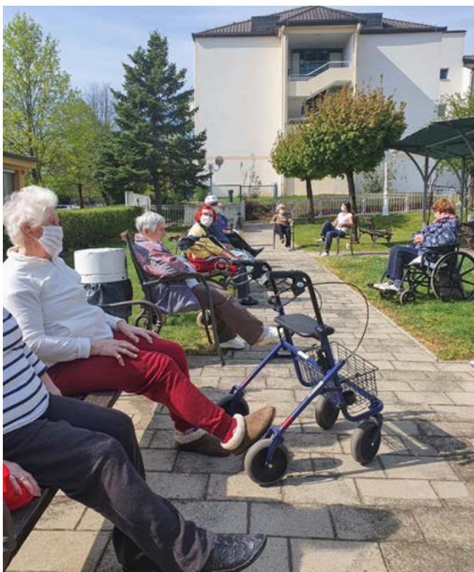
Uživanje na soncu

Naše življenje trenutno poteka za zaprtimi vrati. Ni lahko, a trudimo se in drug drugemu pomagamo ter si osmišljamo dneve. Malenkost, kot so nasmeh, prijazen pogled, pristrčen pozdrav, prijazna prošnja ali zahvala, so drobcici, ki gradijo naš vsakdan in veličino dneva.