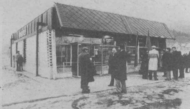
Petnajstega decembra je bila odprta Emonina samopostrežna trgovina v Senožetih

Uresničevanje zakona o združenem delu v neposredni praksi je namreč dolgotrajen proces. Zaradi ugotovitve, da nekateri samoupravni akti organizacij združenega dela niso usklajeni z zakonom o združenem delu in