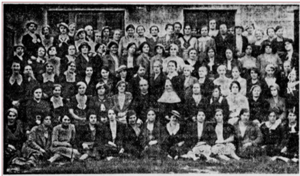
Slika 2: Slomškova družina – slovenske hišne pomočnice v Beogradu.

dekleta, ki pa so jih slovenski mediji še posebej opozarjali na pasti gmotnega in moralnega propada ter brezvestnega izkoriščanja tujk. 35 Poseben problem je predstavljala drugačna zakonodaja v povezavi z zaščito nezakonskih mater. Srbska zakonodaja, npr. ni predvidevala, da bi za nezakonske otroke finančno skrbeli očetje, kot je to predvideval Avstrijski občni zakonik, ki je v obdobju med obema vojnoma še veljal na ozemlju Dravske banovine in nekaterih drugih predelih, vključenih v Kraljevino SHS. Če so slovenske služkinje, v času, ko so npr. živele v Beogradu, postale nezakonske matere, so bile potemtakem še toliko bolj ranljive. Tudi same članice Odbora Zveze služkinj iz Beograda so v Domoljubu pisale, da je »/M/oralna nevarnost za naša dekleta v Beogradu in sploh v vsakem tukajšnjem mestu /je/ zelo velika«. 36 Zato je bila potreba po vzpostavitvi organizacij, ki bi zanje skrbele, tolika večja. 37