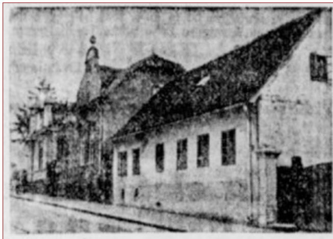
Foto 3: Poslopje Slomškovega doma v Beogradu. Vir: Slovenec , 1. januar 1937.

služkinj v Slomškovo družino leta 1935. 44 Medtem je na drugi strani liberalno usmerjene služkinje v Beogradu združevalo Slovensko žensko društvo. 45