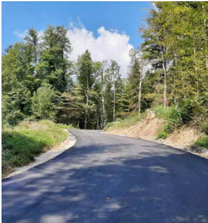
Rekonstrukcija lokalne ceste LC235011 na odseku Brdo–Čeplje.

Izvedena je bila rekonstrukcija lokalne ceste LC235011 na odseku Brdo–Čeplje. V postopku javnega naročila male vrednosti je bil izbran izvajalec del Resal d.o.o., pogodbeno vrednost del s podaljšanjem odseka rekonstrukcije ceste do drevoreda je znašala 303.849,80 € z DDV. Prav tako je bila izvedena rekonstrukcija dela ceste v Suši. V postopku evidenčnega naročila je bil izbran izvajalec del GP Hribar d.o.o., pogodbeno vrednost del je znašala 56.843,45 € z DDV.