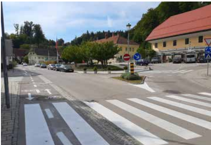
Obnova talnih označb na cestah ter na ostalih javnih površinah.