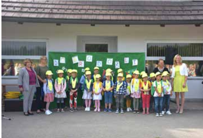
Učenci 1. a razreda.

Naši prvošolci so se razveselili čepic, nahrbtnikov in rutic, ki so jih pode-