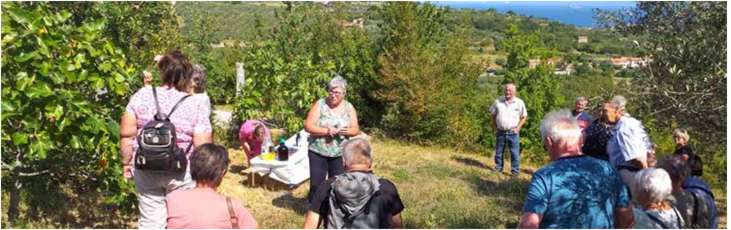
Ekскурzija na Primorsko in oljčni nasad.

Že drugo leto ni nič tako, kot smo vajeni. Tako smo v ZEKŽZ letos največje projekte umestili na poletni čas.