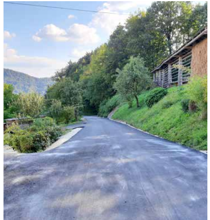
Rekonstrukcija ceste v Suši.

Zaključena je bila obnova poškodovanega vozišča v Žirovšah. V postopku evidenčnega naročila je bil izbran izvajalec del GP Hribar d.o.o., pogodbeno vrednost del je znašala 20.574,91 € z DDV. V izvajanju je rekonstrukcija ceste Šolska pot v Lukovici z ureditvijo meteornege odvodnjavanja, preureditvijo javne razsvetljave ter ostale komunalne infrastrukture.