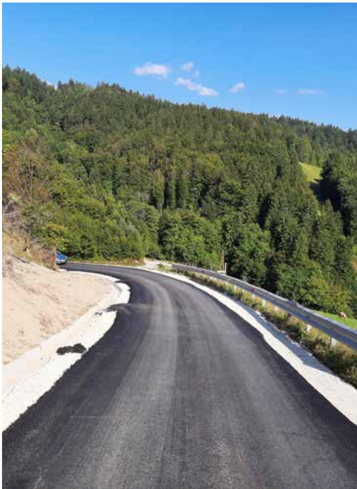
Rekonstrukcija lokalne ceste Bršlenovica.