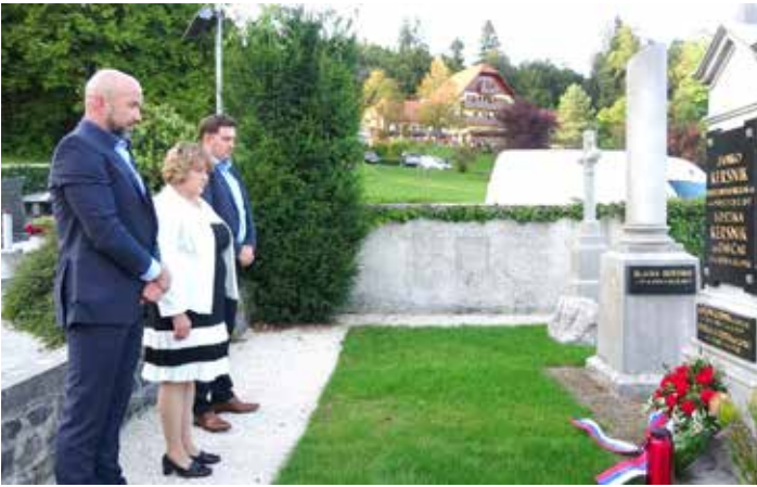
Položitev venca na grobu Janka Kersnika.

Letošnja osrednja prireditev ob prazniku Občine Lukovica, ki je bila že 26. po vrsti, odkar je Občina Lukovica samostojna lokalna skupnost, je potekala 3. septembra 2021, v Sončni dvorani na Brdu pri Lukovici.