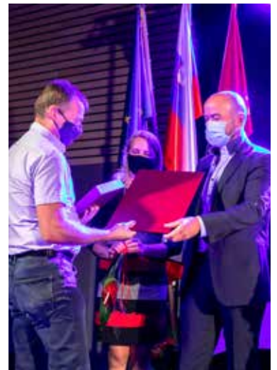
Prejemnik plakete Občine Lukovica Športno društvo Krašnja.

Uradnemu delu prireditve je sledil družabni večer, obarvan s slovensko glasbo. Tokrat je bila v gosteh znana slovenska pevka Manca Špik s svojim bendom, ki je predstavila svoje melodije za dušo in srce. Nastopu Mance Špik se je pridružila še Skupina Gadi, moška trio zasedba iz okolice Ljubljane, ki je popestrila glasbeni program z narodnozabavno glasbo in poskrbela za praznično vzdušje v dvorani.