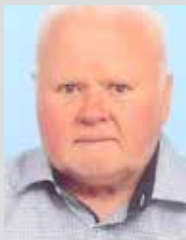
ZAHVALA V 78. letu

Vsi bomo enkrat zaspali, v miru počivali vsi, delo za vselej končali, v hišo očetovo šli.