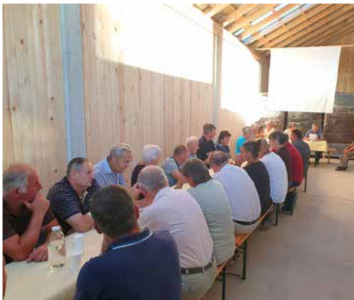
Občni zbor ZEKŽZ.

Po zaključku je potekala še predstavitev projekta iz programa razvo-