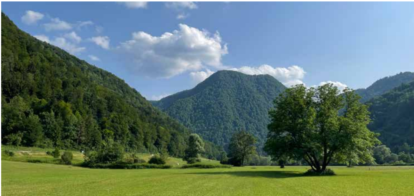
Dih jemajoča Selška dolina.

»Hoja ni le najbolj osnovna ali naravna oblika gibanja, niti ni le način skrbi za zdravo telo. Hoja je priložnost za notranji dialog in za samospoznavanje, za doživljanje edinstvenega potovanja, ki ga ne more ponuditi še tako privlačna svetovna destinacija. (In te besede pišem nekdanja ljubiteljica potovanj in avtorica treh potopisnih knjig.) Potovanja, ki je tako lahko ponovljivo, a se kljub temu marsikdo ne odloči zanj. Ker je lahko tudi naporno. A dlje kot z nečim odlašamo, težje to lahko postane. Kajti hoja je tudi zdravilo za um, če oz. ko je to potrebno. Ko smo na to pripravljeni. Zreli. Hoja je, po lastnih izkušnjah, tudi eliksir za dušo. Dišeč, barvit, poln eliksir, po zaužitju katerega je človek brez bogastva – bogat. Zelo bogat. Tako bogat, da lahko postane tudi neustrašen. Pa ne naivno neustrašen, da se ne bi umaknil na primer proti njemu bržečemu tovornjaku, ne – neustrašen v smislu, da se znebi notranjih strahov, ki morda tam ždiijo že tako dolgo kot katodni televizor v sosedovi kleti. Ko postane resnično svoboden. Ko je končno sposoben zajeti vonj letnega časa, pa vonj iglavca, ki ga pričaka za naslednjim ovinkom, ter svežino rečice, ob kateri neumorno pojejo škržati. Ko pač stvarnost postane ne le veliko večja kot je bila, ampak tudi veliko globlja in polnejša. To se zgodi, ko človek najde pot k sebi. S hojo.«