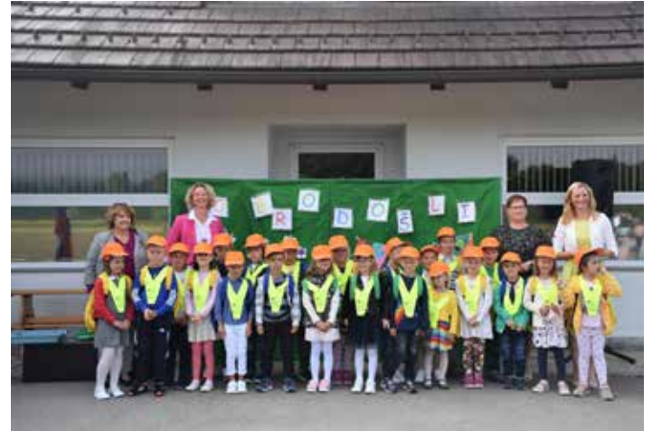
Učenci 1. b razreda.