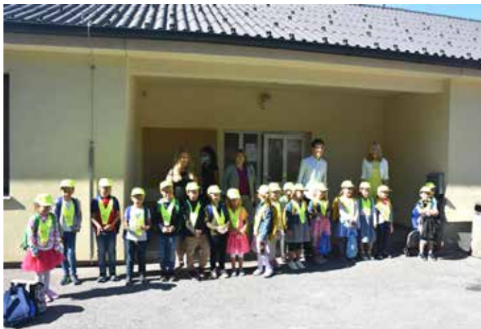
Učenci 1. c razreda Podružnične šole Krašnja.