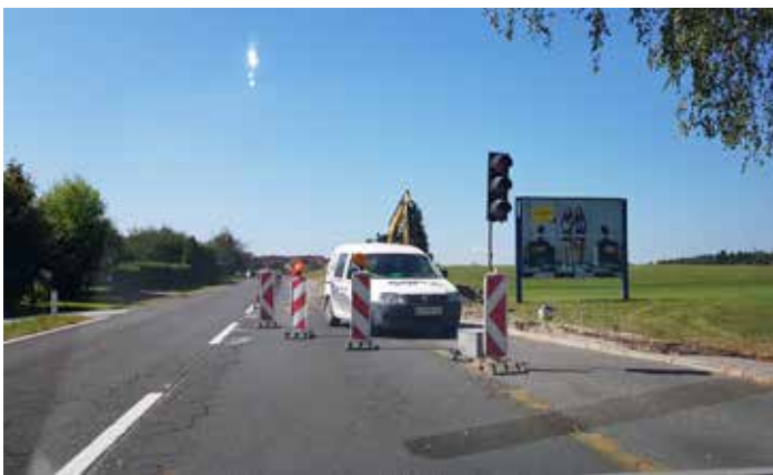
Izgradnja enostranskega pločnika ob regionalni cesti R2-447 na Prevojah pri Šentvidu.