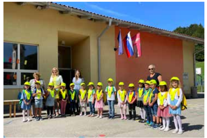
Učenci 1. d. razreda Podružnične šole Blagovica.