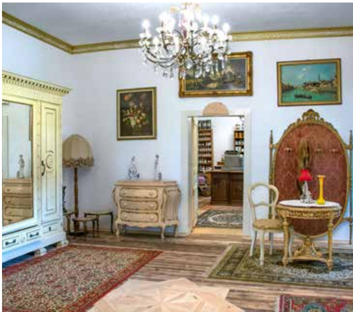
Beneška soba in stara lekarna v ozadju.