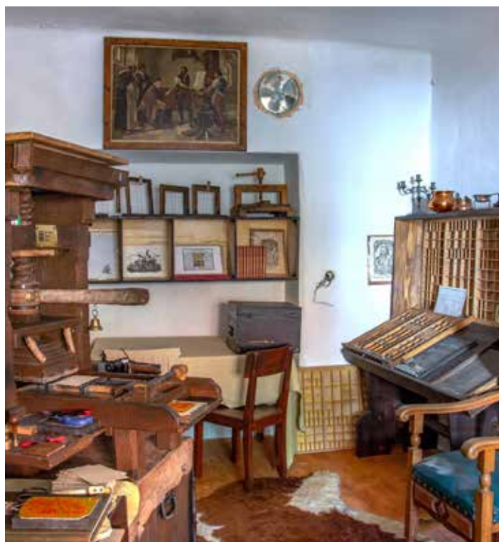
Grajska tiskarna Janeza Rozmana.

BESEDILO: ANDREJA ČOKL