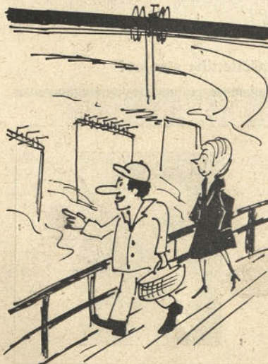
Vidiš žena. Most bo pa le. Počasi, pa gvišno.

Tri četrtine požarov povzročajo malomarnost in brezbržnost. Zato bodi pri delu vedno in povsod previden!