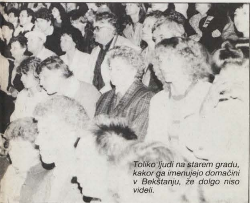
Toliko ljudi na starem gradu, kakor ga imenujejo domačini v Bekštanju, že dolgo niso videli.