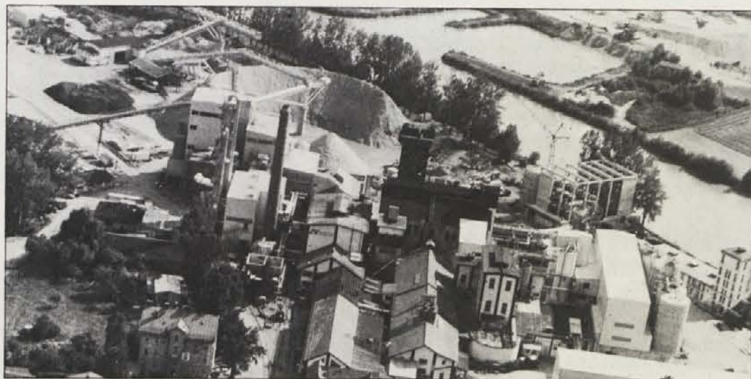
Tovarni v Magdalenu nasprotujejo tudi varstveniki okolja!