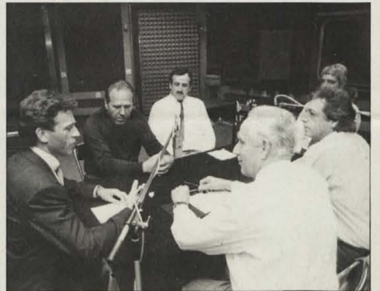
V razgovoru z delavci tovarne Obir je Haider ponovno – toda zaman – skušal krivdo za nastalo situacijo zvaliti na lastnika ter na posloводство tovarne.