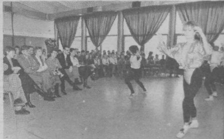
Prizor s slovesnosti ob ustanovitvi OŠ Nove Jarše. To solo bo obiskovalo 740 učencev.