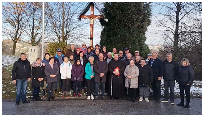
Na slovesnosti pri obnovljenem Freglačevem križu v Skorišnjaku

V novem letu želimo vsem upokojencem Društva upokojen-