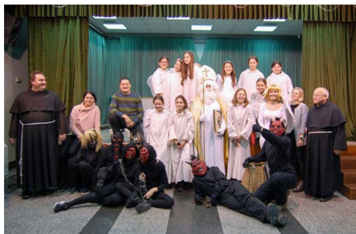
Sv. Miklavž s svojimi spremljevalci v družbi ekipe, ki je poskrbela za lep Miklavžev večer v videmski župniji.