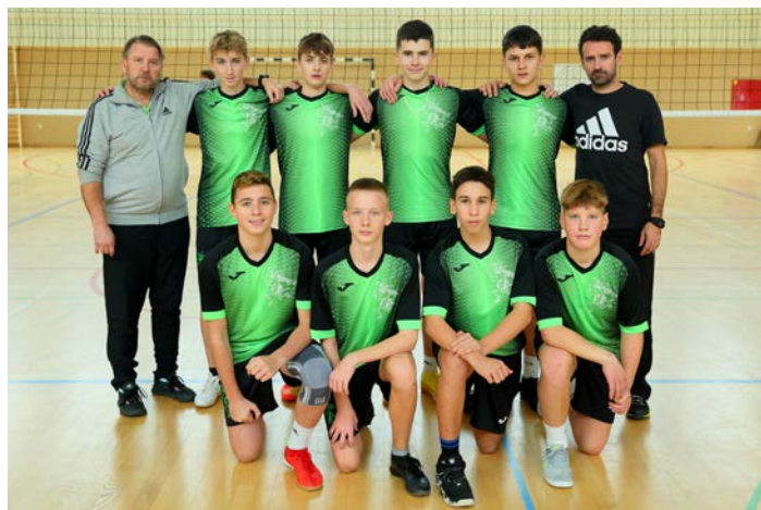
Odbojkarji OŠ Videm - Leskovec so se uvrstili na področno tekmovanje.