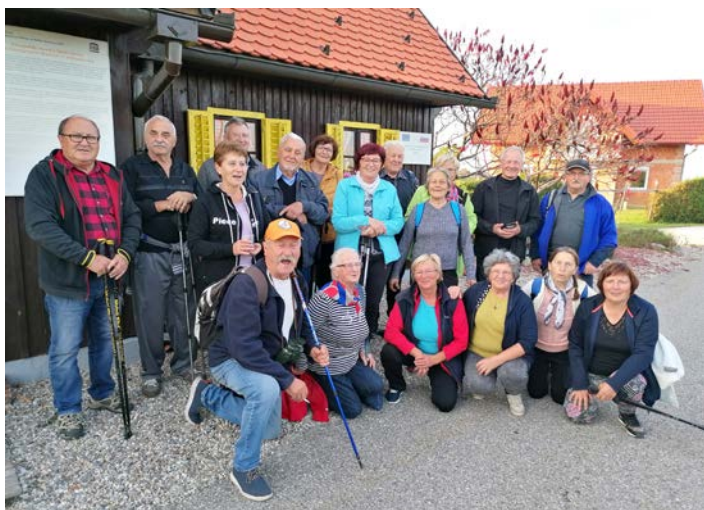
Leskovčani, člani društva upokojencev, so se v novembru odpravili po krajih svoje krajevne skupnosti. Obiskali so Veliko Varnico in Skorišnjak.