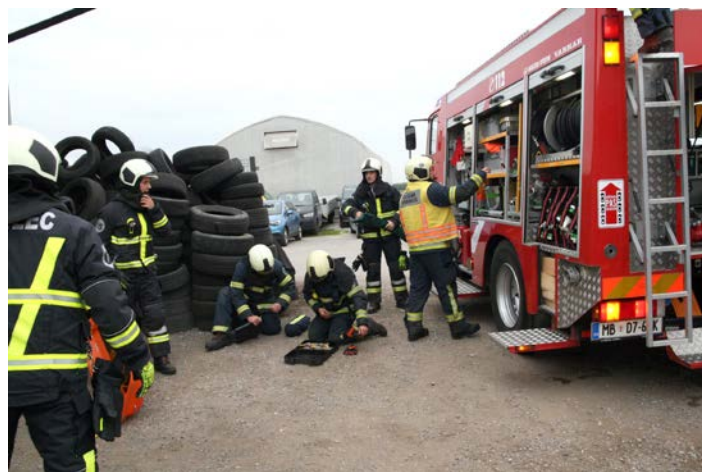
Tudi v PGD Sela so preverjali operativne sposobnosti.