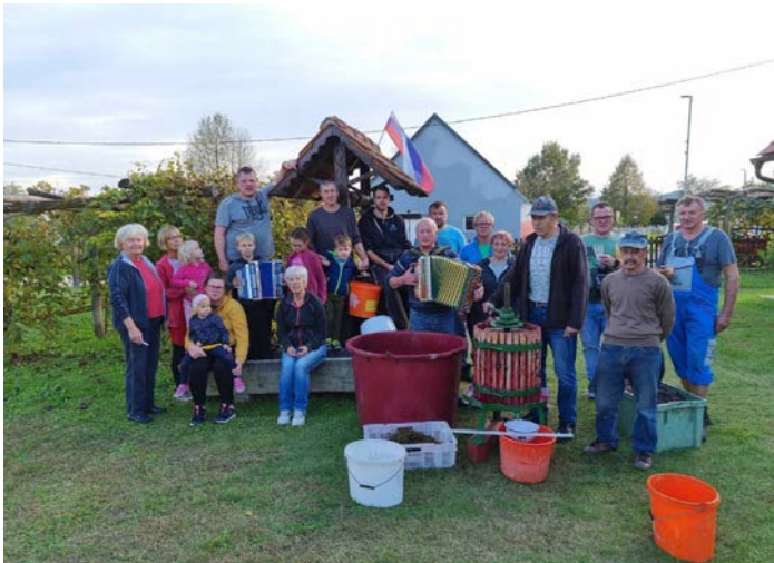
Trgatev na Petrovi domačiji