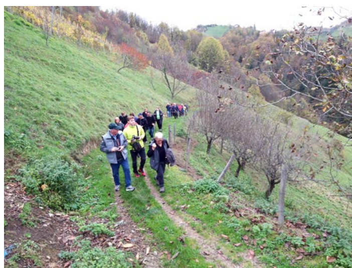
Tradicionalno martinovanje v Društvu Kocil v Skorišnjaku so letos združili s pohodom med vinskimi griči, še pred pohodom pa je bil blagoslov mošta pri Blaževi kapeli.

Nato je sledil še tradicionalni blagoslov mošta, ki so ga prinesli okoliški vinogradniki in kletarji. Po sveti maši smo pokusili pravkar blagoslovljeno dobro kapljico in si izmenjali mnenja o letošnjem pridelku. Po krajšem druženju smo se podali na pot, sprva po grebenu navzdol, mimo vikendov in domačij, kjer so nas že pričakali s kozarcem domačega, kot se to spodobi za čas martinovanja. Pot smo nadaljevali po dolini proti Velikemu Okiču in se ponovno povzpeli mimo Zavčevih, kjer so nas prav tako pričakali z dobro kapljico in okusnimi rogljički. Po postanku smo pot nadaljevali po lepo razglednem grebenu nazaj v Skorišnjak do Jožice in Jožeta Kozela, kjer smo pohod tudi končali ter ob dobrem golažu