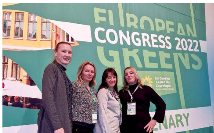
Slovenska delegacija na kongresu Evropske zelene stranke

V soboto dopoldne je na plenarnem zasedanju Zelene in socialne rešitve za energetske krize skupine Zelenih v Evropskem