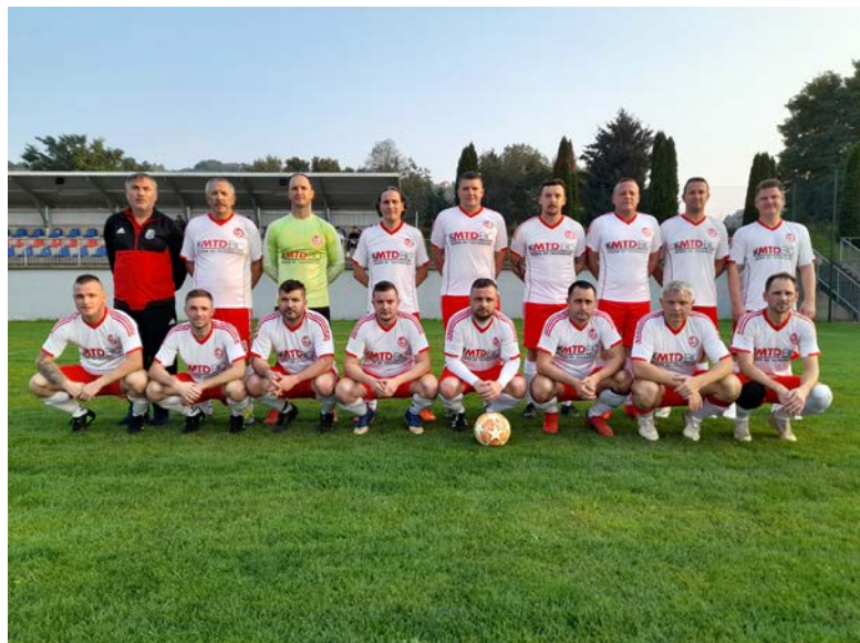
Veteranska ekipa Tržca

Sicer pa bili v klubu, ki domuje ob Polskavi, v tem letu dejavni tudi ob zelenicah. Tako je športni park dobil novo odbojgarsko igrišče na mivki, nova igrala, fitness na prostem ter nove ograje na starem igrišču in igrišču za mali nogomet, o