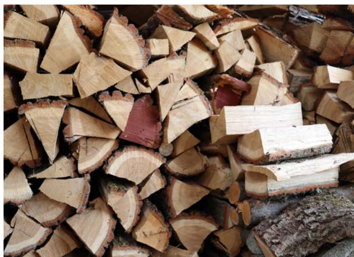
Zložba hrastovih drv

V kurilnih napravah se lahko kurijo le zračno suha drva, polena pa morajo biti primerne velikosti. To dosežemo z naslednjimi ukrepi: podiranje dreves naj se izvaja v jesensko-zimskem času. Najprimernejša oblika polena je trikotnega preseka s stranicami približno 7–9 cm oziroma z obsegom polena