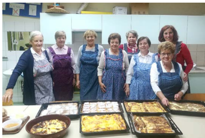
Na Osnovni šoli Videm smo sodelovale na tradicionalnem slovenskem zajtrku z recepti naših babic.