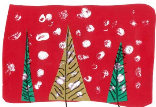
Žan Smolinger, 1.a