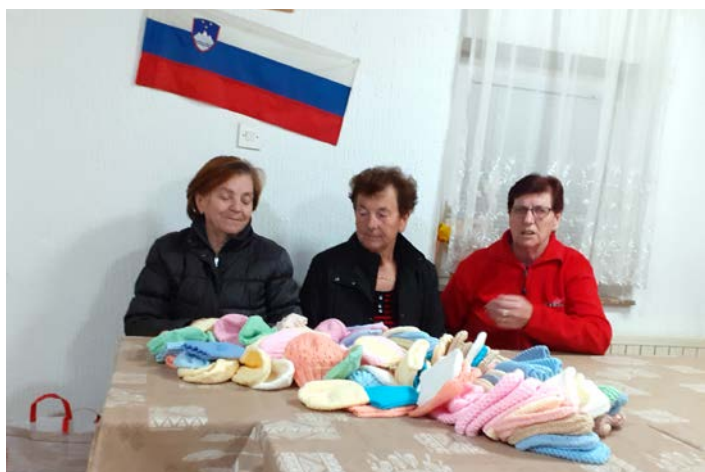
Kapice za novorojenčke v ptujski porodnišnici