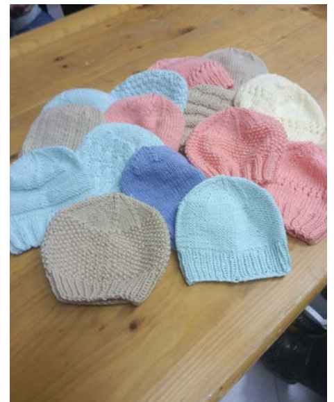
Tople kapice za novorojenčke

toplih odej za starejše, ki so na invalidskih vozičkih in jim odeja pri gibanju pride še kako prav. Vsi ti izdelki pa so plod pozitivne, ustvarjalne energije, ki