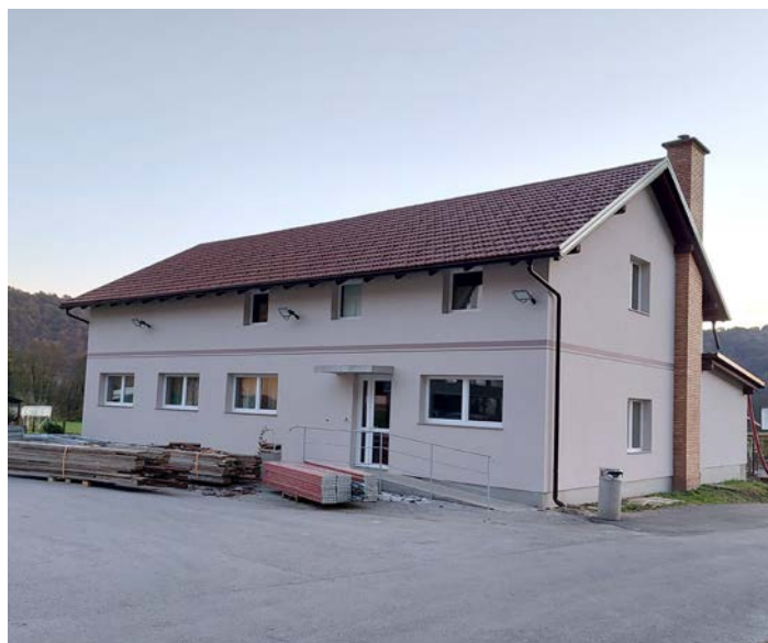
Prenovljena fasada doma krajanov

Napovedana sanacija mostu čez potok Peklača v Staro grabo je opravljena. Prenovljena je vozna površina, z betonsko škar-