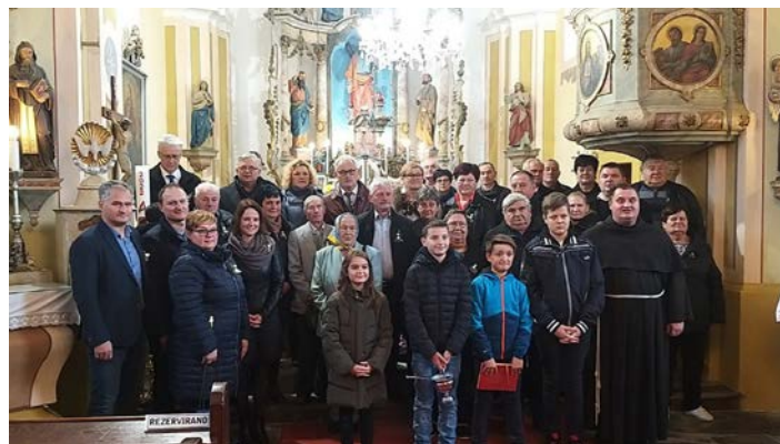
Zakonci jubilanti na druženju v župnijski cerkvi sv. Andraža