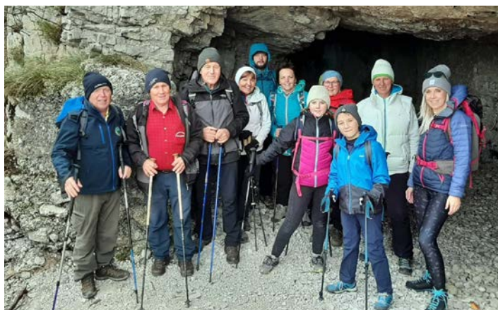
V novembru so se planinci povzpeli na Sabotin.

Vsem članom, vodnikom, članom UO se ob koncu leta lepo