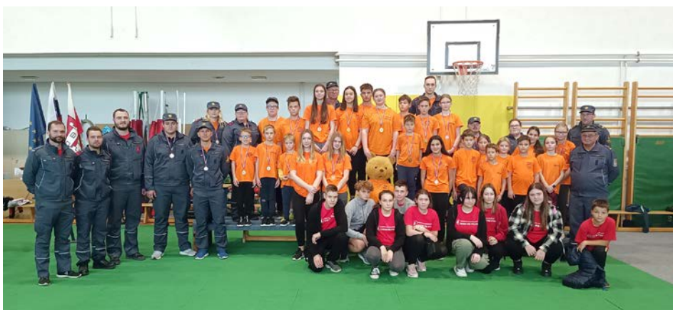
Mladi gasilci so letos lahko znova sodelovali na tekmovanjih.

Za nami je oktober, mesec požarne varnosti. To je mesec, ko vse gasilske organizacije in druge pristojne službe opozorijo na pomen požarne varnosti. Požarna varnost se začne in izvaja kot preventiva pri vsakem občanu, društvu ali organizaciji pri opravljanju svoje dejavnosti. Čas, ko zapoje sirena, pa je znak, da je bilo nekaj narobe, da je potrebna intervencija, tj. naslednja faza požarne varnosti.