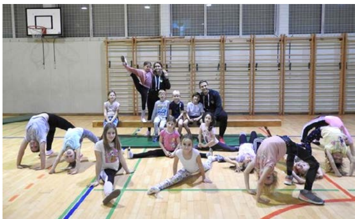
Mlade gimnastičarke v akciji.

Potem ko je NZS letos spremenila format pokalnega tekmovanja in so priložnost za nastop v njem in s tem tudi možnost presenečenja dobili t. i. manjši klubi, so v Vidmu z velikimi pričakovanji po uspehu v pokalu MNZ Ptuj čakali svojega tekmeca na državnem nivoju v Pokalu Union, kot se tekmovanje uradno imenuje. Rumeno-zeleni so v žrebu dobili ekipo iz Doba, ki so jo v šestnajstini tekmovanja gostili doma. V sredo, 9. novembra, so navijači Vidma ob pomoči učencev OŠ Videm pripravili fantastično vzdušje in napolnili tribune, obenem pa so bili fantje na igrišču za srčno predstavo na koncu nagrajeni z napredovanjem v osmino finala. Odločale so enajstmetrovke, kjer so bili domačini uspešnejši, od enega izmed v zadnjih letih najboljših slovenskih drugoligašev. Žreb osmine finala je nagra-