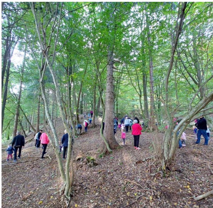
Medgeneracijska hoja po razpotju

Kljub vstopanju v zimski čas, ko nas večina misli, da so lahko rekreacija le smučanje ali druge gibalne discipline na snežnih poljanah, nam v vsakodnevem življenju ostaja kot učinkovit dejavnik zdravja in srečanja z naravo hoja . Že s samo polurno aktivno hojo in nekaj razgibalnimi vajami bomo primerno skrbeli za ohranjanje zdravja in gibalnega aparata. Med 25 in