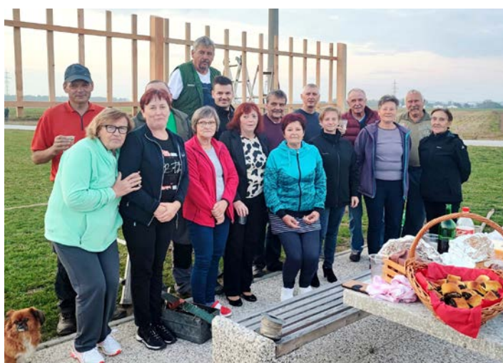
Vesela družba po uspešno končanem delu, ko so brajde že bile postavljene in so nazdravili novi pridobitvi.