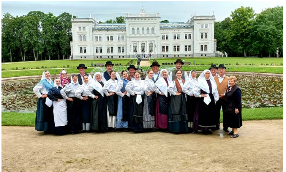
Na letošnje gostovanje v Litvi ostajajo lepi spomini.

Folklorniki iz Lancove vasi že leta ohranjamo in prenašamo kulturno izročilo, šege in navade našega kraja. S tem predstavljamo svoj kraj, svojo občino in tudi našo državo povsod po svetu. Letos smo naše kulturno izročilo predstavili v manjšem mestu Plunge v Litvi na že 14. mednarodnem folklornem festivalu »Saulėle raudona«, ki je trajal od 16. do 20. junija. Združeni mlajša in starejša odrasla folklorna skupina, skupina pevk in muzikantov smo se pridno pripravljali na vajah, da smo lahko na festivalu pokazali, kaj vse zmoremo in znamo.