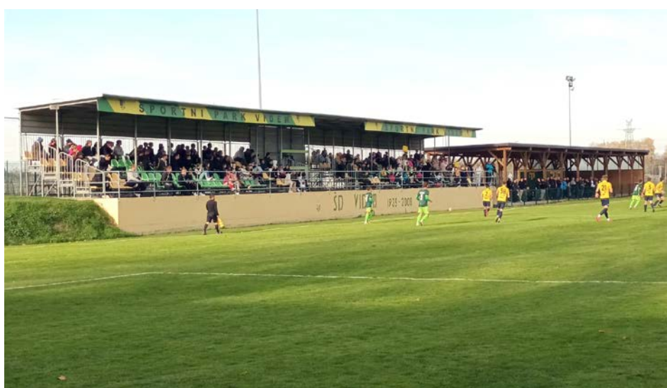
Utrinek s pokalnega obračuna z Roltek Dobom

Najvišji vrh piramide vsakega društva je člansko moštvo in o polsezoni lahko glede rumeno-zelenih govorimo o pre-