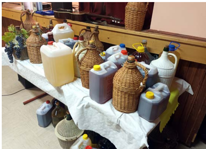
V Pobrežju so krajanj prinesli letošnjo vinsko kapljico.