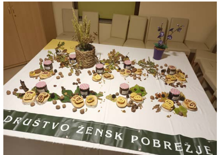
Pobrežanke so letos ponudile rulade z domačo marmelado.