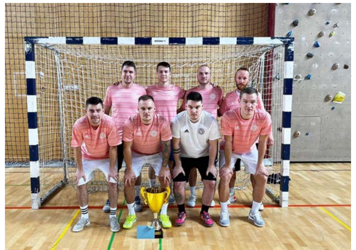
Ekipe ŠD Selan na močnem mednarodnem turnirju v Ljutomeru decembra letos.

Tudi prihodnost se zdi s smelimi ambicijami prizadevnih članov društva svetla. Tako v letu 2023 načrtujejo kakovostno izvedbo okroglega, že 15. memorialnega turnirja v juniju na Selih. Poleg tega načrtujejo februarja smučanje v italijanskih