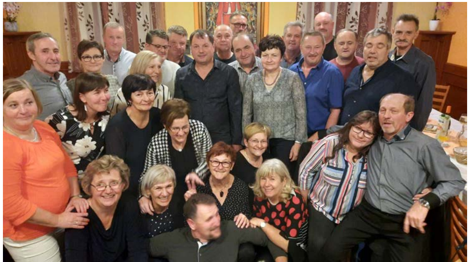
Nekdanji videmski sošolci na veselem druženju

V začetku novembra smo se slišali in že šestindvajsetega isti mesec sedli za obložene mize v gostilni Rajh v Dražencih, kjer so poskrbeli za prijeten ambient in odlično hrano. Nekateri sošolci se danes profesionalno ali ljubiteljsko ukvarjajo z vinogradništvom, zato dobre kapljice ni manjkalo. Ob tej so se hitro razvezali v začetku sramežljivi jezički, ki so nato z navdušenjem izdali marsikatero šolsko prigodo. Seveda smo se ob spomilih na osnovnošolske vragolije vsi skupaj odlič-