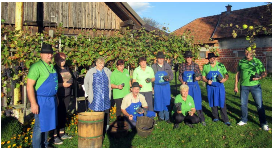
Trgatev v Dravcih, pri Korpičevih in etnološkem muzeju, je bila letos še posebej vesela, saj je trta dala kar 84 grozdov.