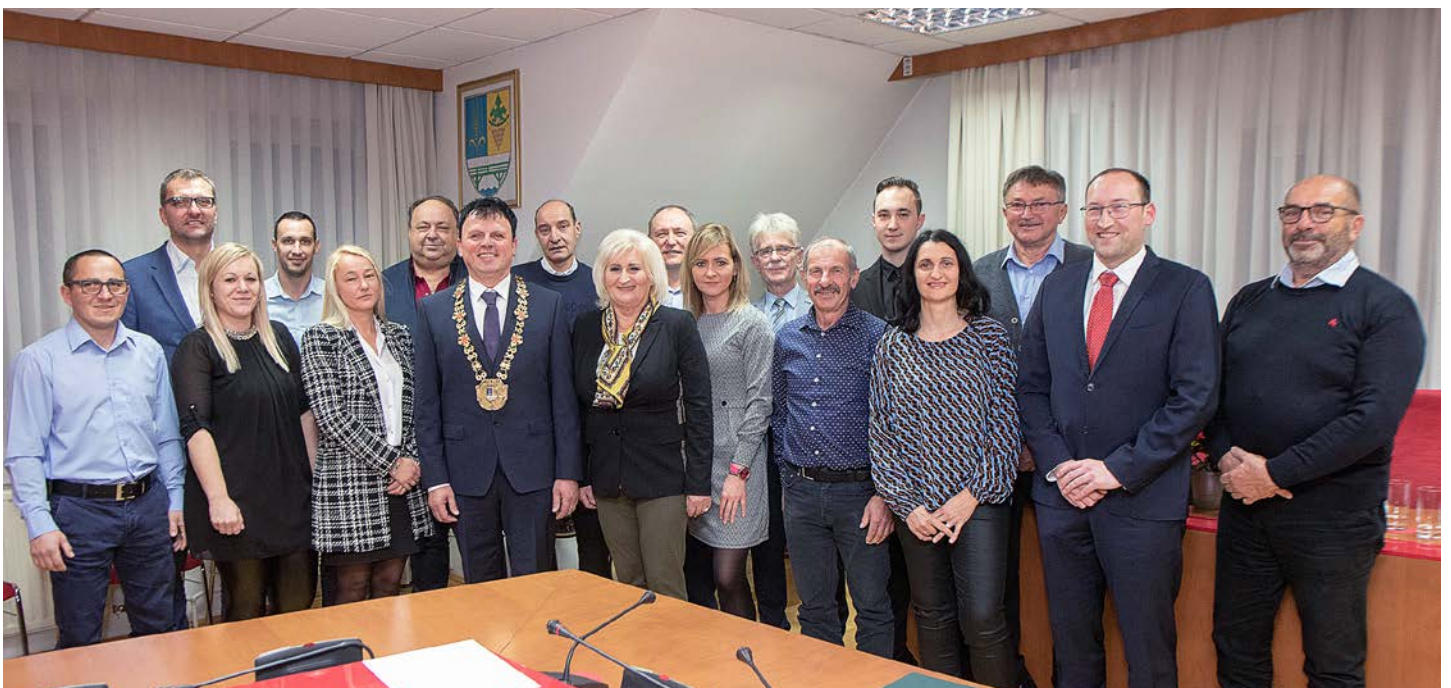
Sestava občinskega sveta v mandatu 2022–2026.