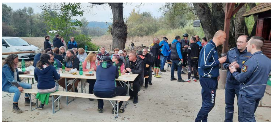
Utrinka z medobčinskega srečanja v športnem parku ob ribniku v Zg. Pristavi

Ekipe so se pomerile v malem nogometu, v individualni demonstraciji nogometnih prvin obvladovanja žoge, v košarkarskih spretnostih in natančnosti v igri raketa in metu trojk ter metu krogle (prave olimpijske – 7,26 kg). Obiskovalci so se ob spodbujanju ekip