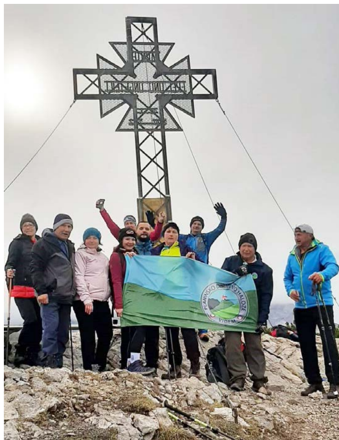
Na Pristovškem Storžiču

zahvaljujemo za udeležbo na pohodih in sodelovanje.