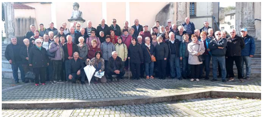
Videmski upokojenci na jesenskem izletu.