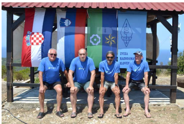
Člani slovenske radioamaterske ekipe

Skupina radioamaterjev iz Slovenije se že vrsto let udeležuje raznih tekmovanj. Tako smo se v zadnjih desetih letih udeležili več svetovnih tekmovanj z jadranskih otokov Vis, Palagruža, Sv. Ivan in tudi z italijanskega otoka Lampedusa, ki je lociran že na afriški celini. Skupina petih radioamaterjev iz Slovenije pa se je odločila, da se bo v letu 2022, v drugi polovici julija, odpravila na otok Vis.