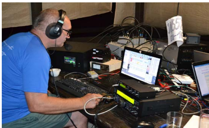
Radioamater Milan med delom ...

Med potjo in ob prihodu domov smo se dogovorili, da naslednje leto ponovno odidemo na novo IOTA ekspedicijo, vendar še ostaja vprašanje, kam se bomo podali, saj je vse povezano z velikimi stroški. Našo odpravo na otok Vis je podprla tudi Občina Videm, za kar se celotna ekipa zahvaljuje.