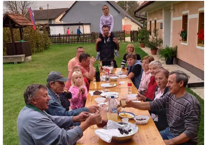
Vesela družba na kostanjevem pikniku.