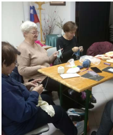
Zankice pri ustvarjanju ...

Poleg kapic so spletle tudi še kar nekaj