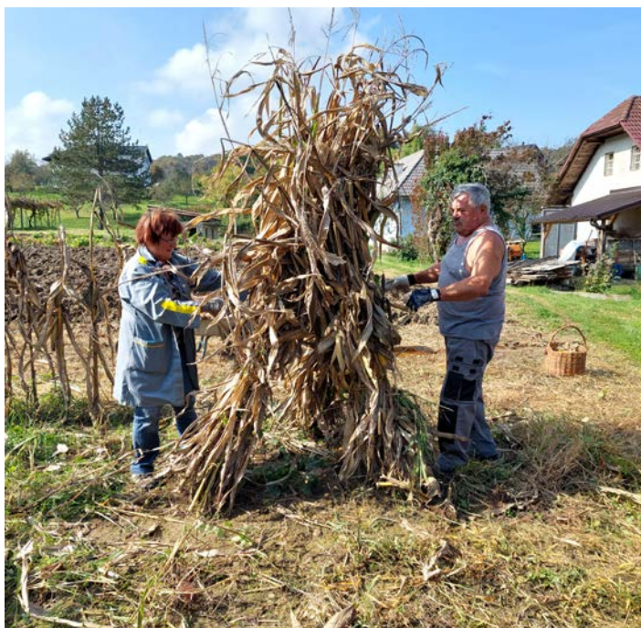
Naredili so tudi koruzno stopo.

končanem delu na njivi smo opravili še kožuhanje. Vsega je bilo za vzorec, a dovolj za prijetno vzdušje in vrnitev v čas, ki je še tekkel počasi.