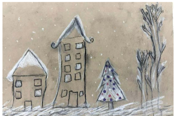
Larisa Krajnc, 5. e