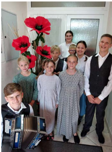
Otroška FS je nastopila na odprtju razstave v Lancovi vasi.