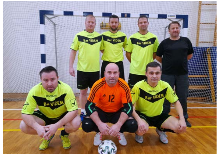
Veteranska ekipa ŠD Videm

ranih pa šest. Člansko ligo sestavljajo ŠD Selan, ŠD Pobrežje, KMN Majolka, Tržec R-21, ŠD As, ŠD Lancova vas, ŠD Zg. Pristava in NŠ Klopotec, medtem ko šesterček v starejši kategoriji tvorijo ŠD Tržec, ŠD Videm, ŠD Pobrežje, ŠD Zg. Pristava, ŠD Selan Girpica in KMN Majolka. Člani igrajo enokrožni sistem, nato pa sledijo tekme med seboj na mestih od 1. do 4. in od 5. do 8., pri veteranih pa se igra dvokrožni sistem tekmovanja, ki bo dal prvaka.