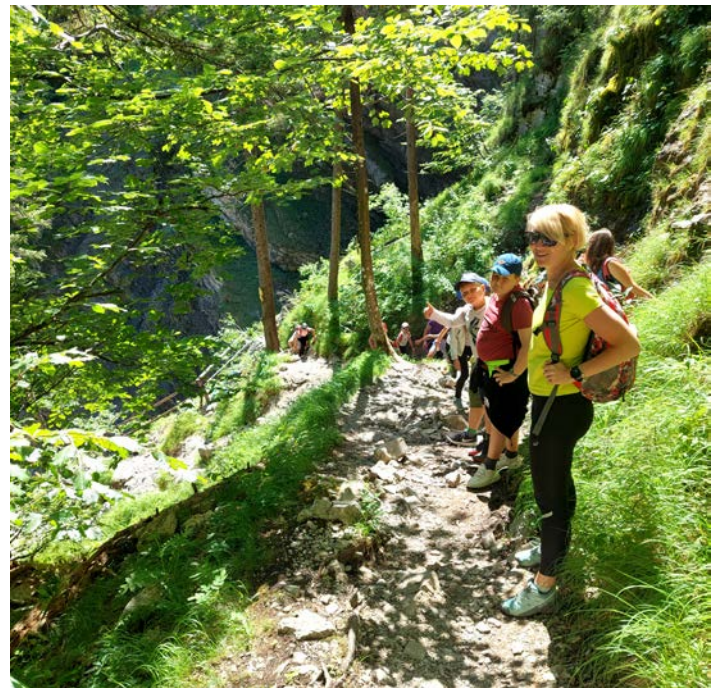
Planinski pohod na Planino pri Ingotu

40 % bomo zmanjšali dejavnike tveganja srčno-žilnih, sladkornih bolezni, ohranjali ravnotežje, zmanjšali tveganje raka dojke (ali prsi, velja tudi za moški spol) in debelega črevesa. Ko združimo zapisano v zadnjih odstavkih in dodamo še možnost druženja, smo na pravi poti k zdravemu življenjskemu slogu. Z zmerno prehrano in omejeno količino alkoholnih napitkov pa bomo tudi odlično praznovali in proslavljali prihajajoče leto in pomlad, ki nas kar sama izvabi izza peči. Pozor! Opisana hoja je dodana vrednost gibanju in hoji zaradi obveznosti. Kdor reče, saj sem bil že vse dopoldne po trgovinah in zadosti hodil, goljufa.