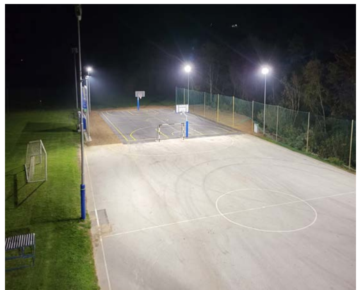
Novo leskovsko košarkarsko igrišče ponoči.