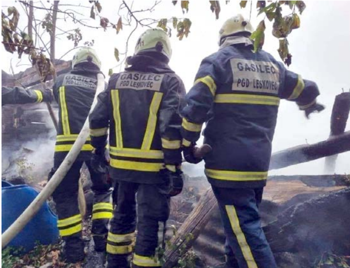
Operativci PGD Leskovec v akciji ...

je uporaba naprav z litij-ionskimi baterijami. Najdemo jih v mobilnih telefonih, prenosnih in tabličnih računalnikih, predvajalnikih glasbe, fotoaparatih, kamerah, igračah, orodju, invalidskih vozičkih, radijsko vodenih modelih, brezpilotnih zrakoplovih (dronih) in podobno. Vsako leto vse več uporabnikov za prevoz uporablja prevozna sredstva na električni pogon (električna vozila, električna kolesa, električne skiroje in podobno), ki jih prav tako poganjajo baterije.