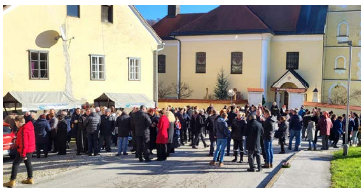
Praznovanje Andraževe nedelje v Leskovcu