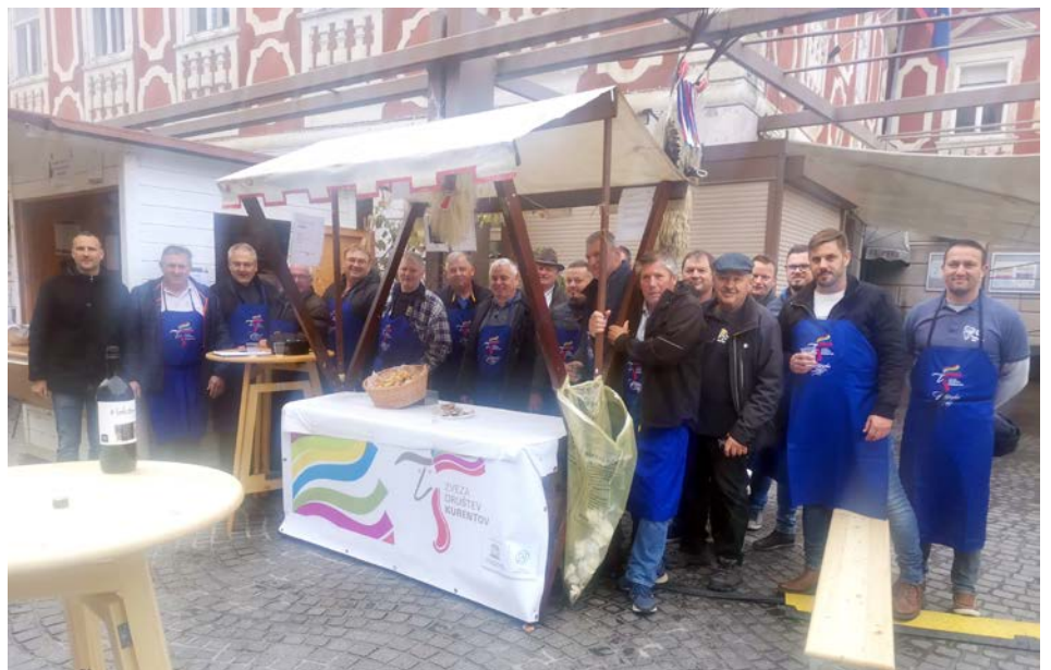
Ekipa lancovskih korantov, ki je sodelovala na ptujskem martinovanju.

Člani društva, okrog 30 se jih je zbralo, so ob pomoči Zveze društev kurentov in Ptujске kleti, ki jim je odstopila svojo hiško, s hrano in pijačo razvajali udeležence martinovanja kot tudi naključne mimoidoče. Glede na obseg dela, njegovo zahtevnost, pripravljenost na delo in številnost, tako velik zalogaj lahko organizirajo le redka tovrstna društva. Koranti iz Lancove vasi tukaj kotirajo zelo visoko, verjetno kar najvišje, zato so bili tudi letos osrednji nosilci ponudbe Zveze društev kurentov in korantov.