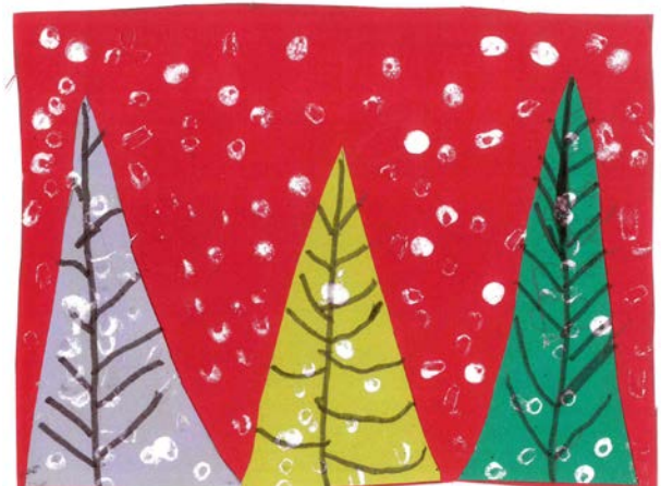
Rene Vogrin, 1.a