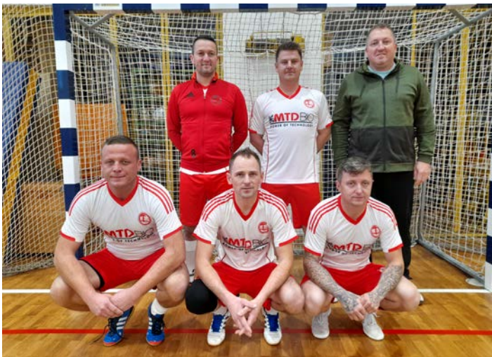
Veteranska ekipa ŠD Tržec