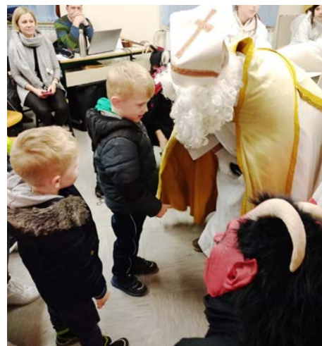
Tudi na selski podružnici je bil sv. Miklavž radodaren.