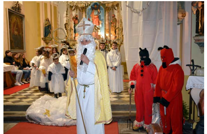
Utrinki z letošnjega miklavževanja v cerkvi sv. Andraža v Leskovcu.