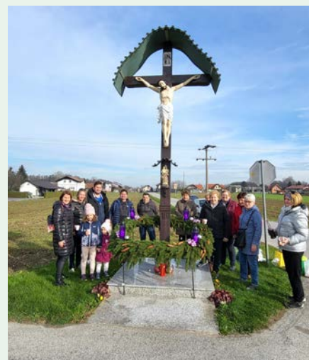
Postavitev venčka.