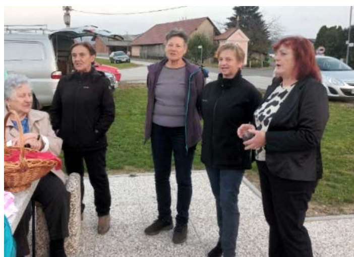
Na dogodku so za dobro voljo poskrbele tudi pevke ljudskih pesmi FD Lancova vas.