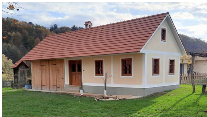
Preužitkarska hiša, replika

Zaključil je z mislijo, da je preužitkarica res pod streho in ima