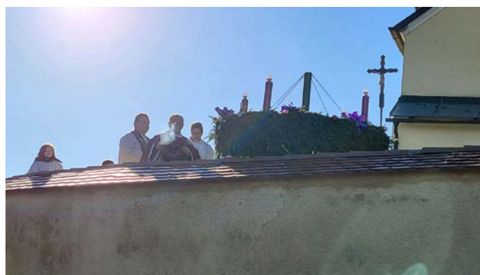
Adventni venec tudi letos krasí cerkveno obzidje v Zg. Leskovcu.