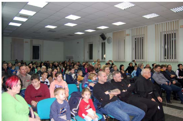
Občinska dvorana je bila polna otrok, ki so nestrpnost čakali na prihod dobrega moža.