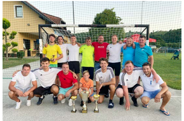
Skupinska fotografija z vaškega turnirja