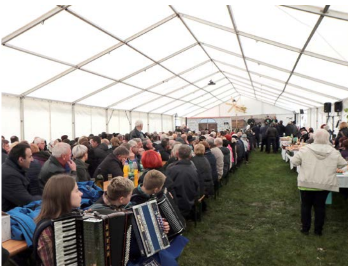
Na martinovanju v Leskovcu je vedno veselo.