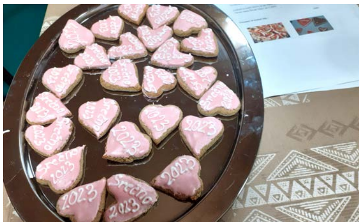
Medene srčke smo pekle v Trzcu.