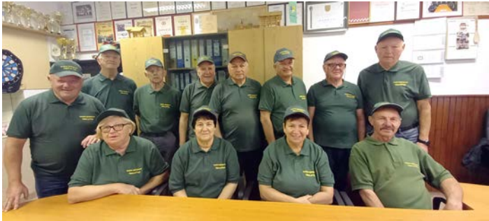
Upravni in nadzorni odbor DU Videm, delno prenovljena sestava

Prizgana svečka na adventnem venčku nam naznaja, da božično-novoletni prazniki trkajo na vrata. To je tudi čas, ko ocenjujemo delo iztekajočega se leta in načrtujemo aktivnosti za leto, ki je pred nami. Čez leto so se zvrstili številni dogodki, ki so polepšali jesen življenja mnogim našim članicam in članom.