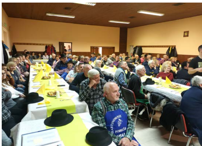
Na veselem martinovanju se je tudi letos zbralo veliko domačinov in prijateljev vinske kapljice.