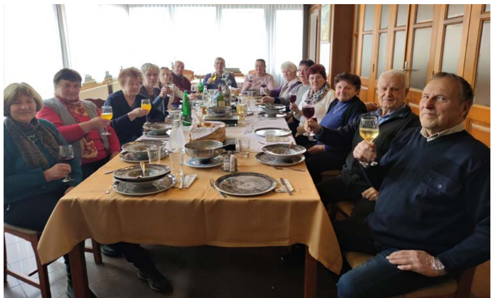
Vodstvo DU Sela se je v decembru zbralo na zadnji letošnji seji.

Vidovičeva je še povedala, da bodo v decembrskih dneh krajane in člane društva obiskali s koledarji, obiskali pa