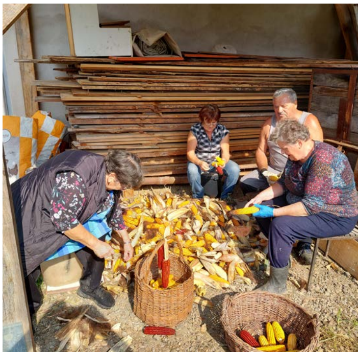
V Doleni so ličkali koruzo ...

Kljub skromni udeležbi na dogodku smo ugotovili, da spretnosti iz polpreteklih časov še obvladamo. Najprej se je koruza potrgala, nato posekalo koruznico in postavilo v stope. Po