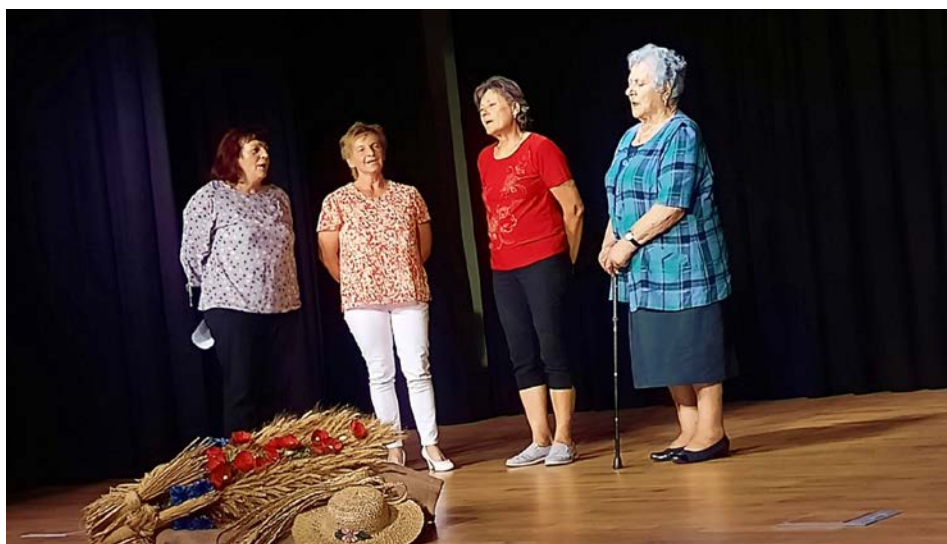
Utrinek z nastopa pevk ljudskih pesmi na pevskem srečanju v Krašnji pri Lukovici