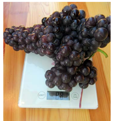
Najtežji grozd, ki je dozorel na potomki stare trte v Dravcih.