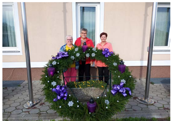
Prizadevne članice so poskrbele, da se tudi Lancova vas letos ponaša z velikim adventnim vencem, ki so ga postavile pred vaškim domom.