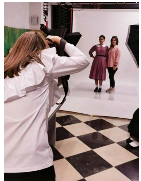
Utrinek z mednarodnega festivala »etno frizure sveta«

Med 16. in 18. septembrom so sodelovali na 13. mednarodnem festivalu