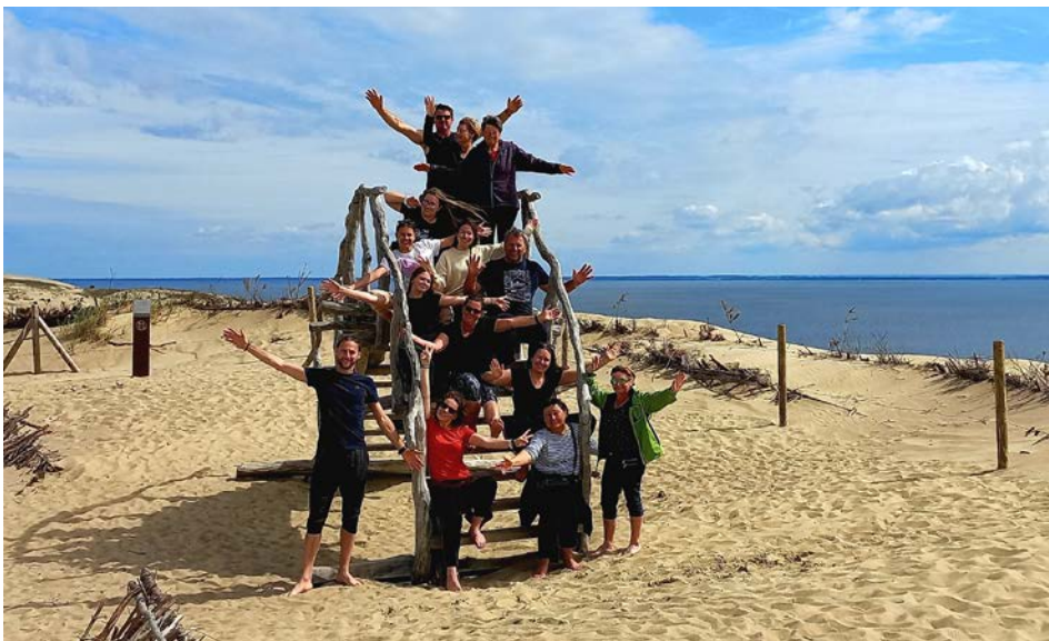
Lancovski folklorniki ob Baltskem morju.

Festival si bomo zapomnili po zelo lepem mestu, prijaznih ljudeh in dobrem vzdušju. Spoznali smo ogromno o njihovi kulturi in tudi kulturi drugih nastopajočih. Spletlo se je veliko prijateljskih vezi in upamo, da se v Plunge še kdaj vrnemo ter zaplešemo, zaigramo in zapojemo, kot smo letos.