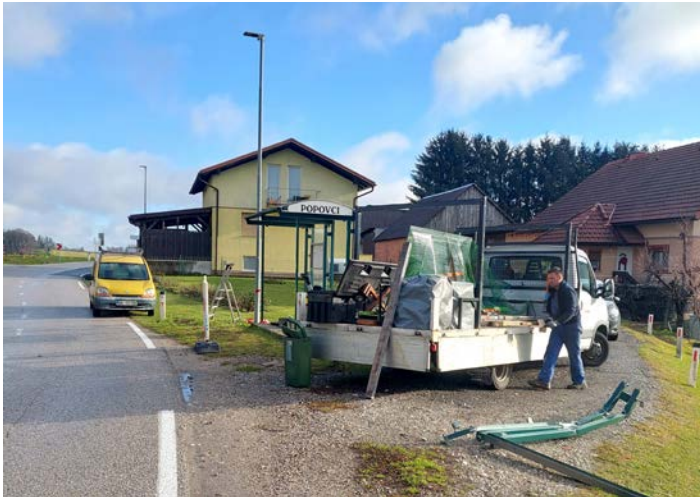
Urejanje avtobusnega postajališča v Popovcih

po utrjene brežine potoka. Med mostičem in cesto v Doleno pa je vse pripravljeno za postavitev novega avtobusnega postajališča. Hvala občini za sodelovanje s strojno ekipo in nabavo potrebnega gradbenega materiala, hvala vaščanom za prostovoljno izvedena strokovno-tehnična in druga ročno opravljena dela. Hvala pa tudi predsedniku KS Dušanu Hebarju za vso potrebno koordinacijsko delo.