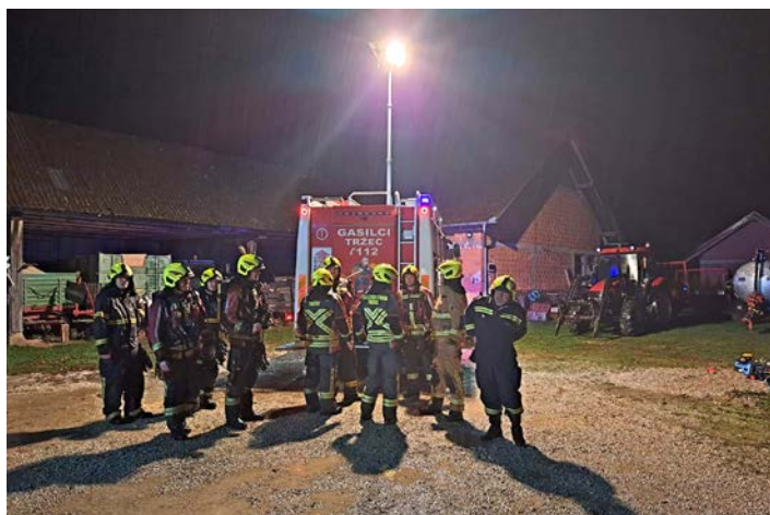
Gasilci PGD Tržec na vaji