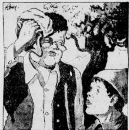
»V moji votlini.«

»To početej torej ni tako grdo,« si misli, »prav gotovo ne, ker prinaša človeku dober dobiček. Zakaj torej ne bi pustil očitarnu ter postal komediant, ko bo Medo moj? To ne bi bilo težko. Saj nisem ničesar na dolgu gospodu Giampaoliju; prej mi je on dolžan dnino za nekaj dni, ki pa mu jo rad spregledam. Nič me ne ovira, da ga ne bi smel zapustiti, kar sem v ostalem že sklenil davni. Po drugi strani pa zdaj poznam Meda, prepričan sem, da mu ugajam in da ne bo zahfeval ničesar drugega, kakor da bo stopal za menoj. Kratko malo, videl sem, kako je delal z njim njegov gospodar, in zdi se mi, da ga bom znal posnemati. Lahko pojdem z njim