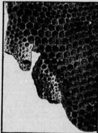
Kos satja; na levi strani matičnjak

Čebela, ki leta od cvetlice do cvetice, ne obiskuje le trat okrog panja, temveč je dokazano, da se oddalji do 3 km od doma. Ako računamo le polovico te poti, torej 3 km za tja in nazaj, tedaj je potrebnih 37.500 takih izletov za 40 miligra-