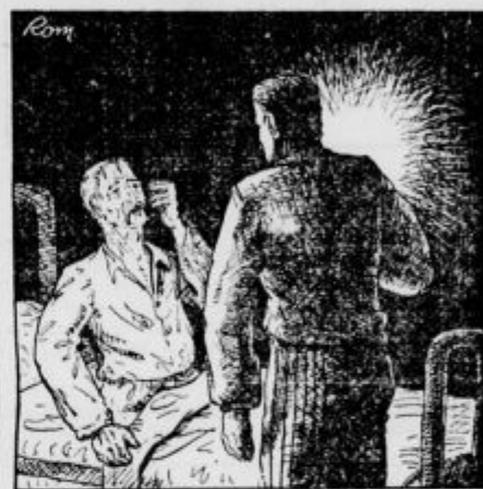
»Pri moji veri, da je on!«

Stavec je zrl nepremično v fantov obraz. Zdrznil se je in umaknil k zidu.