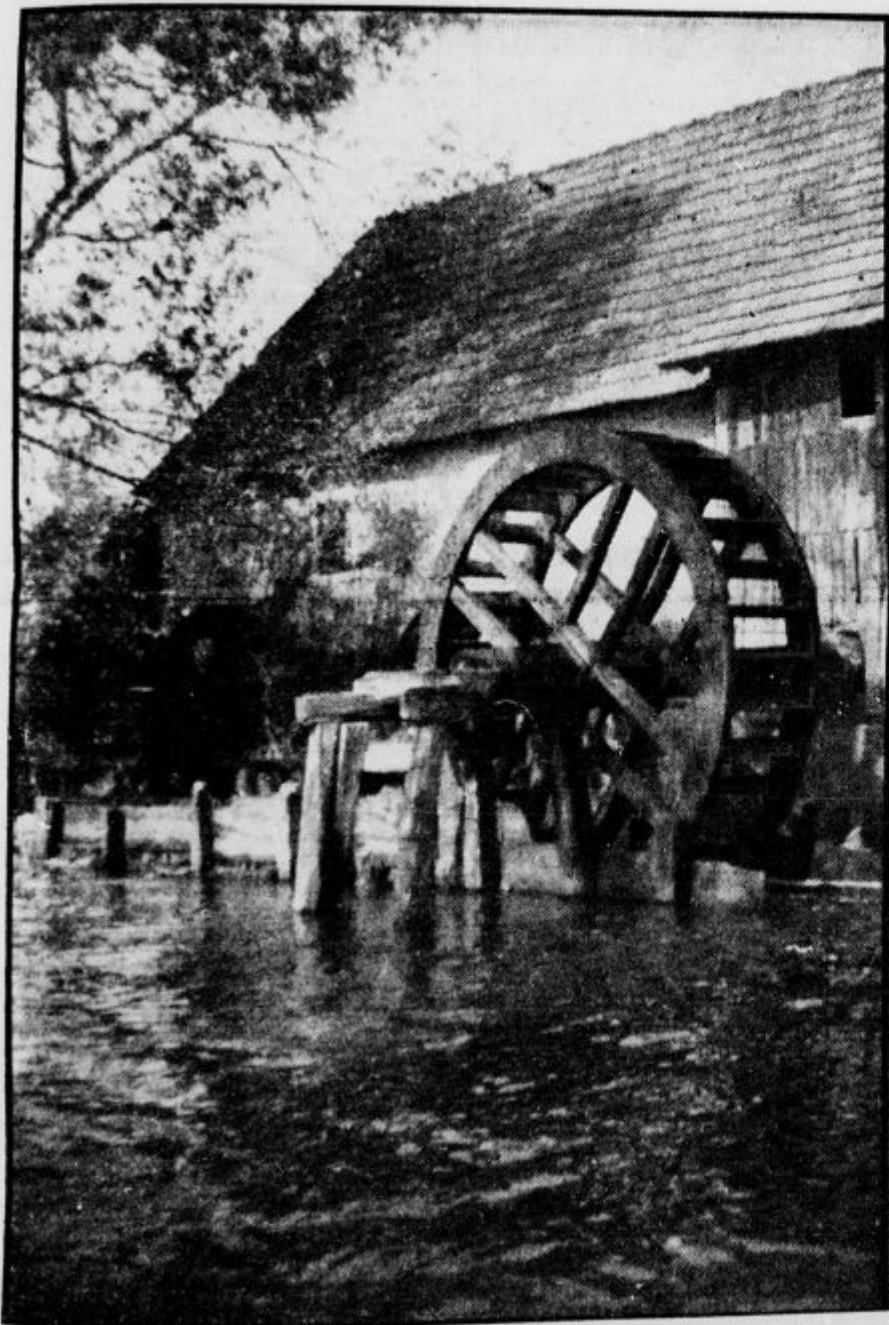
Mlin na vodi