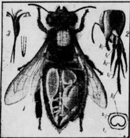
Delavka z odprtim zadkom, posebej glava in telo — vse povečano

V čebelni zadrugi ločimo troje vrst članov: nekaj sto samcev, t. j. trotoev, nekaj tisoč delavk,