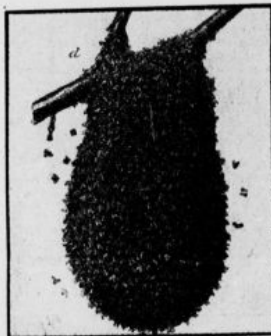
Roj v zmanjšani meri

Izračunali so, da je pri čebelah potrebnih 12.000 delovnih ur, da naberejo in izdelajo pol kile medu. Ako bi morda to delo napravila ena