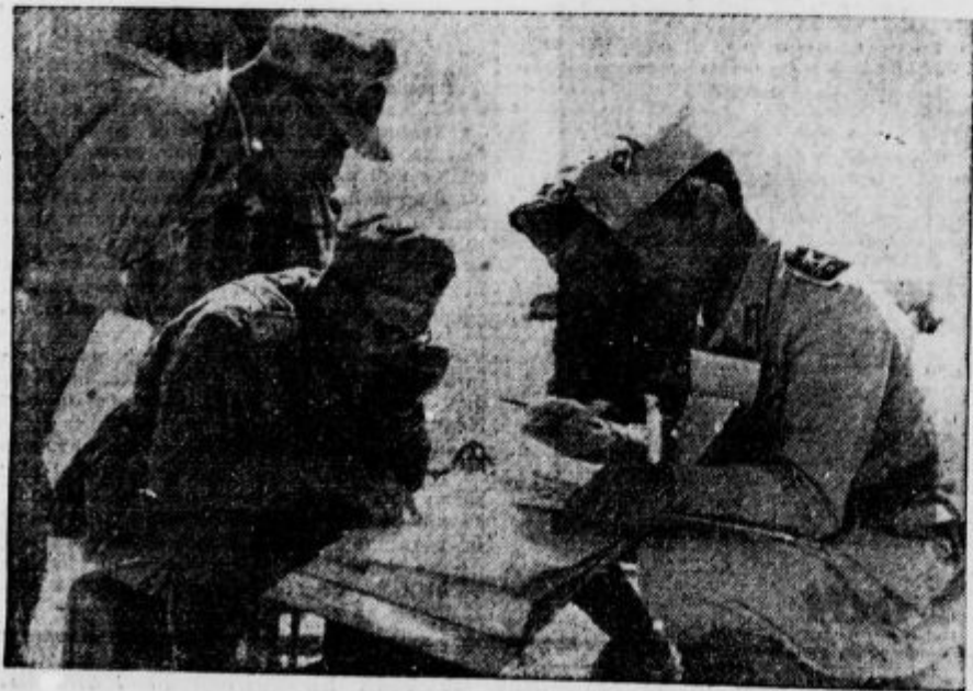
Poveljstvo velike italijanske edince na egiptovski sronti.

25 dikg težka toča je padala te dni v vzhodnem delu Slovaške in napravila veliko škodo.