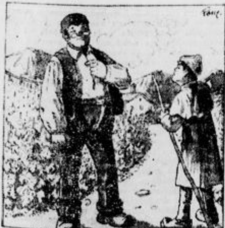
»Zdaj pa vem, kaj bom storil z medvedom!«

Tokrat se dečkov rezki glas prav dobro razloži. Gospodar se obrne in zagleda iz oči v oči pred seboj Giampaolijevega pastirčka vsega zapoplega; ker so dečkove sandale pregluševale šum njegovih stopinj, ga ni bil slišal, ko je prihajal.