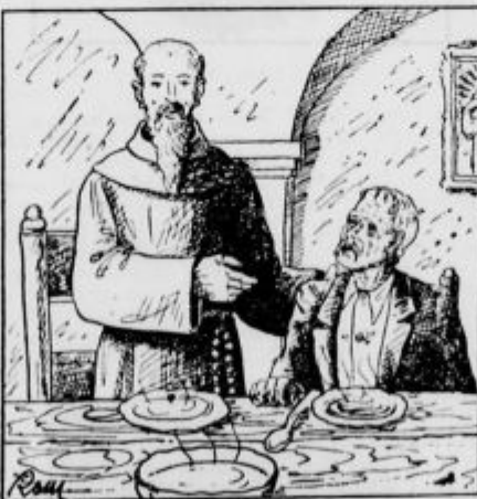
»To je moj oče!«

Brat Klemen je ravnokar prijel za klavdvo in udarjal po zarjaveli železni plošči, da bi priklical menihe k večerji. Gregor je začuden gledal, kako se iz temnih hodnikov prihajali kapucini, kakor čebele iz panja. Gvardijan ga je peljal v veliko obednico ter ga posadil zraven sebe. V dolgih vrstah so stali kapucini z rokami v širokih rokavih in molče čakali na molitev. Na znamenje so začeli z molitvijo ter se sklanjali k tlem. Ob koncu so se pripognili prav do tal in poljubili pod. Brez besed so tiho posedli na svoja mesta. Mlajši kapucin je štjal iz debele knjige na glas. Gregorju je bilo tesno pri srcu. Obratjal je v zadregi oči k velikim, okajeni lampi, ki je visela izpod lesenega stropa in metala medlo luč po obširnem prostoru. Dva brata sta nosila na mizo preprosto jed, ki se je kadila iz velikih skled. Gvardijan je zajel in naložil Gregorju na krožnik. Potrkal je po mizi, vstal in predstavil Gregorja družini: To je moj oče! Izbral si je naš samostan, da bi v njem preživel še zadnja leta svojega življenja. Blagoslovljen, ki prihaja v imenu Gospodovem!«