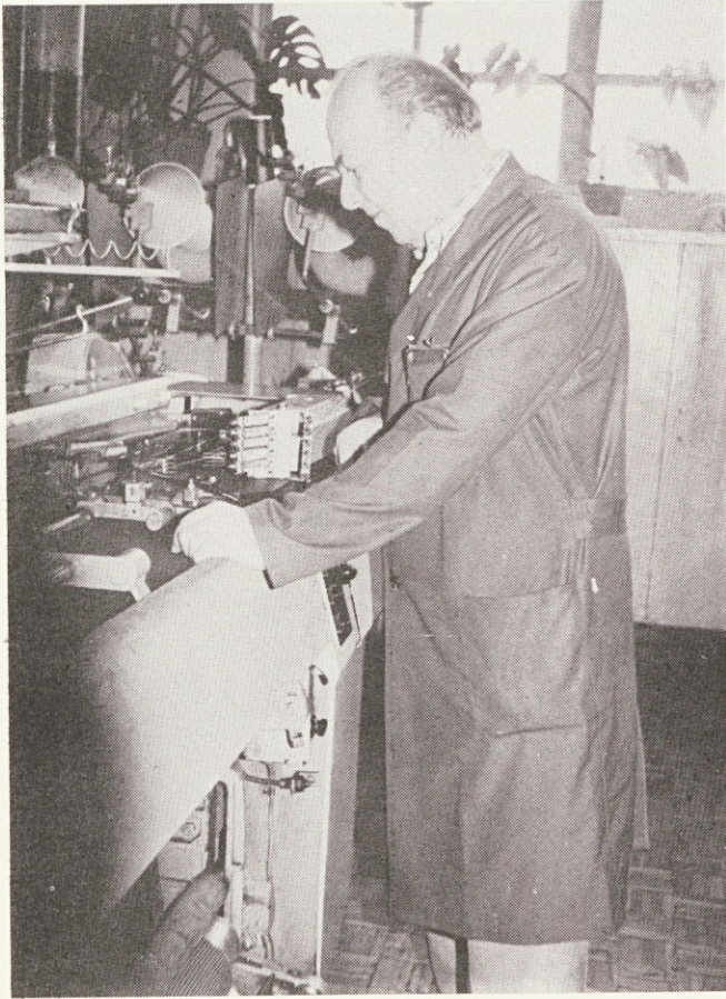
„Želim si zdravja in da bi bil mir na svetu. Želje po novih delovnih prostorih se nam bodo končno uresničile“