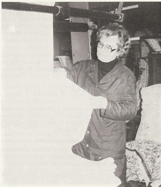
„Čutiti moramo večjo pripadnost Svilanitu“

Marija je še predlagala, da bi uvedli preventivne sistemske preglede tudi v drugih enotah in ne samo v tkalnici. To si sigurno zaslužijo tudi druge delavke, ki so v Svilanitu že 15, 20 ali več let. „Delavke – matere – samoupravljalka bi morale odločno protestirati proti uvedbi 40-letne delovne dobe za ženske. Vsi vemo, da opravljajo žene pri nas še vedno dvojno delo – službo in gospodinjstvo, zato so po 35 letih dela izčrpane. Bolje bi morali poskrbeti za tiste, ki so 2 ali 3 leta pred upokojitvijo, poiskati bi jim morali primerno