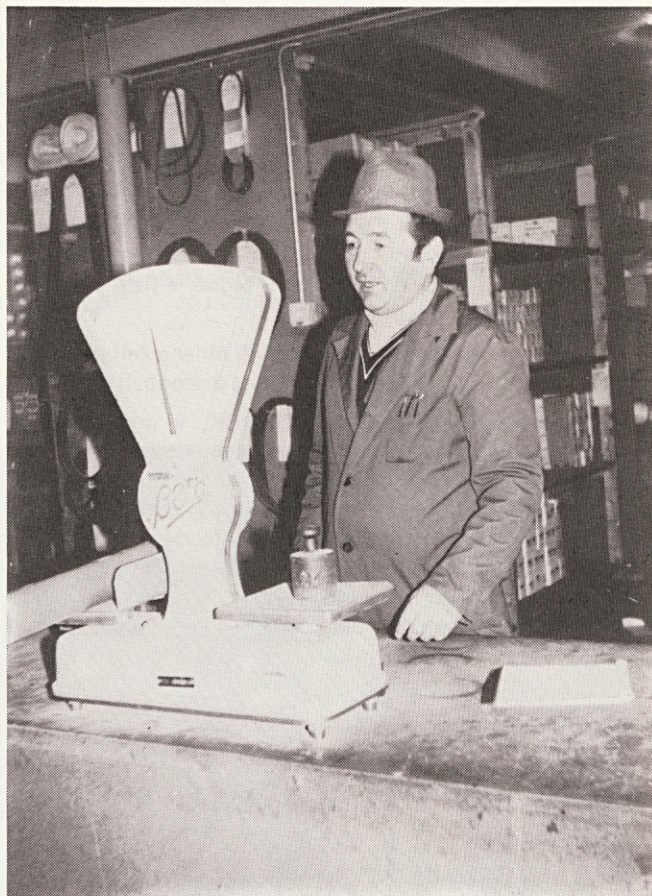
„Da bi se skladišče izpopolnilo in posodobilo“