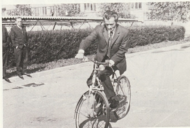
... in poceni

„KAMNIŠKI TEKSTILEC“ LETNIK XVII. ŠT. 11–12 GLASILO DELOVNE ORGANIZACIJE „SVILANIT“ KAMNIK GLASILO UREJUJE UREDNIŠKI ODBOR: Balantič Silvo, Huban Anka, Alenka Doplihar, Stankovič Brane, Okorn Tomaž Tehnični urednik: SKAMEN IVANA Odgovorni urednik: BORIS ZAKRAJŠEK NAKLADA: 800 IZVODOV Tisk: Mestni muzej Idrija