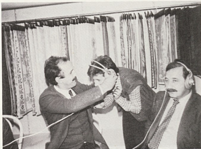
Poslušanje glasbe pred pričetkom oddaje