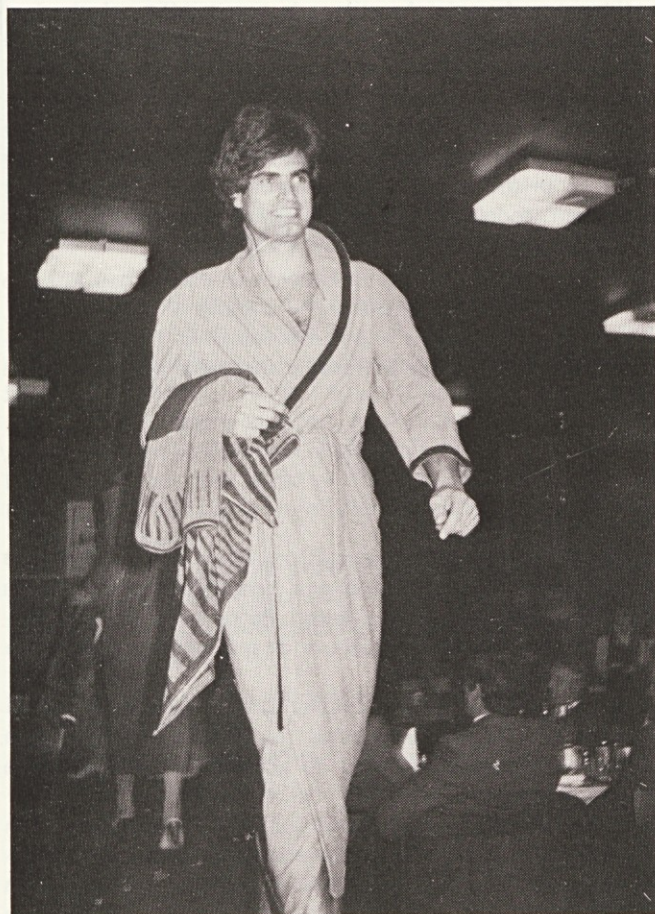
Konfekcijski izdelki so kupcem ugajali

Na zaključku jubilejnega leta smo v okviru prireditev ob našem prazniku organizirali tudi obisk kupcev naših proizvodov in poslovnih partnerjev v Svilanitu. Poleg vablencev iz cele Jugoslavije so se srečanja udeležili tudi zaslužni člani izvoznih organizacij, preko katerih plasiramo največ naših izdelkov na tuja tržišča. Pred oceno pomembnosti in uspešnosti srečanja, bi pogledali celotni potek prireditve.