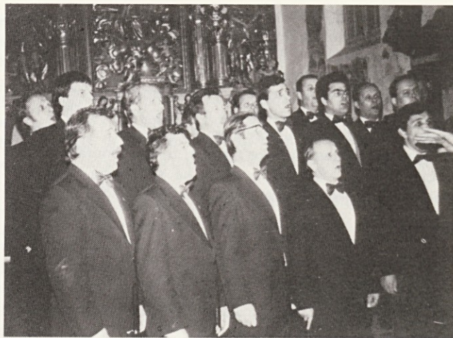
Lira je prispevala k svečanemu vzdušju

Po kosilu smo si ogledali otok in prisluhnili kvalitetnemu nastopu pevskega zbora Lira iz Kamnika, ki je v ambientu