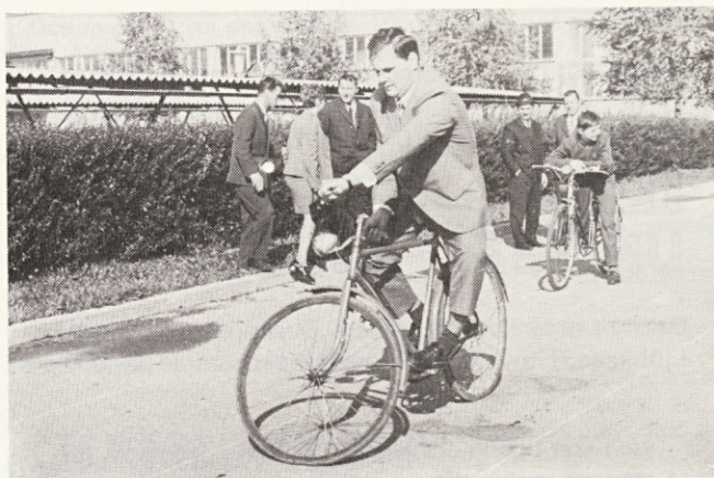
Za vzor: Zdravo...