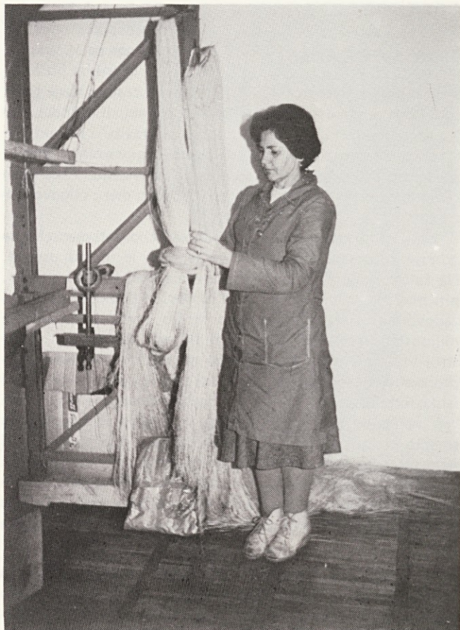
„Vedno sem si želela nove stroje in boljše delovne pogoje“

Ko sem jo vprašala, kakšne so bile želje ob novem letu nekoč, mi je povedala: „V podjetje sem prišla leta 1948. Stroji so bili zastareli, danes bi jih odpeljali na odpad, takrat pa smo na njih še vedno ustvarjali, seveda z mnogo večjim trudom. Betonska tla smo polivali z vodo, da smo dosegli primerno vlažnost. Osnove smo že ustno škrobili, kar se zdi danes marsikomu nerazumljivo. Na strojih smo delali največ trde kmečke rute (to je bila takrat trenutna moda, danes jih skoraj ne vidimo več) in vsakokrat, ko sem hotela narediti