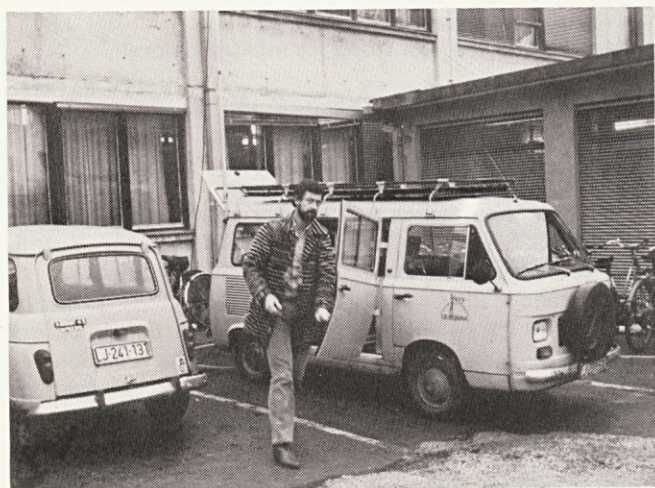
Reportažni avto s tonskim tehnikom pred tovarno