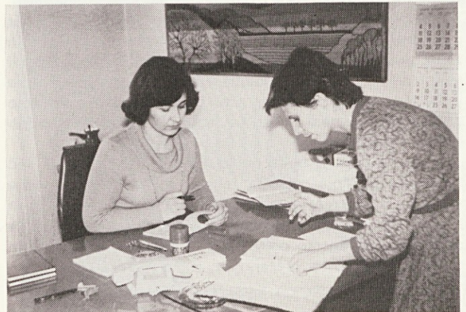
Obe si želita uspehov na novih delovnih področjih

V svojem delokrogu imam sedaj tudi dela za naše tovarniško glasilo. To je zelo ugodno, ker se bom lahko časopisu bolj posvetila. Prej sem morala iskati čas za urejanje našega lista med svojim rednim delom in zvečer doma. Trudila se bom, da bi izboljšali kvaliteto našega glasila, da bo aktualno in zanimivo za vse. Novinarstvo me je veselilo že v šoli, posebno rada se ukvarjam s socialno družbeno problematiko. Delo pri časopisu mi pomeni neke vrste sprostitev, še posebno ker lahko delam samostojno in imam popolnoma proste roke.