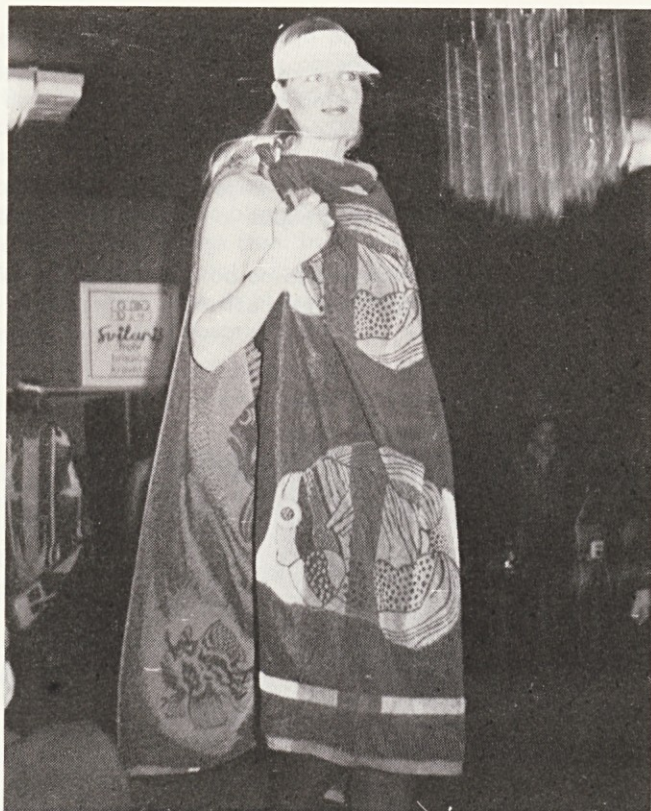
Brisače, brisače . . .