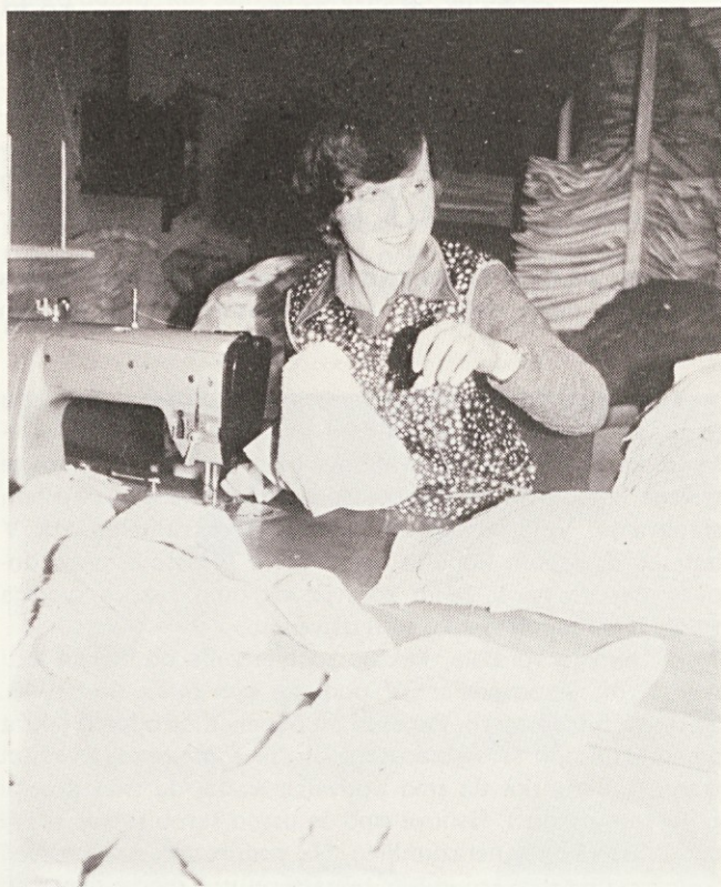
„Vsem enake pogoje dela“