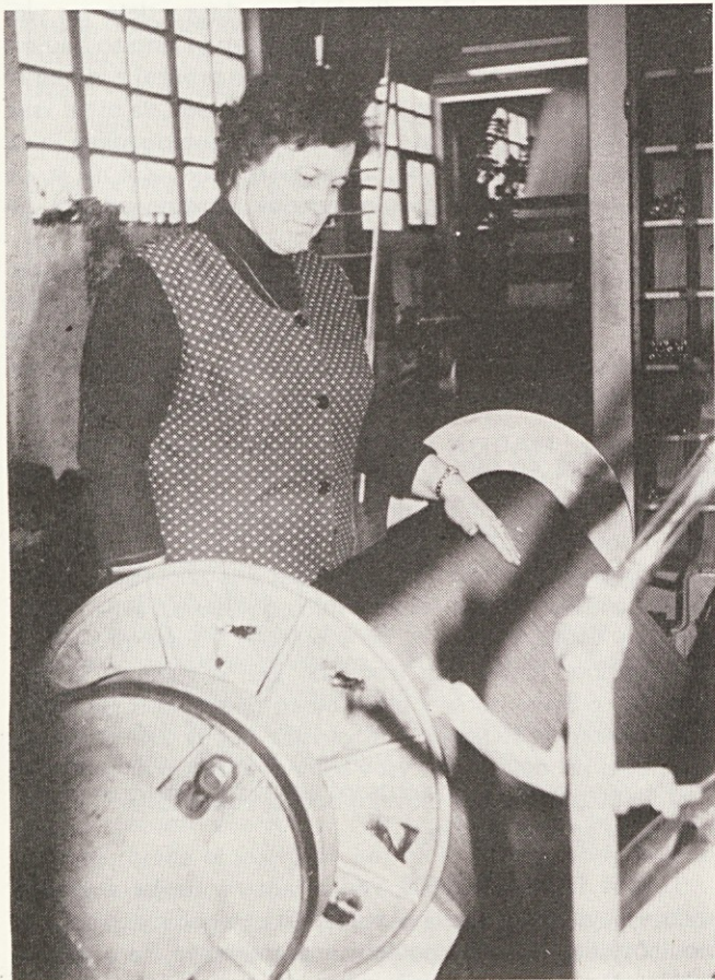
„Predvsem si želim, da bi bilo moje delo pravilno ocenjeno in res plačano po vloženem trudu“

spremembo še najbolj občutila jaz, saj zdaj zaradi prostorske stiske večkrat ne vem kam z robo. Kljub nemogočim delovnim pogojem naredimo veliko. O tem pričajo tudi podatki o poslovanju. Vidimo, da niso bili zaman naši napori, ko smo zaradi trenutne situacije na tržišču večkrat delali nadure in proste sobote.“