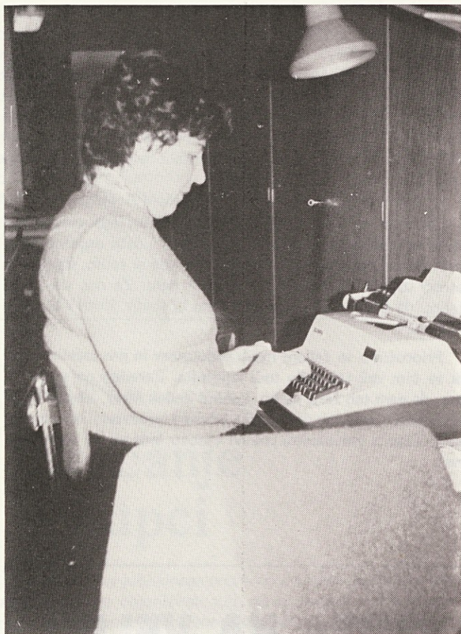
S selitvijo v nove prostore se ji bo izpolnila želja po primernejšem delovnem prostoru

uvoza. Vsak ukrep v smislu varčevanja z devizami pa potem čutimo na tržišču. Tako stanje povzroča seveda zastoje in težave v proizvodnji.