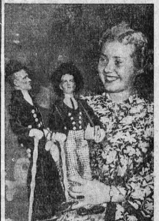
Podoba o pripravah za mednarodno obrtniško razstavo v Berlinu, ki bo od 28. maja do 10. julija t. l. Na razstavi bodo lutke predstavljale posamezne narodne noče.