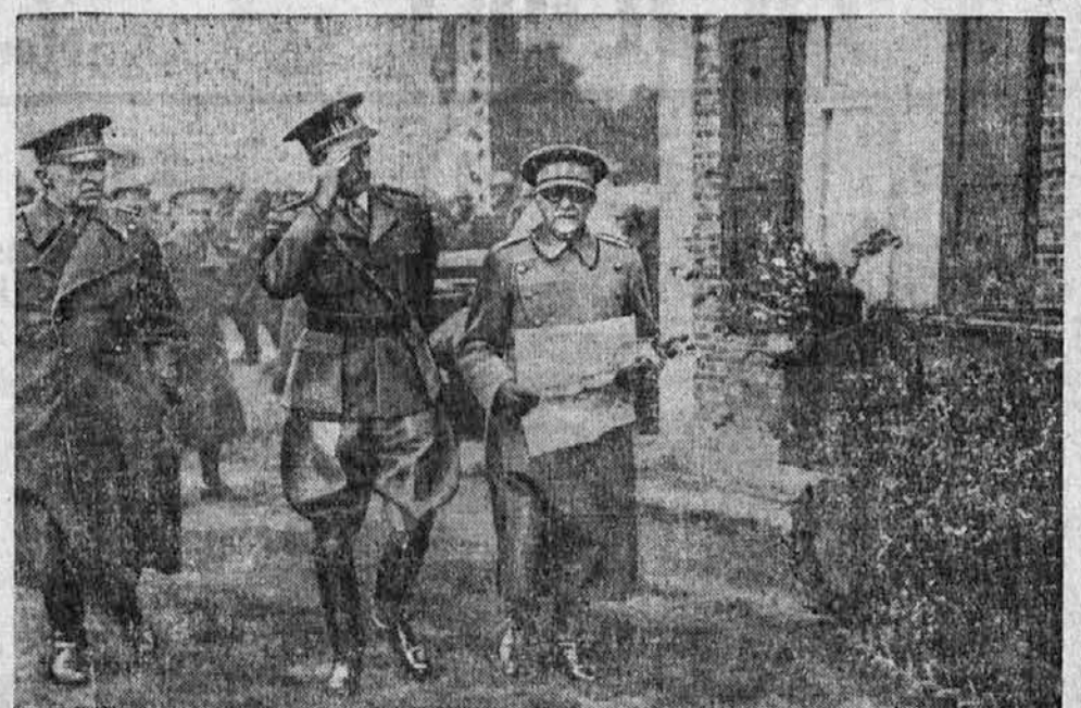
Belgijski kralj Leopold na manevrih belgijske vojske. Na podobi kralj Leopold v spremstvu generalov Berghoja in Denisa pri pregledu čet.