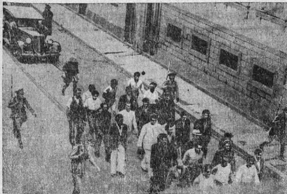
Vstaja v Braziliji. V prejšnji številki »Edinosti« smo že poročali, da je pretekli teden izbruhnila v glavnem mestu Brazilije Rio de Janero vstaja fašistično usmerjenih desničarjev. Vstaji so se hoteli polastiti vodstva države, pa je vladi predsednika Vargasa uspelo v najkrajšem času zadušiti vstajo. Na podobi vidimo, kako straže ženejo oddelek upornikov, ki so se po brezupnem boju vdali.