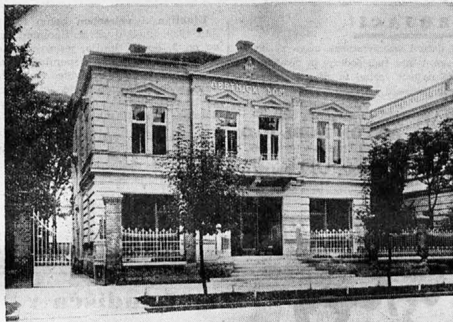
Poslopje »Obrtniškega doma« v Osijeku. V pritličju se vidijo dvorane, v katerih je stalna obrtniška razstava