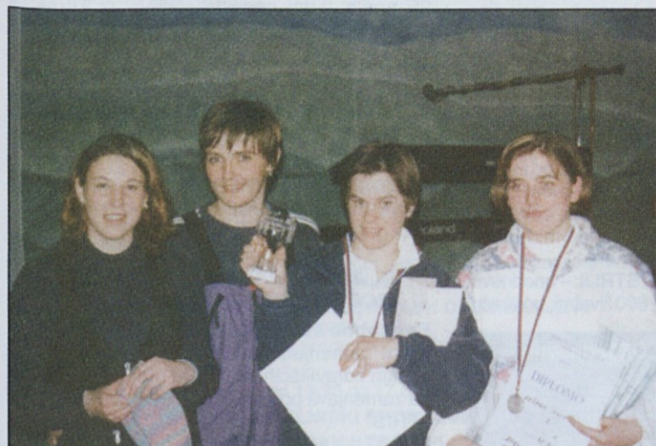
Najmlajše, najlepše, najhitreje...