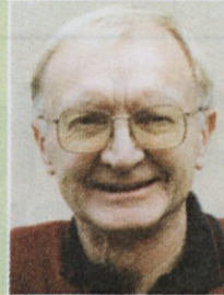
Piše: Doro Hvalica