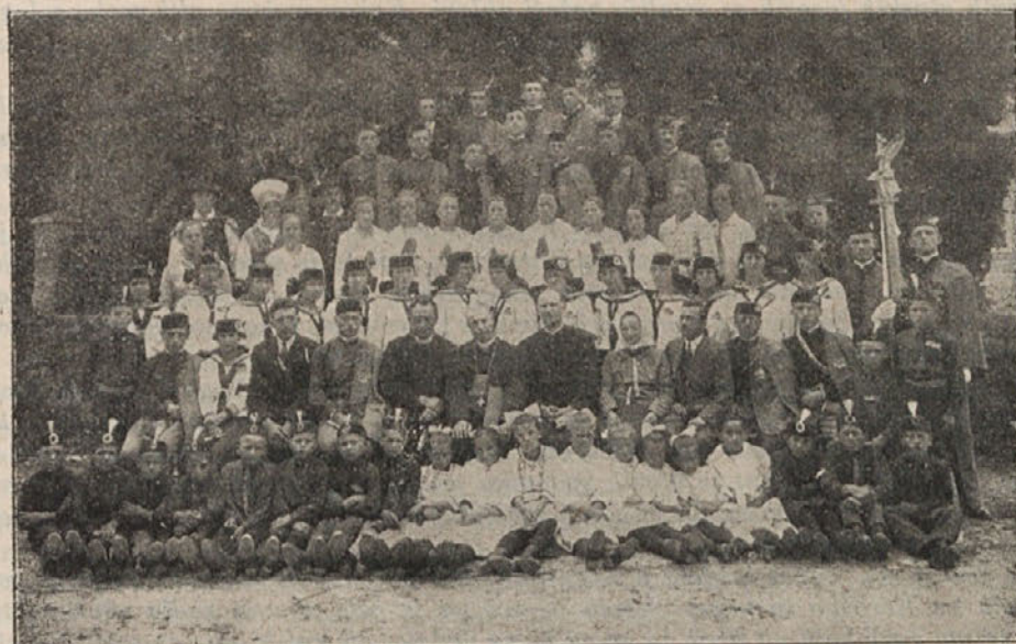
Moravska orlovska družina ob blagoslovitvi novega prapora, 22. julija 1928.