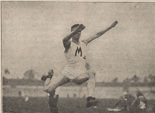
Dobermann, ki ima nemški rekord v skoku na daljavo: 7,53 m.

K takim spadajo tudi tisti, ki so ali hote ali nehote pozabili, da tvorijo prav za prav le skupnost. Ki so pa pozabili obenem tudi nase in so menili, da so že izpolnili svojo in vseh dolžnost s tem, da so sploh šli. Pa so šli potem kakor že. Da so pač šli! Nič ne bom pravil, koliko je bilo takih in kako so grešili; utegnila bi se mi utrgati prehuda beseda in potem je spet