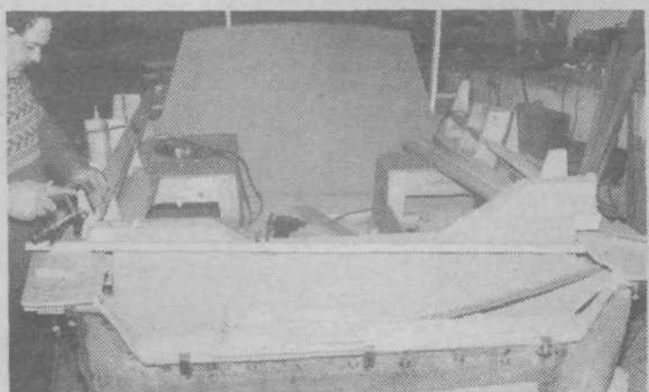
Izdelava modela za kasnejši kalup jadrnice Adria 500. S kalupom je mogoče kvalitetno izdelati okrog 100 plovil, potem pa je za nadaljnjo proizvodnjo možno uporabiti tudi prvi »odlitek«, ki ga po običaju skrbno shranijo.

Tudi modela za čolna Adria 500 in Adria 400, s katerimi je mlada Adria začela, sta bila izdelana v Hrušici. Lani je bila na Zagrebškem velesejmu Adria 500 izbrana za ladjo leta in je dobila med razstavljenimi prvo nagrado. Vendar je kljub velikemu razmahu nautičnega turizma pošla »sapa« tudi delovni organizaciji Adria, ki je morala upočasniti proizvodnjo, podobno tudi Elan. Treba se bo pač nekako pretolči do boljših časov.