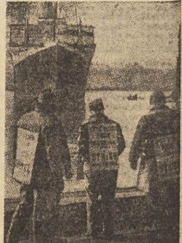
Stavka pristaniških delavcev v New Yorku

Naslednjega dne so komunarji izpraznili Magistrat. Nekako okrog desete ure, ko je bil umik končan, se je z glavnega stolpa pokazal ogenj; čez eno