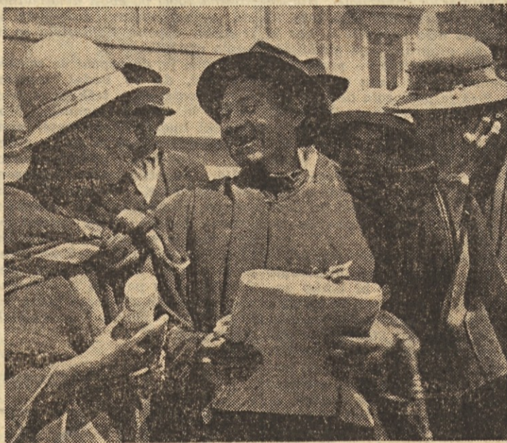
Agrarna reforma v Boliviji... Kmetijski delavec je dobil zemljo, o kateri je sanjal vse svoje življenje

Obisk delegacije sovjetskih sindikatov v naši deželi je — prav tako kot obisk naše sindikalne delegacije v Sovjetski zvezi — omogočil široko izmenjavo mnenj o problemih socialistične graditve in okrepil prijateljske stike med sindikalnimi organizacijami Sovjetske zveze in Jugoslavije.