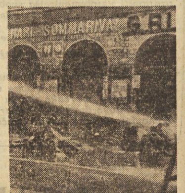
Italijanska policija z brizgalnami razganja stavkajoče delavce

Za zdaj je najmočnejša skupina v italijanski krščanski demokraciji tako imenovana Inicijativa, ki jo vodi generalni tajnik stranke Fanfani. Ta skupina je zmagala na kongresu demokristjanov v Neaplju. Spetokpa se je nagibala k levi, zadnje čase pa stoji nekje v sredini, čeprav so nekateri njeni voditelji že zelo blizu desnice. V svojem programu ima ta struja nekaj socialnih zahtev, vendar ne toliko, da bi podpirala vse Segnjevje ukrepe. Na splošno pa je bila doslej lojalna nasproti Segnjevji vladi, ker je menila, da je dandanes edini izhod — štiristrankarska vladna koalicija.