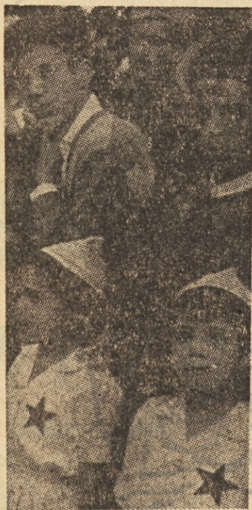
Veselje maroškega ljudstva ob proglastitvi neodvisnosti Maroka

Naslednjega dne so komunarji izpraznili Magistrat. Nekako okrog desete ure, ko je bil umik končan, se je z glavnega stolpa pokazal ogenj; čez eno