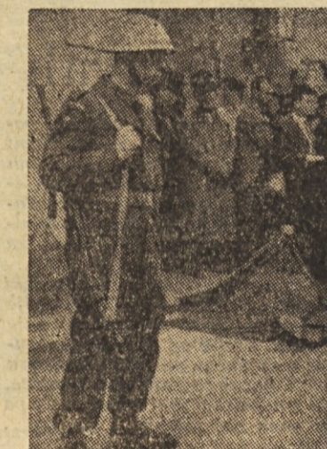
Angleško nasilje na Cipru

treba uveljavljati tudi zunaj političnega življenja, v gospodarskem, družbenem in celo družinskem življenju. Najti moramo nove oblike osamosvojitve. Kakršna demokracija bomo ustvarili, takšna bo tudi svoboda, za katero težimo.«