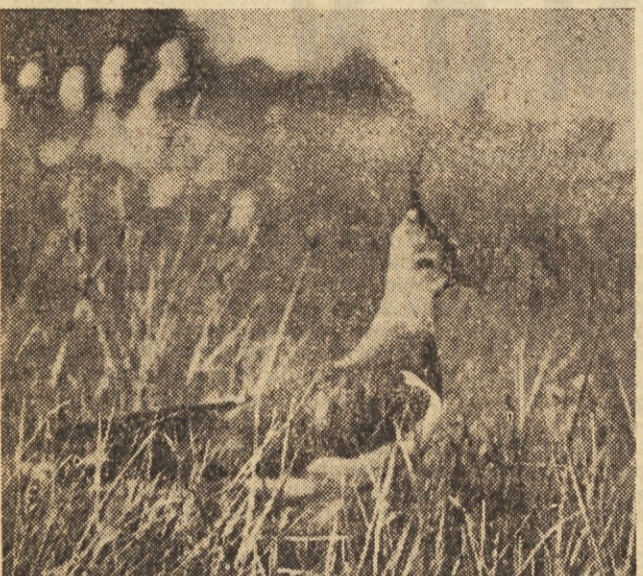
Med prvimi pticami seltokami se vrnejo k nam pribe. Cez krila meri riba tričetrt metra. Po hrbtu je kovinsko-zelena z rdečkastim leskom. Živi po močvirjih

Iz Ljubljane vozi redno avtobus, prav tako tudi pri povratku. Cena za pet dni je 4400 dinarjev. V ta znesek so vračunane vse usluge, kakor prevoz, prenočišče in prehrana. Huda je, morda se bo pa le kdo opogumil. Sicer pa niti ni tako drago, če računate kakšne cene so drugod po hotelih.