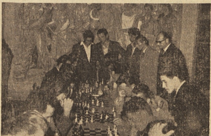
Na delavskih športnih igrah kovinarjev so se pomerili tudi v šahu

novih naročnikov si že pridobil? Pomni, to je važno kulturno opravilo!