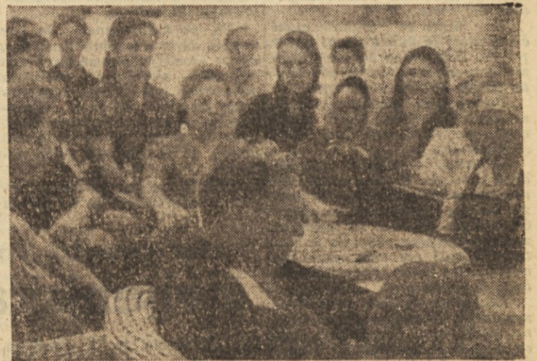
Sleherni prosti čas porabi tovariš Tito za razgovore s preprostimi ljudmi. Posebno ljubezen posveča tovariš Tito mlademu rodu

Bistveno v delu delavskih svetov in upravnih odborov bi moralo biti, da bi o nobeni stvari