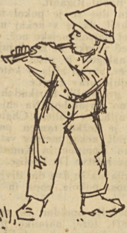
Jemec: Otrok s piščalko

Povsem razumljivo je, da so ti dopisi povzročili med našimi člani utemeljeno zgražanje nad takimi poskusi, nad takimi zavijanjji in lahko rečemo zlorabami avtorske pravice. Vprašamo pa se, kaj bodo na tako ravnanje odgovorili naši umetniki, izvajalci. Ali bodo dopustili, da bo ta njihova institucija tako blatila njihov ugled in njihovo vlogo v naši družbi? Ali morejo dopustiti, da bi ta institucija s takimi poskusi njihova umetniška prizadevanja, ki jih prav naše organizacije tako vsestransko podpirajo, zredcirala na — sebično zaslužkarstvo na račun našega članstva, na račun kulturno-prosvetne vloge sindikatov. Prepričani smo, da tega ne bodo trpeli. Pa tudi naše organizacije ne morejo trpeti take »uvidevnosti«. Ne odrekaajo pravic, ki izvajalcem pripadajo. Toda nihče ni priznal Jugoslovanski avtorski agenciji in njenemu zastopstvu za Slovenijo pravico, da nalaga podružnicam pod pretjno pravne poti obveznosti, ker »posredujejo radijski sprejemniki in da redno plačujejo članarino«. To je samovoljnost, ki ne more in nima mesta v zaščiti avtorskih pravic, ker je zgolj izraz, kako na cenen način priti do dohodkov ne glede na posledice.