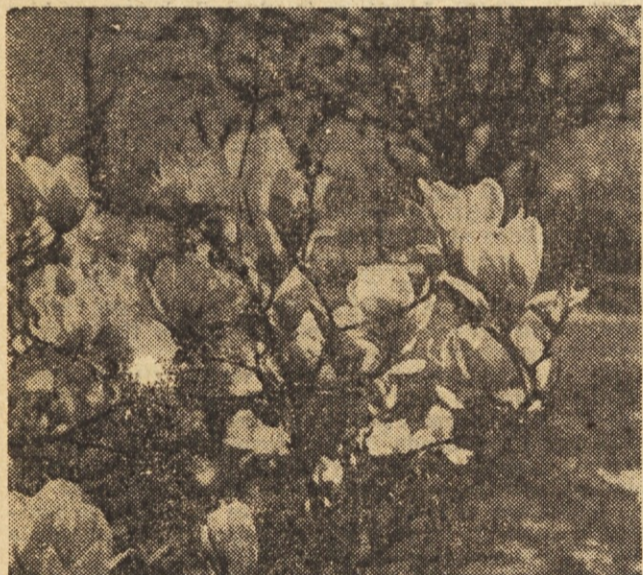
Magnolija je južno drevo, ki se je tudi pri nas udomačilo. Goje jo v parkih zavoljo sila lepih, velikih rožnatih cvetov in cvete prav v maju. Mestnim ljudem, ki ne najdejo poti v naravo, naznanja pomlad