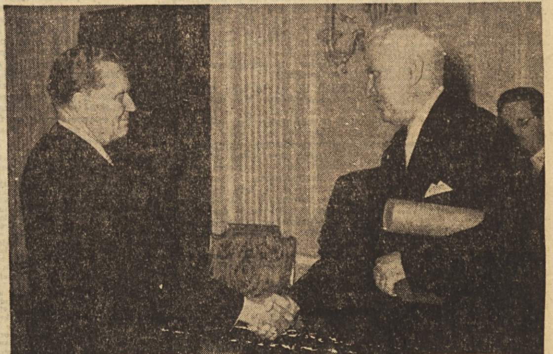
Tovariš Tito izročal predsedniku naših sindikatov tovarišu Djuru Salaju visoko odlikovanje

Staremu in preizkušenemu revolucionarju, predsedniku naših sindikatov tovarišu Djuru Salaju tudi slovenski delavci skupno z delavskim razredom vse Jugoslavije iskreno čestitamo k velikemu in zaslužnemu priznanju.