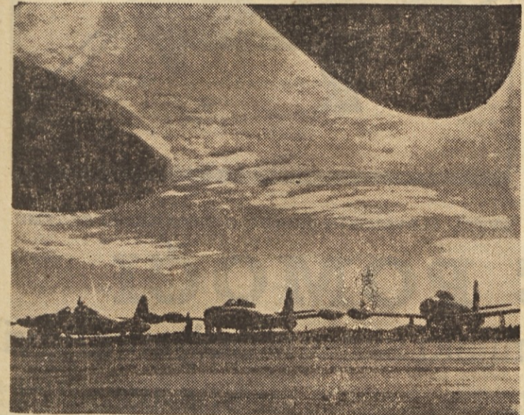
Naša armada in vsi delovni ljudje smo praznovali 21. maja dan našega vojnega letalstva

Hitler je dal poveljstvo nad vojnimi operacijami na Drvar poveljniku II. Oklopne armije, generalpolkovnika Lotar Renduliču. Generalpolkovnik je dobil na razpolago številno vojaštvo, ki je čakalo v Bihacu, Bosanski Krupi, Kninu, Banja Luki, Bugojnu, Sarajevu, Mostarju in Srebrenju. Elita nemške armade je čakala. Med njimi je bila 7. SS divizija, 92. motorizirani polk, 202. oklopni jurišni bataljon, lovska divizija »Brandenburg«, gorska divizija in mnoge druge vojaške enote. Obveščevalna služba je pripravila posebno enoto 500. SS bataljon. Vanj so vključili gestapove, kriminalce in najhujše ustaške krvnike. Kako so zbirali vojske za ta bataljon nam pove pismo, ki ga je pisal kapetan Mandl, vodja obveščevalnega in diverzantskega centra v Zagrebu. V pismu poveljniku taborišča Jasenovac med drugim piše: »Pošljite v center »E« Zagreb, 27 najbolj vdanih in hrabrih podčastnikov in vojakov«. Bataljon je vadil do 20. maja v okolici Dunaja, nakar so jih premeslili v Kraljevo. 25. maja so jih z letali prepeljali v Borongaj, kraj nedaleč od Zagreba. Zaprli so jih v kasarne in vsakemu zaupali posebno nalogo.