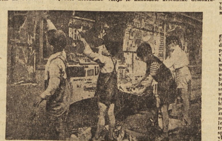
Obljube, obljube... V Italiji je pri vsakih volitvah tako. Stranke veliko obljubljajo, po volitvah pa njihove lepake z obljubami strgajo z zidov in prodajo kot star papir. In vse ostane pri starem

Tudi v italijanskem delavskem gibanju so se v zadnjem letu dogodile pomembne spremembe, zlasti v pogledih komunistov in socialistov na mnoga notranja in zunanja vprašanja. Nenni se je na primer že na lanskoletnem toarnskem kongresu socialistov zavzel za podporo levo, torej za vladno koalicijo socialistov in demokrščanov, toda le tedaj, če bi se ta vlada zavzela za iskreno in napredno ekonomsko-socialno politiko in interesu revnih slojev. Ni več zadrževal, naj Italija izstopi iz Atlantiskega pakta, poudaril pa je, da se s komunisti, s katerimi je 22 let tesno sodeloval, ne namerava spreti. Tudi Komunistična partija Italije je tedaj začela razbijati svojo opozicijsko linijo in iskati stike z levimi skupinami v meščanskih strankah z namenom, da bi ustanovila široko napredno gibanje. Saragatovi socialisti demokrati pa so se v strahu, da bi izgubili svoje pozicije v vladi, še tesneje naslonili na krščansko demokracijo. Zaradi tega je levo socialnedemokratsko krilo zagrcnilo, da bo izstopilo iz stranke in se pridružilo Nenniju. Dvajseti kongres sovjetskih komunistov je podprl te spremembe v politiki italijanskih socialistov in komunistov ter jim omogočil, da so začeli hitreje odmetavati stalinistični balast. Komunistična partija Italije je kar precej resno in