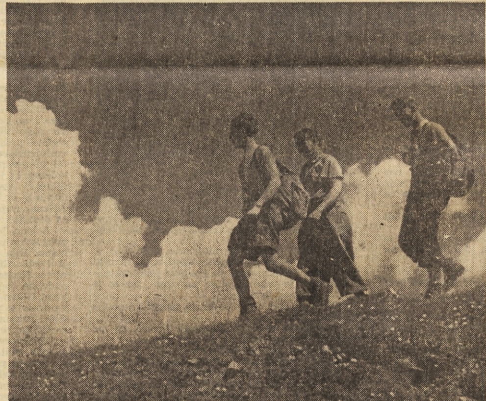
V poletni vročini na strme vrhe...

Seveda se bomo tudi na Mrzlici seznanili s partizanskimi borbami na tem področju, saj se bodo izleta udeležili tudi tovariši borci, ki dobro poznajo to borbeno področje iz velikih časov osvobodilne vojne.