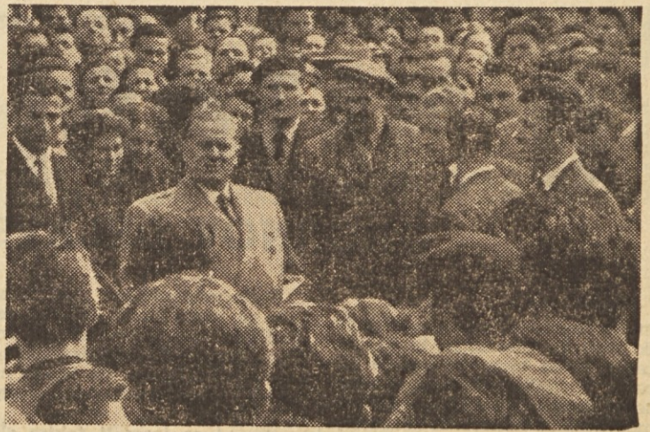
Delavec med delavci

Tako je že prvi dan doživel nemški načrt uničenja jedra narodnoosvobodilne vojske svoj popolen neuspeh.