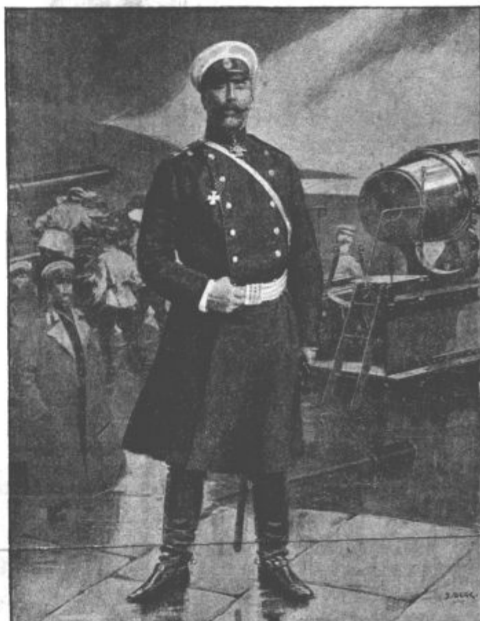
General Šteselj, junak iz Port Arturja.

Peščica jih je v primeri s stotisočglavim sovragom, a njih pogum ne klone, njihova desnica nikdar ne omaga. Tovariš za tovarišem pada ob njihovi strani, niti ne trenejo z očmi, mirno jih zro padati, dasi jim razjeda srce bolest in objema duh tuga in žalost. A vsak tovariš, ki umrje junaške smrti podvoji njihovo odporno moč in ako ostane še samo eden na okopih, bori se kakor lev, njegova sila rase, kakor da bi v njem živeli še vsi njegovi padli tovariši.