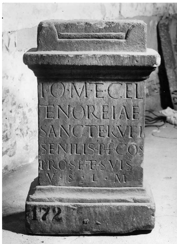
Slika 1. Oltar, posvečen Jupitru, Celeji in Noreji ( CIL III 5188 = ILS 4860).