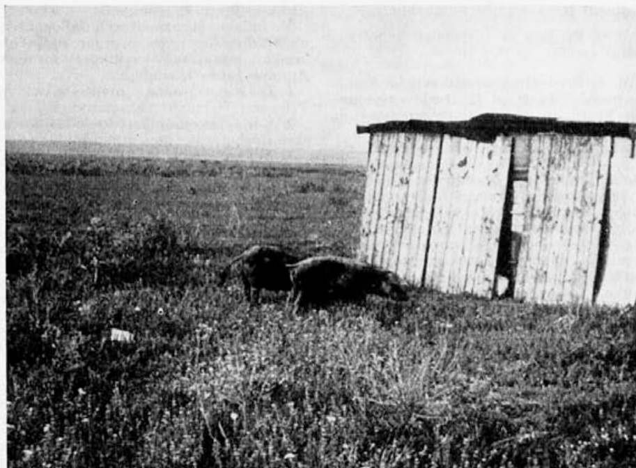
V sušnih poletjih imajo čebele dobro pašo na polajevi meti (metvici). Na sliki je skladanica panjev slovenskih čebelarjev na Lonjskem polju sredi obširnega pasišča.

z naslovom »MED — naša vsakdanja hrana in zdravilo« bi moral imeti vsak čebelar. V njej je namreč napisano prav vse, kar moramo vedeti o medu. Dodana pa ji je še zbirka receptov za gospodinje. V njih so natančna navodila, kako naj uporabljamo med v kuhinji, pri peki in za pijačo. Čebelarji, ki prodajajo med svojim odjemalcem, naj podare kako knjižico tudi njim. Tako bodo delali najboljše propagando za večjo porabo medu. Knjižica stane le 3 N dinarje in jo je moč dobiti pri Medexu, društva pa jo lahko naroče tudi skupno.