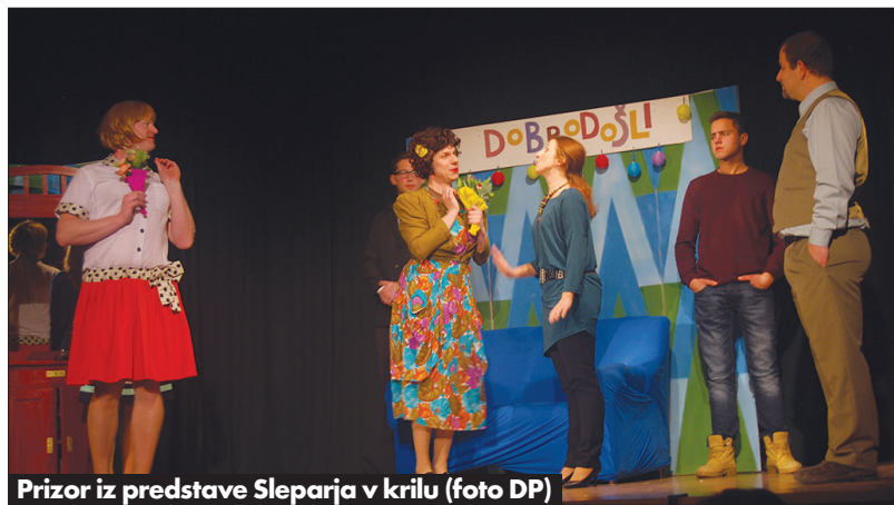
Prizor iz predstave Sleparja v krilu