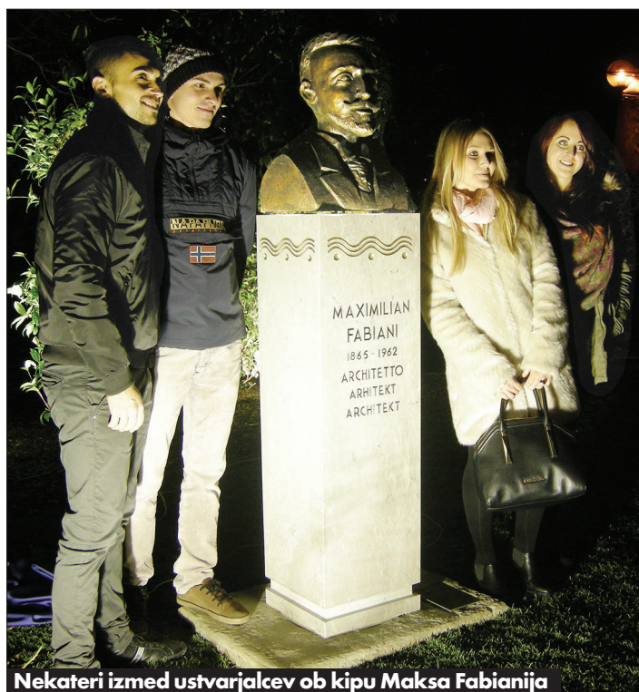
Nekateri izmed ustvarjalcev ob kipu Maks Fabianija

prejel je sicer še veliko drugih odlikovanj in nazivov, tudi Grand prix in zlato odličje na svetovni razstavi v Parizu in zlato odličje za najboljšo stanovanjsko in trgovsko hišo na Dunaju v l. 1911/1912. Na njej je dobil tudi naziv rednega profesorja. Pot ga je vodila spet v domače kraje, da bi s svojimi urbanističnimi sposobnostmi dal nov videz porušeni domačini krajem. V letih, ko je fašizem začel gospodovati v naših krajih, se je očitno še sam uklonil črnemu škornju - v letih 1935-1945 je bil celo župan - podesta' Štanjela. Marsikdo mu je očital to njegovo izbiro; sicer se je tudi po vojni odločil za bivanje v Italiji, saj se je l. 1947 preselil v Gorico, kjer je leta 1962 umrl in bil pokopan. Od l. 1984 počiva v domači družinski grobnici v Kob-