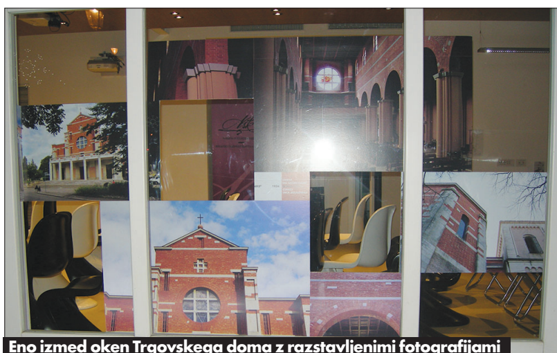
Eno izmed oken Trgovskega doma z razstavljenimi fotografijami