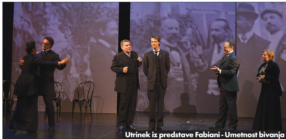
Utrinek iz predstave Fabiani - Umetnost bivanja