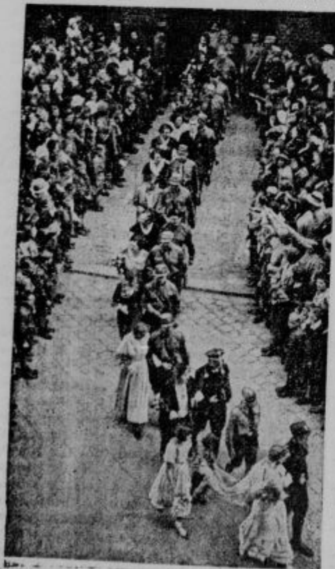
Petdeset parov novoporočencev zapuša po poroki meko berlinsko cerkev.