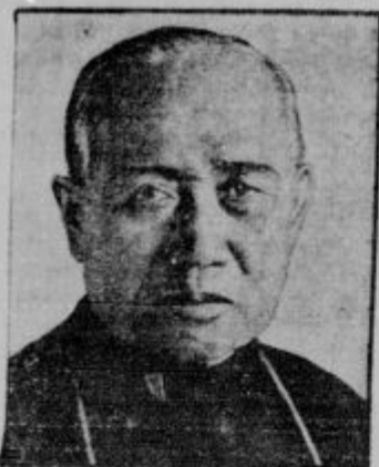
Msgr. Tong, prvi škof anamskega cesarstva (Anam je pod francoskim protektoratom), ki je te dni v Rínu prejel škofovsko posvečenje.