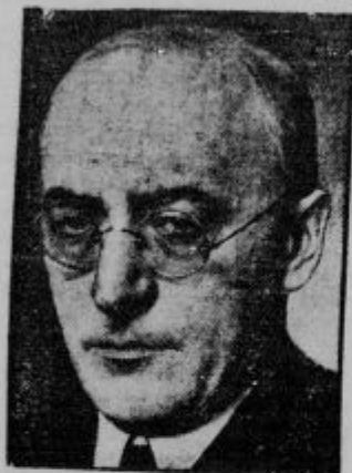
Dr. Brüning, voditelj nemškega katoliškega centra, ki se je moral ukloniti samovolji Hitlerjevi.