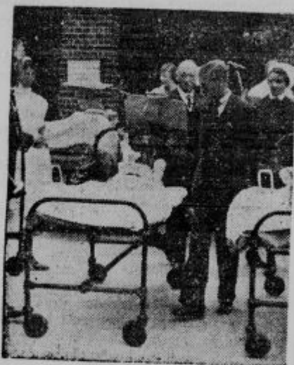
Waleski princ na obisku v otroški bolnišnici v Oxfordu