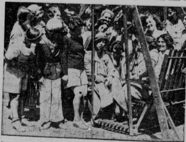
Mrs. Roosevelt na počitnicah. Prva žena Združenih držav, gospa Roosevelt, je na svojem počitniškem potovanju obiskala tabor brezposelnih deklet. Občevala je z njimi kakor tovarišica in si privoščila v njihovi družbi tudi gugalnico. Mrs. Roosevelt iz celega srca uživa počitnice, ko more biti neprisljuna v občevanju, kakor je bila vajena, predno so Američani poklicali njenega moža na predsedstvo. moe