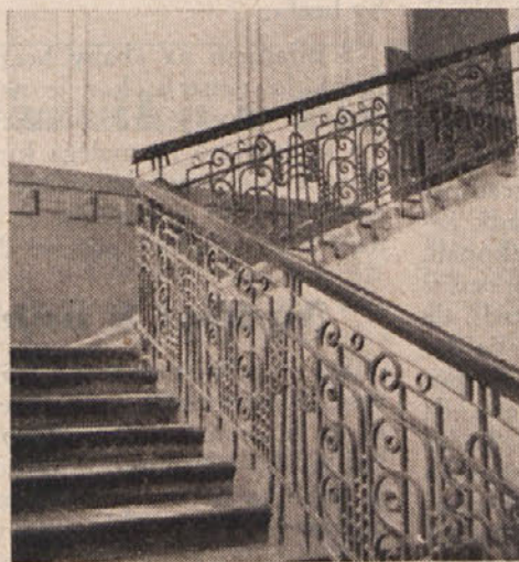
OGRAJA NA STOPNIŠČU SODIŠČA V SISKU, KI JO JE IZDELAL TOVARIS TITO

»In jaz sem hotel, ko sem bil majhen,« pripoveduje Josip Broz, »postati krojač, ker je želja vsakega kmetiča v Zagorju, da ima lepo obleko. Kot otrok sem sanjaril, da sem krojač in da šivam obleke očetu in bratom in vsem v hiši...«