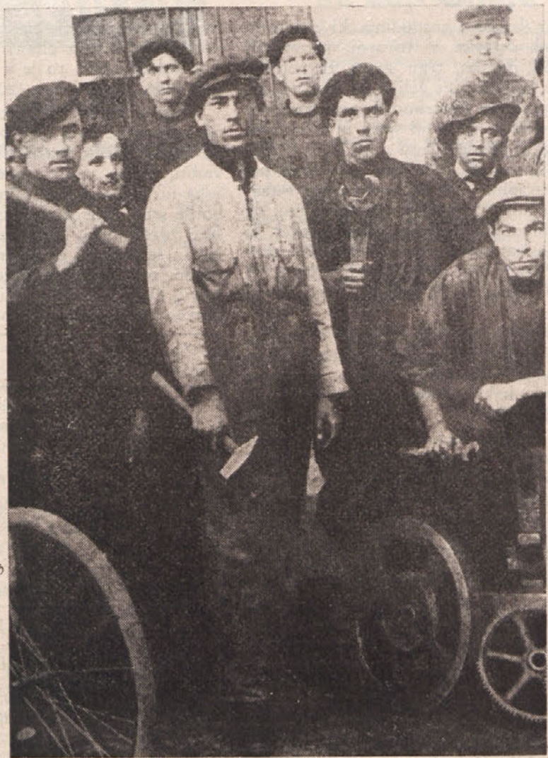
DOSLEJ NAJSTAREJŠI ZNANI POSNETEK TOVARISA TITA, V KAMNIKU LETA 1911. TITO STOJI NA LEVI ZA MLADIM DELAVCEM V SVETLI DELOVNI OBLEKI S KLADIVOM V ROKI

Čudna je ljubezen Zagorca, da je lepo oblečen. O tem, kaj pomeni biti dobro oblečen, pripoveduje Josip Broz: