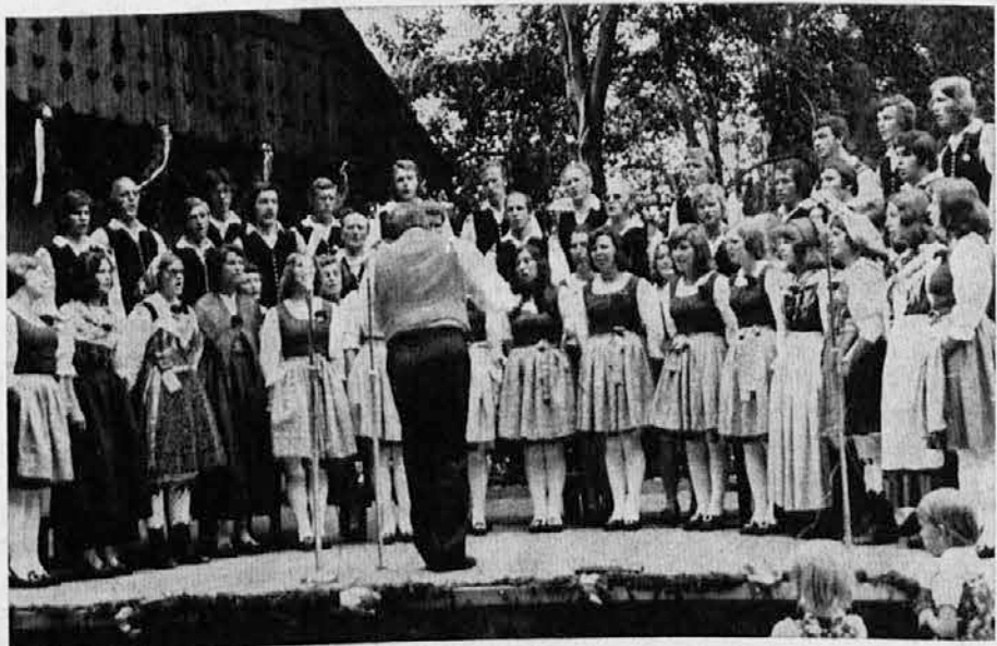
Slovenski koroški pevski zbor »Gallus« je uspešno nastopal po Sev. Ameriki in Kanadi. To nedeljo ga bomo mogli slišati tudi v Katoliškem domu v Gorici