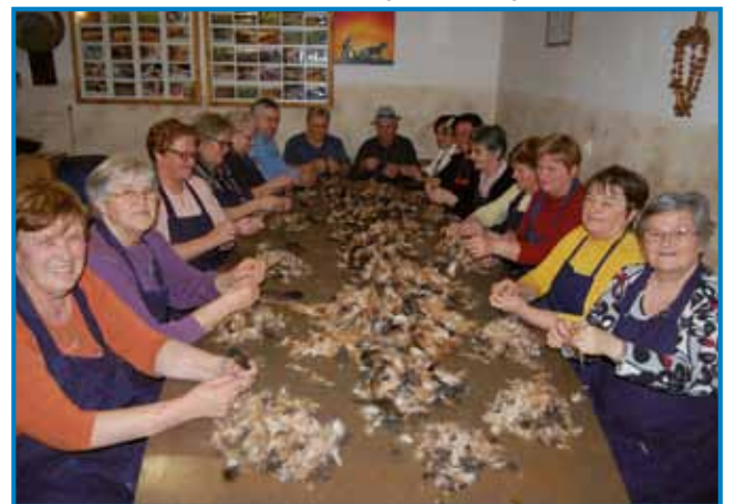
Etnološki prikaz česanja perja pri Hrenovih, v sodelovanju z Ljudskimi pevkami iz Žižkov

Besedila je napisala v prekmurskem narečju, v knjigi pa so tudi predstavite v slovenski knjižni jezik.