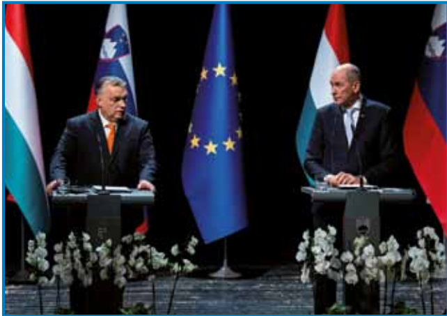
Premierja Viktor Orbán in Janez Janša na tiskovni konferenci v lendavski Gledališki in koncertni dvorani