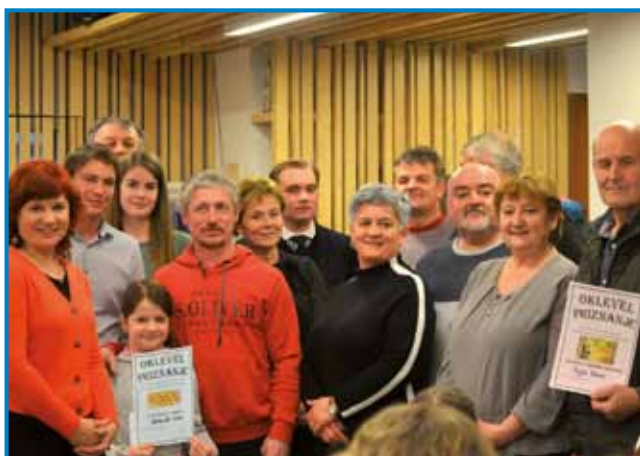
Nagrajenci, ocenjevalci in organizatorji

V soboto, 19. februarja 2022, je potekal festival domačega vina in pogač na Slovenski pogač potekalo podobno kot v prejšnjih letih. Vina je žirija ocenjevala po