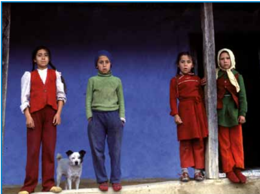
Romski mlajši na Erdeljskom - kak dugo do eške v vogrske šaule ojdli? (foto: Fortepan/Urbán Tamás - 1989)

Vnaugi erdeljski Ciganji delajo gnesneden že indrik po Evropi in majo dostakrat več penez kak Madžari, šteri so ostali v svojoj domanjoj vési. Küpüjejo prazne