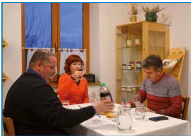
Komisija med ocenjevanjem vin

raznih lastnostih, kot so: čistoča, barva, okus in vonj, pri pogačah pa so upošteva-