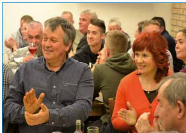
Festival domačega vina in pogač stran 6