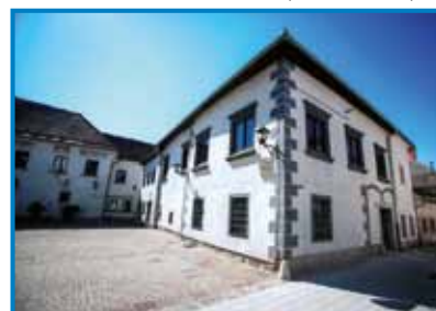
Lekarniški in alkimistični muzej

zelo estetskega videza. O tem priča zlasti dobro ohranjeno lekarniško pohištvo v radovljiškem muzeju. Ta obsega farmacevtsko opremo iz 18. in 19. stoletja, zbirko rastlinja, alkimistični laboratorij, veliko zbirko možnarjev od 12. do 19. stoletja, tehtnice in uteži, 30 starih farmacevtskih knjig iz 15. do 19. stoletja, zbirko zgodovine kozmetike in par-