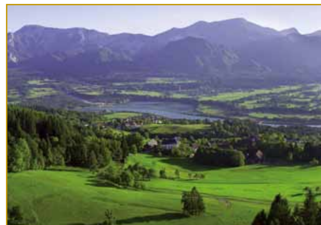
Največ lidi na Koroškom po dolinaj žive

lidi, steri so sami sebi prajli, ka »gori«, više doline živejo. Če malo poglednemo (Gor) otan-Korotan, se že malo od toga leko čüje. Tak ena teorija nam pripovejda. Druga vcejlak ovak guči. Ménje za Korotan-Karantanijo-Koroško aj bi iz staroga plemena Slavov - Horutanci - vöprišlo. Ranč Horutanci aj bi tisti stari Slavi bili, steri so se v tau krajino naselili. Kakoli vse teorije obračamo, za Koroško vala, ka že od inda je stara slavsko-slovenska krajina bila. Gda