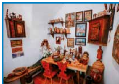
Etnološki del lekarne