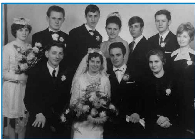
Njini zdavanjski kejpe iz leta 1972

»Nej smo tak na velke meli, samo družina je bila paulak. Ge sem na tau priliko prosila za zahvalo edno mešo, depa