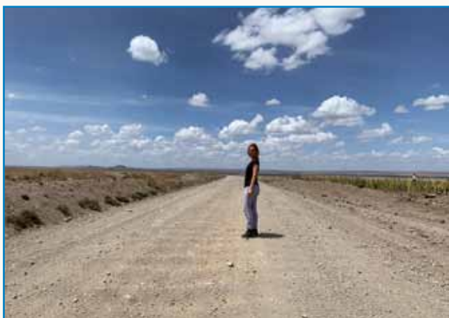
Iz dugoga cajta se narodijo ideje stran 4

V NASLEDNJIH PETIH LETIH 25 MILIJONOV EVROV ZA PORABJE