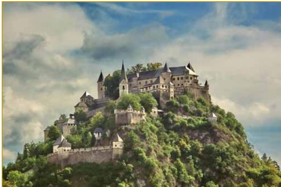
Krnski grad je prva metropola stare slavske Karantanije biu. Gnes tak vögleda. Tisti, od steroga mi pripovejdamo, z lesa biu napravljen. Krnski grad je eške v časi poganski Slavov v Karantaniji najbole naprej valaun biu

smo prajli, uni ne govoriyo, uni gučijo. K štajerskim Slovincem v Avstriji se brž pride. Samo dobri 8 km od Murske