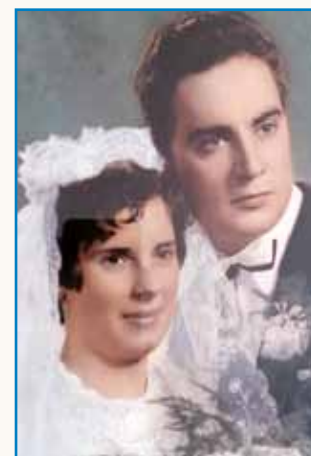
Eške gnauk so naja vküper dali stran 8