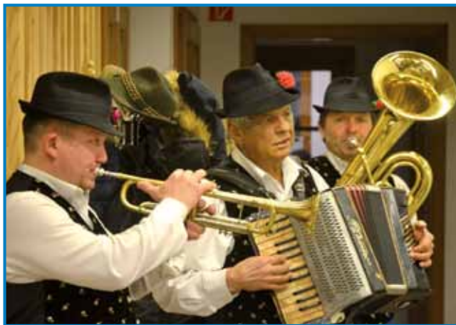
Za dobro voljo je poskrbel ansambel Što ma čas

li okus, teksturo in izgled. Vino so ocenjevali generalna konzulka Republike