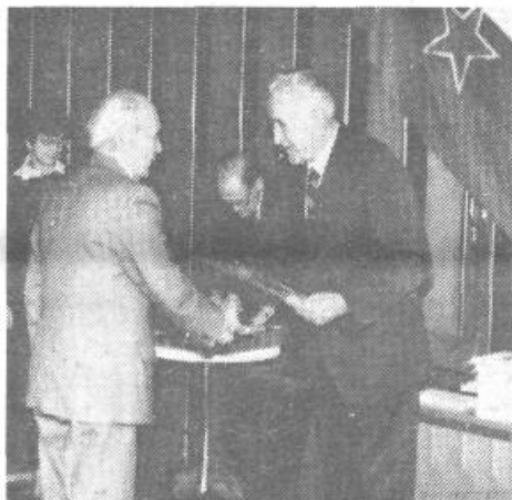
Upokojencem so prvič podelili tudi priznanja

V drugem, sklepnem delu seje pa so potem podelili priznanja najzaslužnejšim društvom in članom ter posebno zimsko pomoč (v višini 8000 din) 17 upokojencem, ki so jih predlagala društva. Za ta priznanja je bil že skrajni čas, saj nekatera društva marljivo delujejo že po trideset in več let, ne da bi kdajkoli kaj prejela. Prav zato so sklenili, da jih poslej podeljujejo vsako leto.