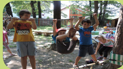
Uživanje na Doživljajskem igrišču