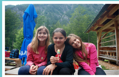
V Logarski dolini