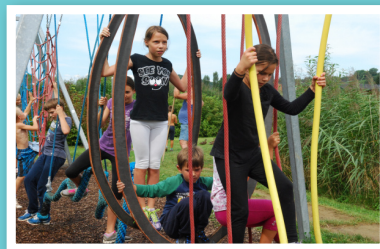
Gibalni park v Avstriji

Srede so bile rezervirane za celodnevne sredine izlete. Žal nam je letos vreme precej nagajalo, zato se vseh nismo udeležili, tam, kjer smo bili pa je bilo super! Pogumni smo bili na raftingu na Krki, zasanjani v pravljicnem gozdu v Logarski dolini, v družbi z živalcami na ranču Aladin, poduhovljeni v indijanski Pachamami, gibčni v gibalnem parku v sosednji Avstriji in malo prestrašeni v jami Pekel.