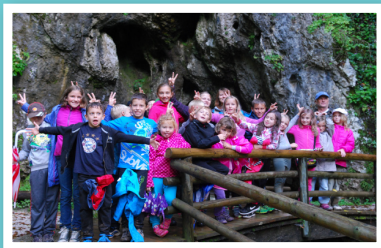
Pred jamo Pekel