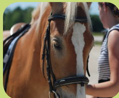
Na konju Hipodroma Kamnica