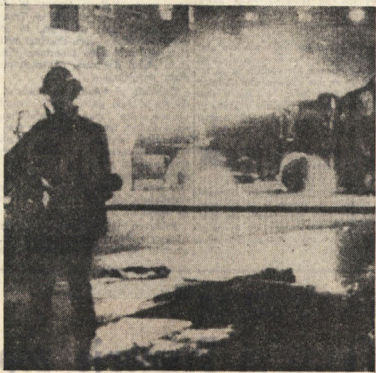
Politično ozračje v Ulsterju je še vedno napeto po zadnjih krvavih spopadih in atentatih. Na sliki: avtomobil gorljivo v katoliškem predmestju Belfasta

TRIPOLI — Sinoči je dospel v Tripoli alžirski minister za industrijo in energijo, ki se je dolgo pogovarjal s funkcionarji libijskega ministrstva za petroleje.