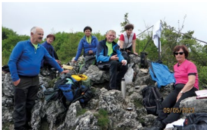
Pohodniki z Vodice zadovoljni na vrhu Kopitnika

Ker je bilo po nekaj toplih dneh napovedano poslabšanje vremena smo sklenili, da izkoristimo priložnost za obisk nekaj vrhov v hribovju Stojne. Ta se razprostira med Kočevjem in Kočevsko Reko. Obiskano območje je vključeno v kočevsko planinsko pot. Z avtobusom smo se zapeljali do Jasnice, približno na pol poti med Ribnico in Kočevjem. Poiskali smo table in markacije, ki so nam pokazale pot v smeri Slovenskega vrha. Del poti je bil že precej zarasel in smo imeli kar nekaj težav z iskanjem prave steze. Čez čas, ko je pot zavila v bolj strm gozd, je bila orientacija lažja. Po dobrih dveh urah smo dosegli prvi cilj, Slovenski vrh. Privoščili smo si krajši počitek in okrepčilo in nadaljevali pot proti naslednjemu vrhu na naši poti, Ledeniku. Pot je vodila nekaj časa po gozdnih cestah in nekaj časa po zaraščenih poteh in neurejenih posekah. Najbolj so motile nepospravljene veje, ki so se nam zapletale pod nogami. Po dobrih dveh urah smo stali tudi na Ledeniku, najvišjemu vrhu Stojne (1072 m). Spet smo si vzeli nekaj časa za počitek in okrepčilo in kmalu krenili k naslednjemu cilju Mestnemu vrhu nad Kočo pri jelenovem studencu. Ta odsek je bil krajši vendar zaradi neurejenih posek dokaj zahteven. Kmalu smo se spustili do lepe gozdne makadamske ceste in sledili oznakam do Koče pri jelenovem studencu. Ker je bil cel dan kar vroč, čeprav smo večji del poti hodili v osenčenih gozdnih poteh, smo pričakovali pri Koči dopolnitev