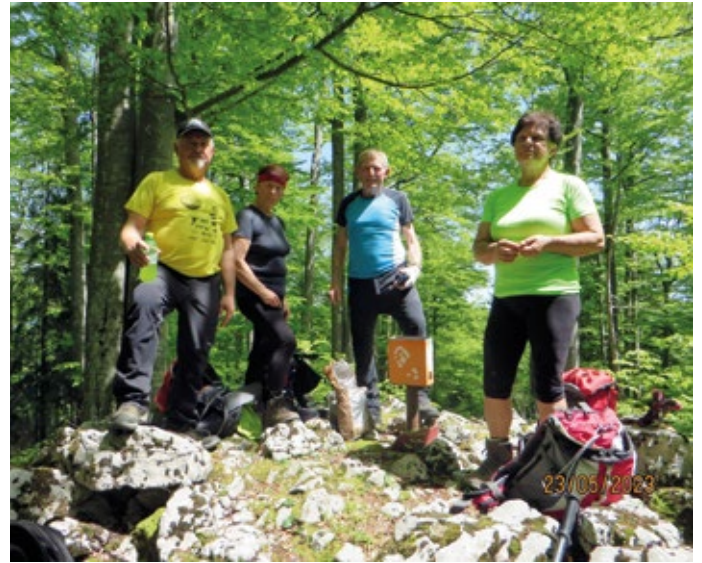
Pohodniki na vrhu Lednika najvišjega vrha pogorja Stojne nad Kočevjem

Do naslednjega javljanja lep pozdrav vsem bralcem.