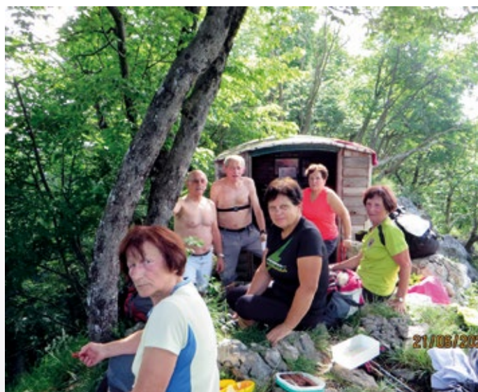
Počitek pri bivaku na vrhu Kamnika