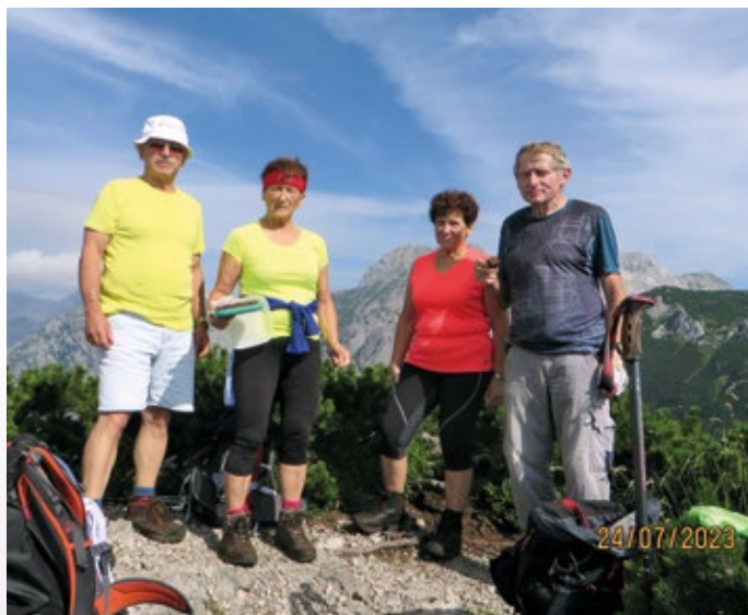
Pohodniki dobesedno na Konju

Kolesarji še naprej kolesarimo v skladu z letnim planom, ki je objavljen v Biltenu društva. V začetku junija se udeležimo tradicionalnega srečanja kolesarjev sosednjih društev. Letos organizirajo srečanje kolesarji iz Kamnika. Srečanje, ki je bilo že dogovorjeno, je bilo zaradi napovedi slabega vremena prestavljeno na kasnejši termin, ko bodo ugodnejši vremenski pogoji. Več o srečanju v prihodnjem prispevku.