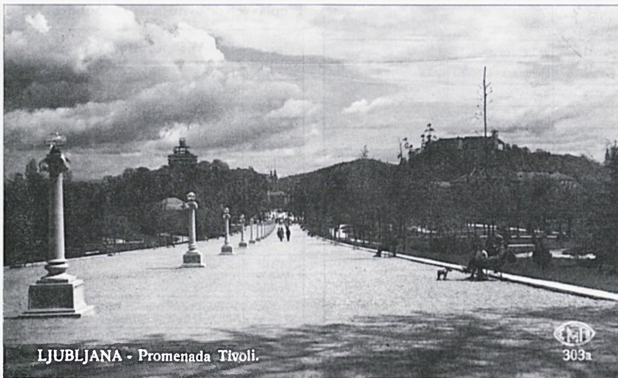
LJUBLJANA - Promenada Tivoli.