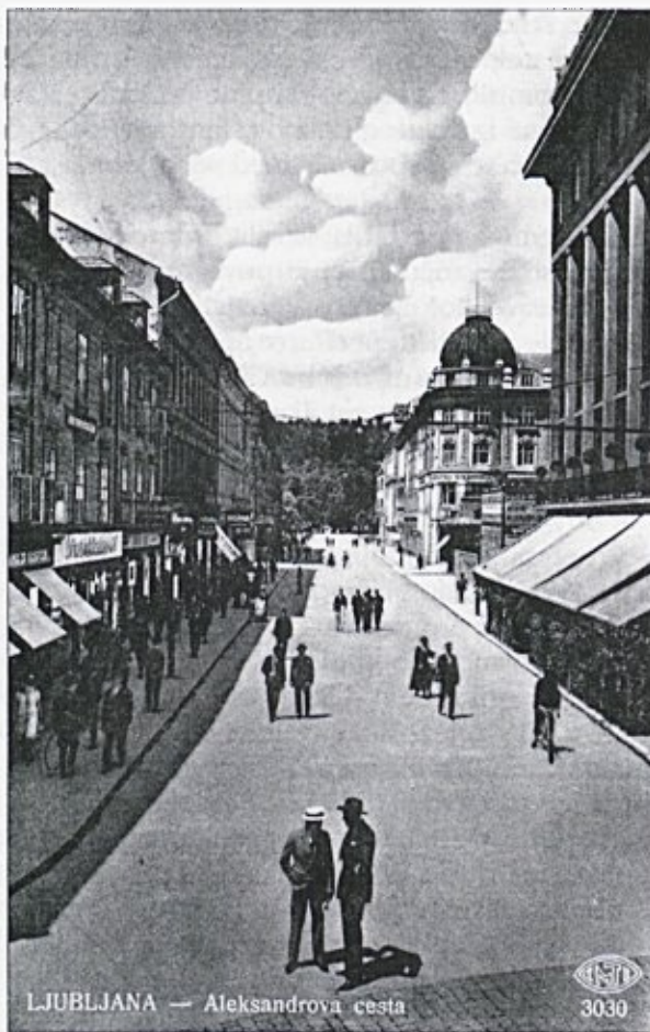
Pogovori na Aleksandrovi cesti.

Slovenski narod je zapisal še en pogovor, in sicer pogovor mladih, ponosnih inteligentov, ki so malomarno pozdravljali dame »in globokomiselnost modrovali, da v igri ljubezni vedno dobi tisti, ki igro izgubi; da je ženske solze veliko laglje otreti z bankovci kakor z robci in da možki, ki se oženi, je podoben človeku, ki se iz strahu pred smrtjo ustrelji.« 74 Ironični pisec podlistka nato pikro pripomni, da se je vse to dogajalo, ko se je smejalo zlato sonce in da se je sto in sto ljudi veselilo, da so živi. Nato nadaljuje s še enim opažanjem: »Tem pozerjem je bila malone podobna družbica gospodičen, ki se nahajajo v prvem stadiju emancipacije, ki na sprehajališču prereštevajo žensko vprašanje, kritikujejo Ellen Key 75 in se vedejo kar mogoče samozavestno in polmoško. Oj, ko bi vedele, da se iz njih