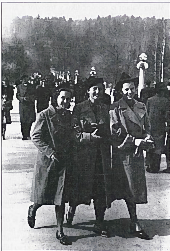
Bežigravčanke na promeniadi leta 1938.

Redki so bili tudi primeri, ko so se ljudje iz okoliških krajev z vlakom pripeljali na glavni kolodvor, pot nadaljevali s tramvajem, se zbrali v eni izmed gostiln, kaj popili in se nato odpravili na promenado.