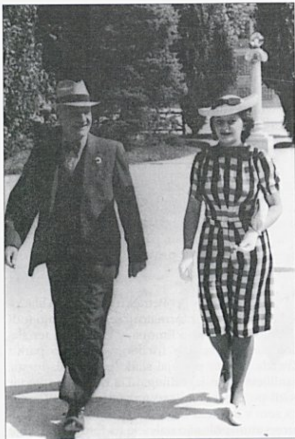
Ženska in moška praznja obleka na promenadi

javnosti niso snemale, z izjemo kavarn, kjer so snele le rokavice, klobuček pa je še vedno ostal na glavi.