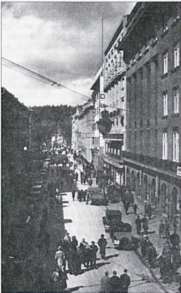
Pogled na promenadno cesto.