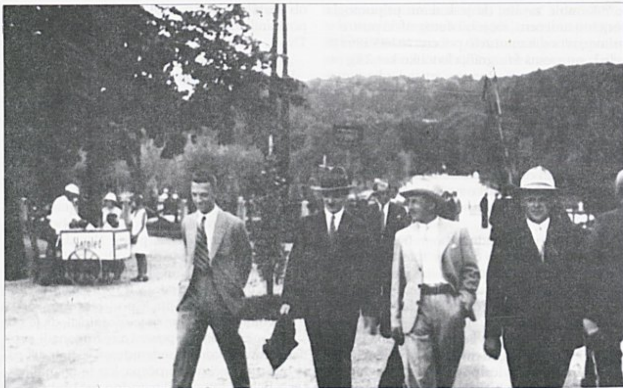
Sladoledar na promenadi

ke in črnega papirja ter primerne škarje. Njegovo mesto je označeval pisan dežnik, pod katerim je sedel in čakal na stranke. Bil je velika atrakcija predvsem za otroke, pa tudi za mlade, ki so rekli: »Poglej, tam pa nekdo slike reže!« Izrezovanje silhuet je bilo predhodnik fotografiranja, kar je v Klopčičevem filmu tudi dobro prikazano. Film je nastal v šestdesetih letih, ko promenade po Tromostovju ni bilo več, pa vendar je snemanje filma še vedno pritegnilo veliko ljudi. V filmu je prikazan celoten postopek izrezovanja, stik s stranko ter tudi struktura ljudi, ki se jim je zdelo to še zanimivo. V filmu je ponazorjeno, kako se starejša gospa odloči, da hoče imeti sliko izrezanega profila. Mojster jo je posedel na stol, gledal s strani in rezal njene najbolj značilne poteze obraza na črn prepognjen papir. Nato je papir zravnal in ga nalepil na bel kos lepenke. To je pritegnilo veliko pozornost predvsem otrok, ki so prav tako hoteli imeti svoj profil.