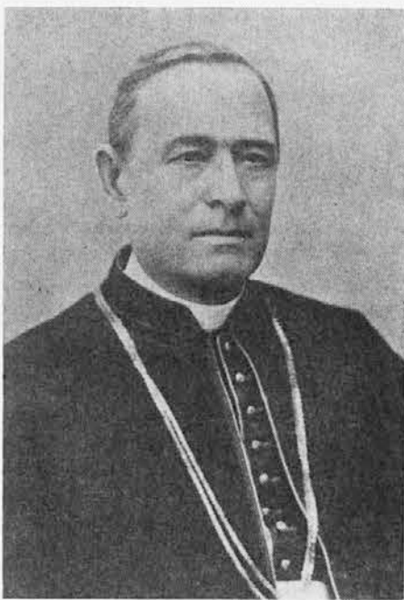
Goriški nadškof kardinal Jakob Missia

Kot škof v Ljubljani in Gorici je vladal v časih ostrih narodnih bojev med Slovenci in Nemci ter v Gorici še med Italijani. Sam se neposredno v te boje ni spuščal, pač pa je zelo podpiral katoliške politike (Šušteršiča, Kreka), v Gorici dr. A. Mahniča, s katerim sta si bila enakih misli. Ker se je s svojim zadržanjem zameril liberalnim politikom, so ga ti tako v Ljubljani kot v Gorici napadali in mu očitali, da je kriv »ločitve duhov« na Slovenskem, vendar je bila taka ločitev le logična posledica demokratičnega razvoja