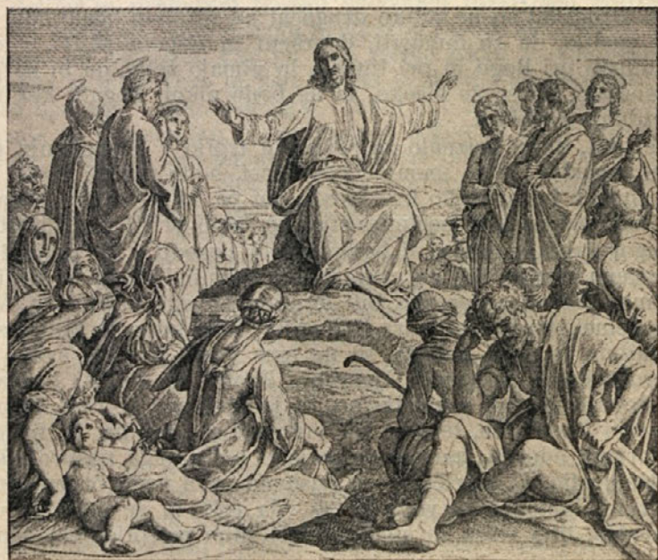
Carolsfeld: Pridiga na gori

»Blagor ubogim v duhu, zaka njih je nebeško kraljestvo.« Luka besed »v duhu« nima in misli na uboge sploh ter za njim mnogi drugi;