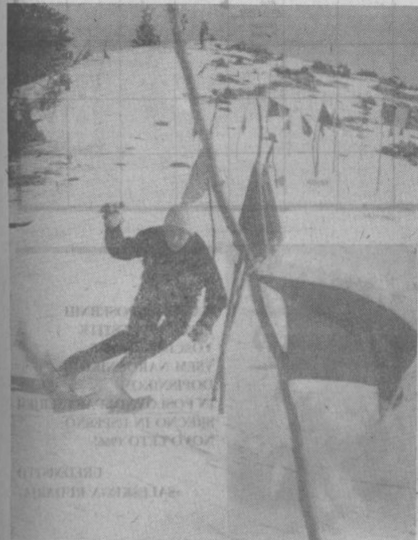
Najboljši so že pravi mojstri v krmarjenju.

Belovoški smučarji že tudi razmišljajo, da bi bilo potrebno ustanoviti za področje Saleške doline samostojno smučarsko društvo in tako enotno in strokovno usmerjati mlade smučarje vse naše občine. Vendar kot povsod je tudi tu osnovno — pomanjkanje potrebnih sredstev za razvoj najbolj talentiranih smučarjev pionirjev, med katerimi