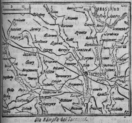
Via Nampfe bei Tarnopol.

Z ozirom na ponesrečeno ofenzivo v bližini Tarnopola, prinašamo danes zemljevid te pokra- je, ki bo naše cenj. čitatelje zanimal.