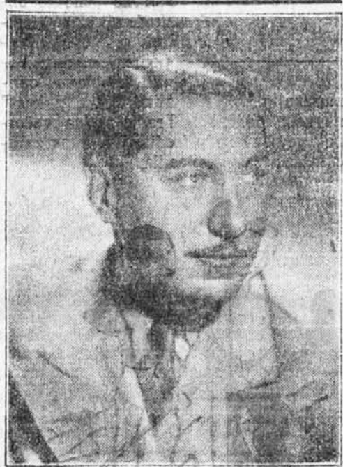
WILLY BIRGEL (Ufa)

Eugen Pierre Gion je narisal majhne živali, da bi se njegovi otroci lažje naučili Lafontaineovih basni. Nekega dne mu je prišlo na misel, da bi takšen nazorni pouk tudi drugim koristil. Zato je narisal kratak film o vsaki basni. Film se bo pričel s predgovorom, nato pa bodo živali pričele svojo igro, ki jo basen predpisuje. Živalski razgovori so v filmu prav takšni kakor v Lafontaineovih basnih. Posrečena glasba bo spremljala predgovor in tudi dejanja basni.