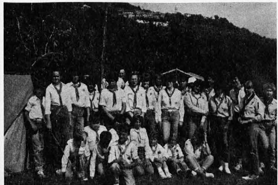
Mačkoljanska skavtska družina na svojem »mini taboru« (v ozadju Prebenge)

Tudi mi izražamo svojo solidarnost katinarskim staršem z željo, da bi se zadeva prostorov čimprej ugodno rešila. Tako ne more naprej.