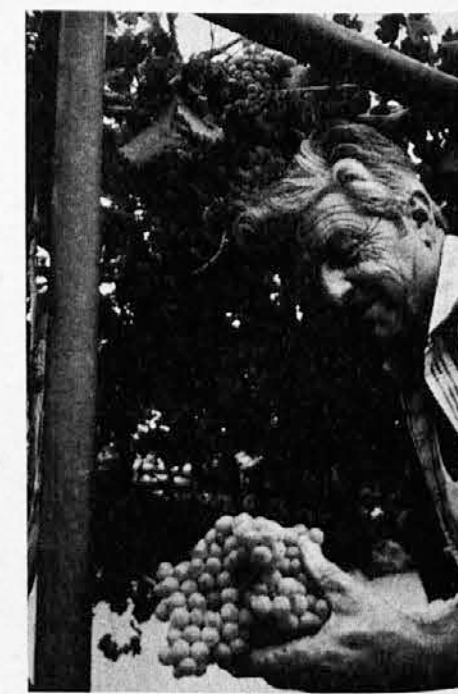
Jesen je prišla in z njo trgatve čas