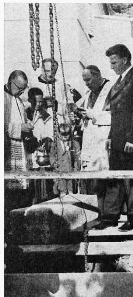
Pok. tržaški škof A. Santin blagoslovlja 14. junija 1964 temeljni kamen bodočega Slomškovega doma v Bazovici

Štiri mesece pozneje, 11. oktobra, je bil dom dograjen in slovesno blagoslovljen. Ključ Slomškovega doma so bili tisti dan izročeni mladini, ker je dom namenjen