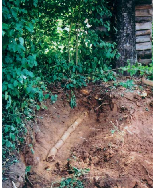
Lončene cevi antičnega vodovoda z Veštra nad Trnjem, izkopane leta 2001. Izkopavanja je vodila ekipa Loškega muzeja, kjer se cevi sedaj hranijo.