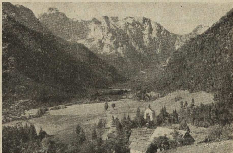
LOGARSKA DOLINA — med Kamniškimi planinami

Letos mineva 50 let, odkar so začeli kopati temelje za cerkev Lurške Matere božje