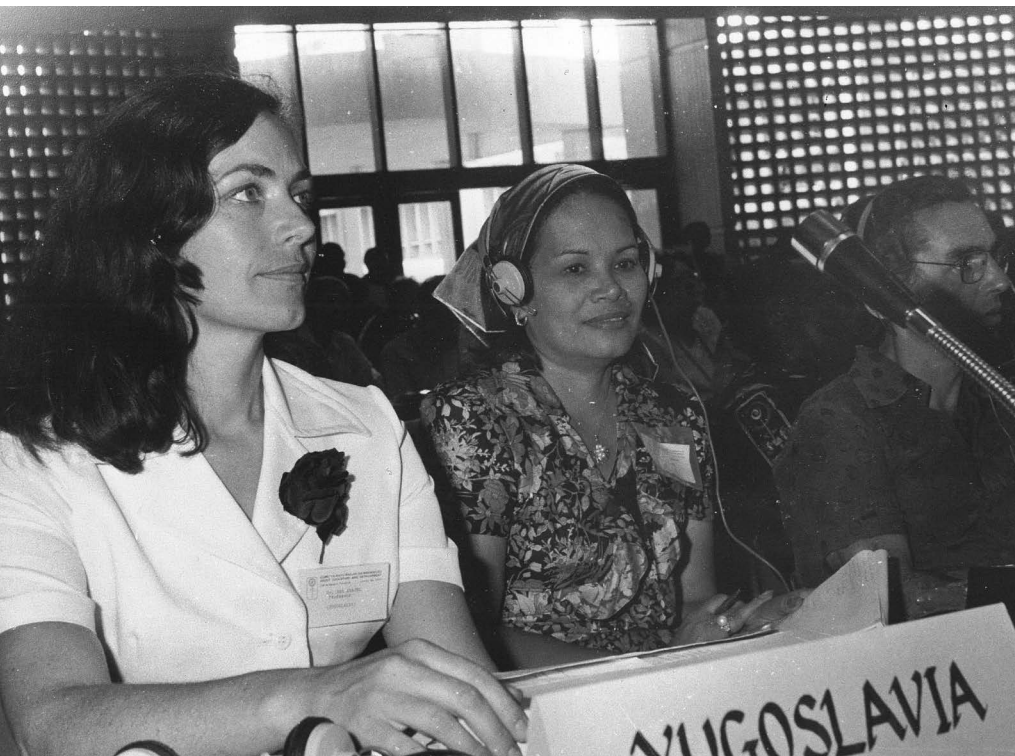
1976, na 1. svetovnem kongresu ICAE (International Council for Adult Education) v Tanzaniji.