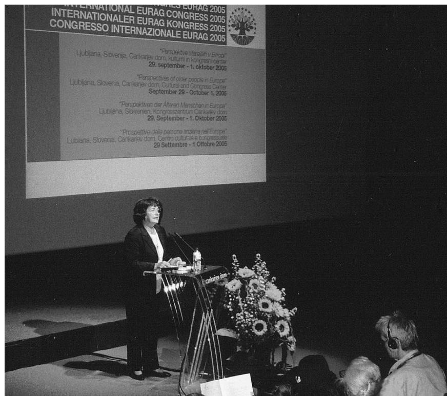
2005, kongres EURAG v Cankarjevem domu v Ljubljani.