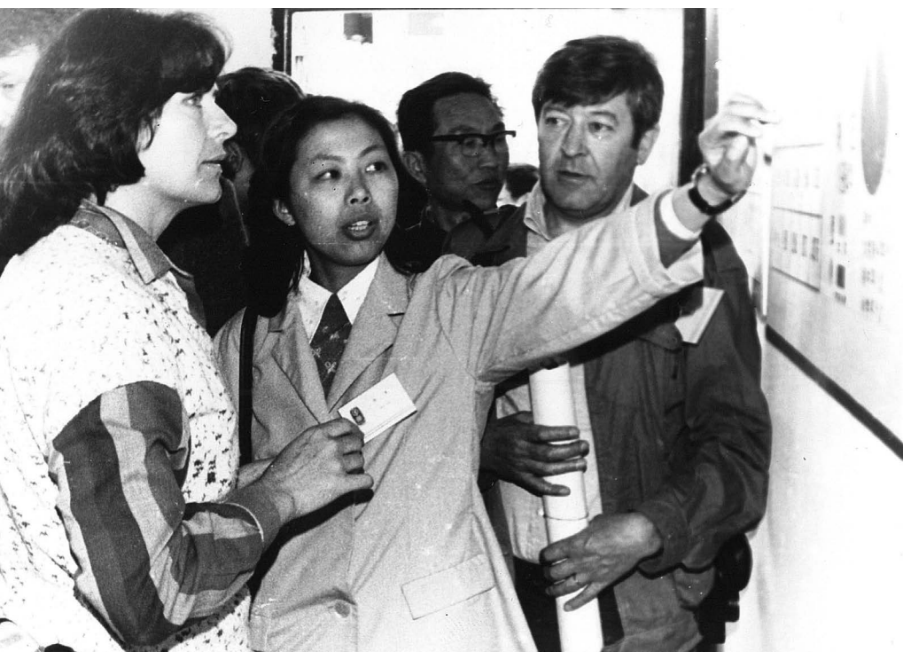
1983, mednarodna delegacija ICAE na Kitajskem.