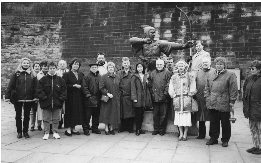
1997, srečanje urednikov andragoških revij na univerzi v Nottinghamu.