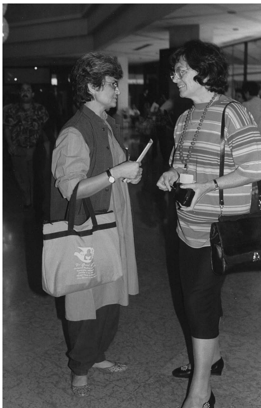
1993, peti svetovni kongres ICAE v Kairu v Egiptu.