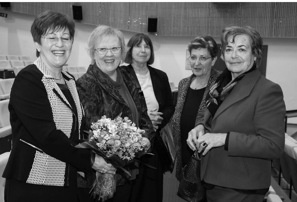
2015, s predsednicami slovske univerz za tretje življenjsko obdobje v Velenju.