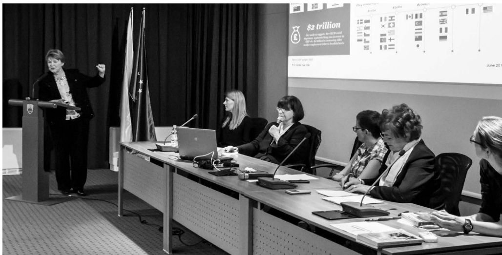
2018, mednarodni posvet SUTŽO Globalno povezovanje za razvoj nove podobe starosti v Ljubljani.