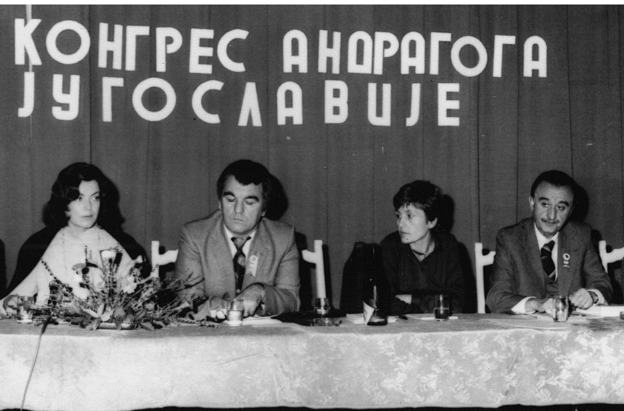
1980, kongres andragogov Jugoslavije, Ohrid, Makedonija.