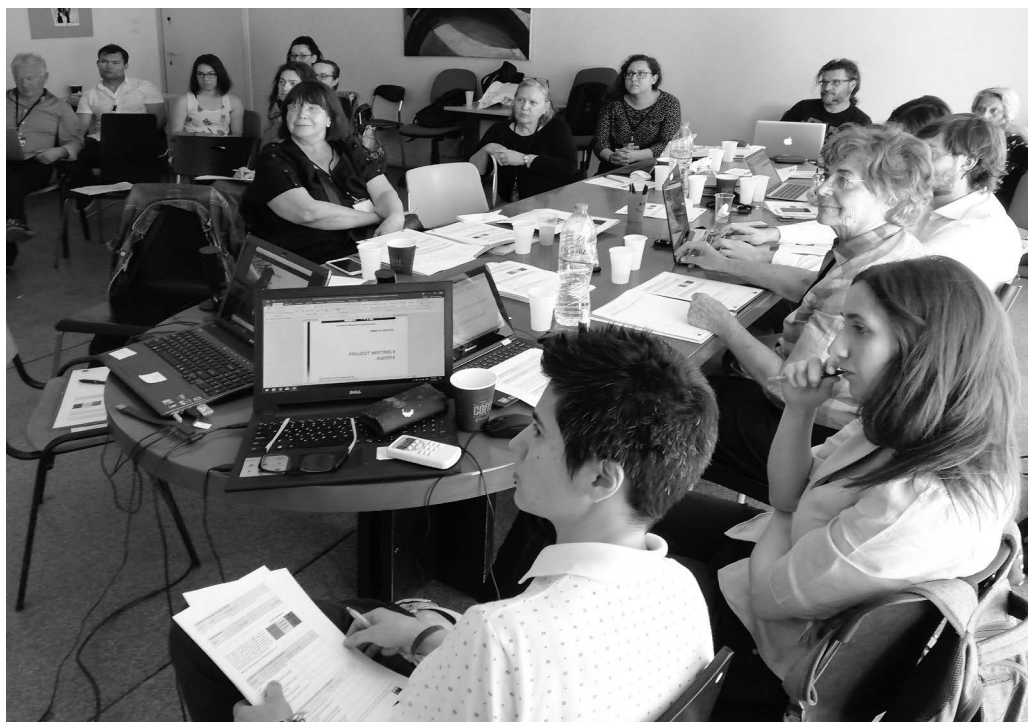
2018, transnacionalno srečanje v projektu RefugeesIN v Atenah.