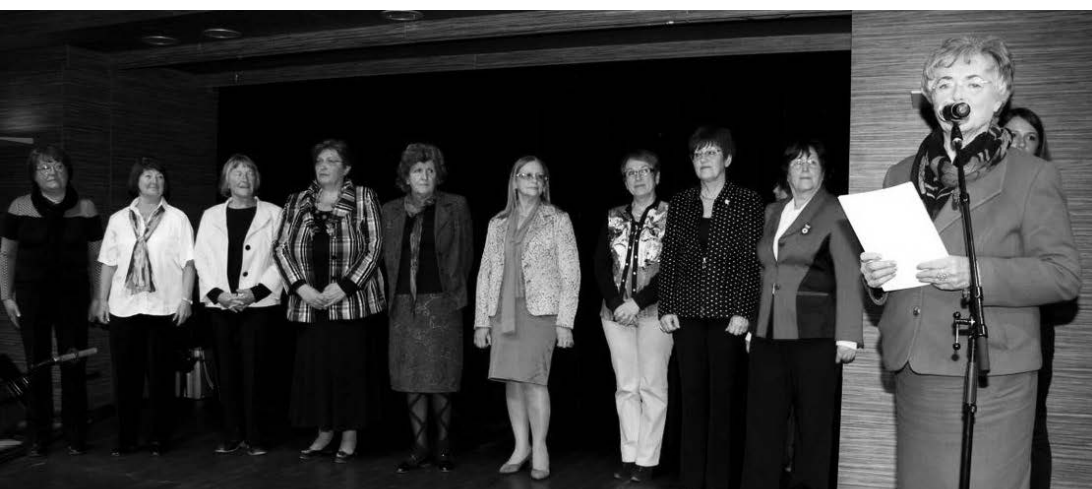
2014, s predsednicami slovenskih univerz za tretje življenjsko obdobje na slavnostnem obeležju 30. obletnice SUTŽO v Cankarjevem domu v Ljubljani.