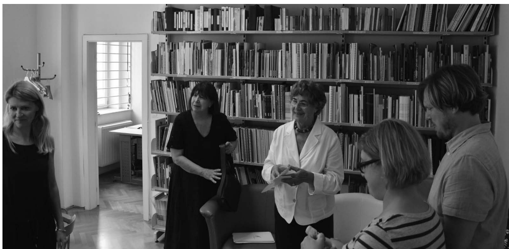
2018, Ljubljana, v knjižnici med sodelavci UTŽO.