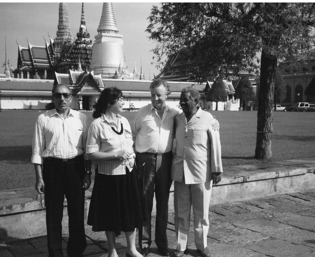
1991, svetovni kongres ICAE v Bangkoku na Tajskem.