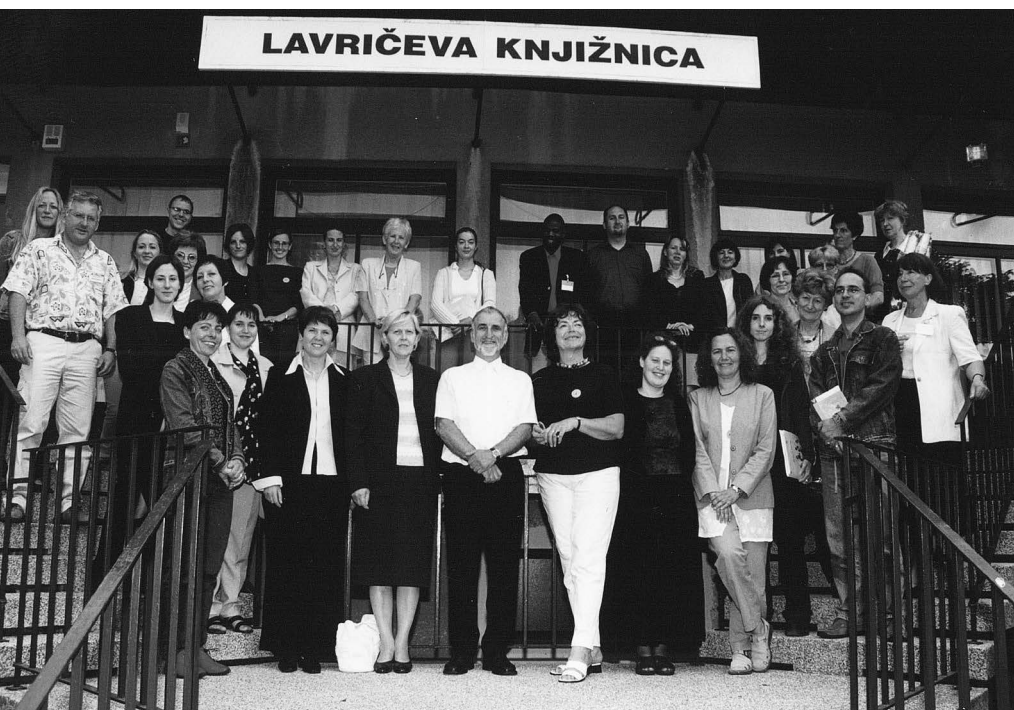
2002, 8. Andragoška poletna šola v Ajdovščini.