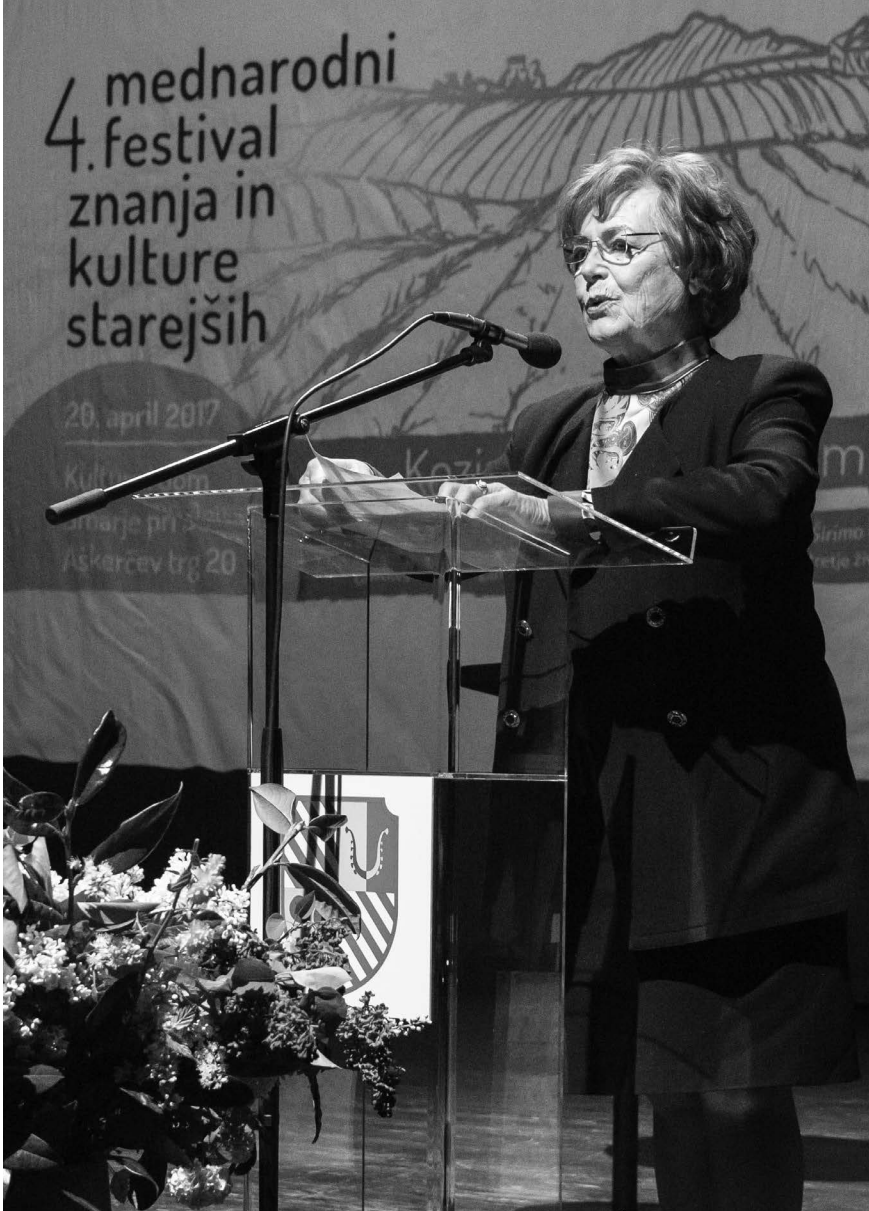
2017, na odprtju 4. mednarodnega festivala znanja in kulture starejših, Šmarje pri Jelšah.