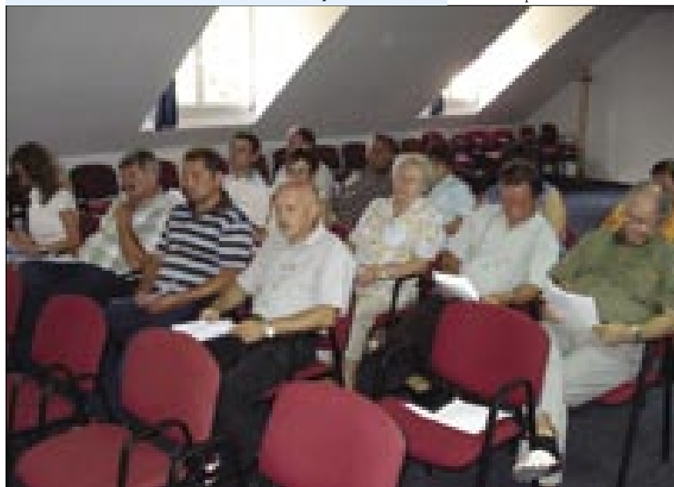
Del članov predsedstva ZSM in občnega zbora DSS