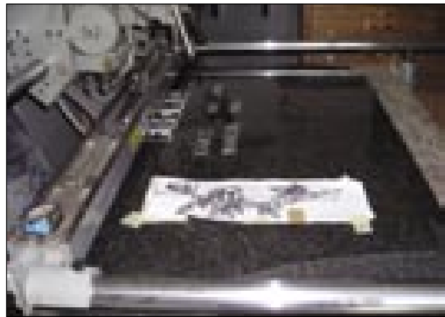
Ena od delovnih faz

bojnov je prišlo do nacionalizacije in kamnoseštvo je državno (állami) gratalo. Jože pa se je začno šolati leta 1948, najprlej v Soboti kak inaš, pri 17 lejtaj pa je šou v obrtno šoulo in jo v dvej lejtaj končo tü. Dopodneva je delo, zadvečera pa v šoulo odo. Gda je končo obrtno šoulo, je odišo v Ljubljano in pravi, ka je tam trno dosta vido, pa