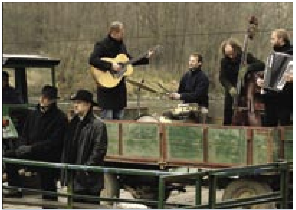
Na valovih Mure

čilne poezije in kratke, zgoščene proze dveh slovenskih avtorjev, ki sta mi tudi osebno blizu oziroma s katerima se družim kot njun literarni kolega. Zdaj je že minilo toliko časa, da so vtisi vsaj nekoliko strnjeni, poklepetal sem z avtorjema, po premieri pa z nekaterimi gledalci, tako da je »moja« podoba vizualiziranih tekstov nekoliko trdnjša, a še zmeraj ne dovolj prečiščena. Še manj dokončna.