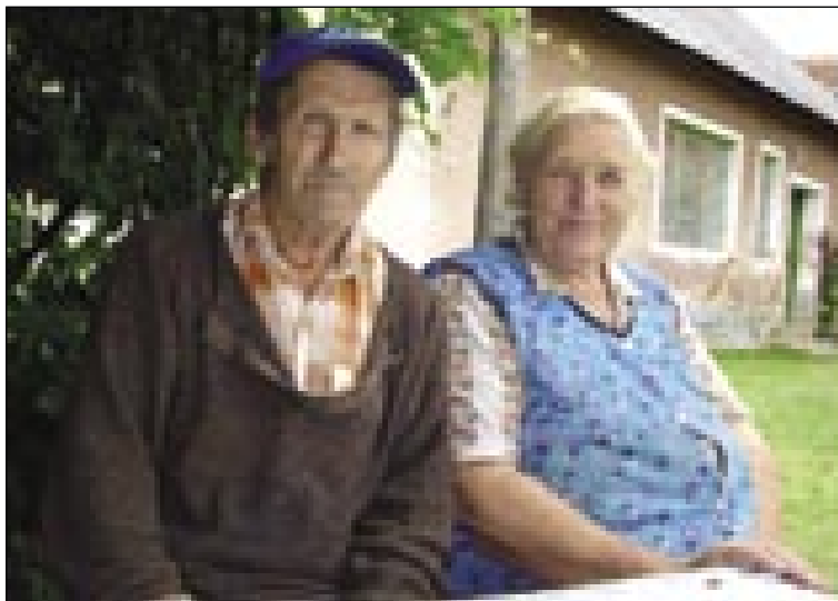
Magašni Pištak z ženauv pod lugašom

»Pa kak, pejški, tü ta, prejk po gauški. Duga paut je bila. Gda smo taprišli, je že skur podnek bilau. Obed sva oprajla pa sva pomalek že pa domau šla.«