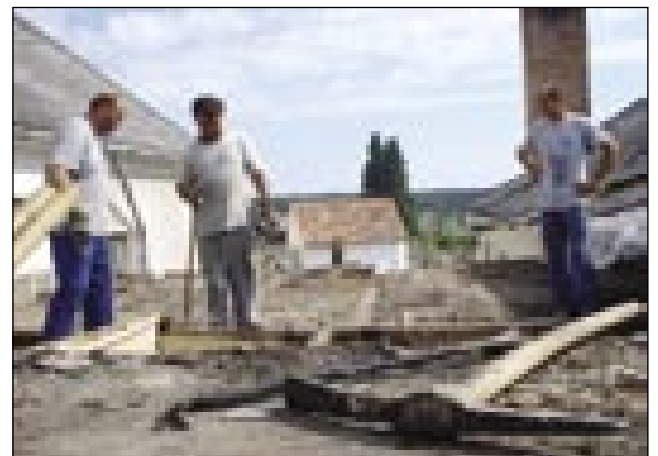
Delavci na streji

»Delo se je zdaj, 1. avgustuša začnilo pa 31. decembra vse mora gotovo biti. Mi smo šaulo vōspakivali pa smo go 30. juliuša prejkdali firmi Fix Varró. Sploj se veselimo tauma, ka se je delo začnilo, vüpamo, ka do konca decembra zgotauvijo, pa januara do se mlajši že v ob-