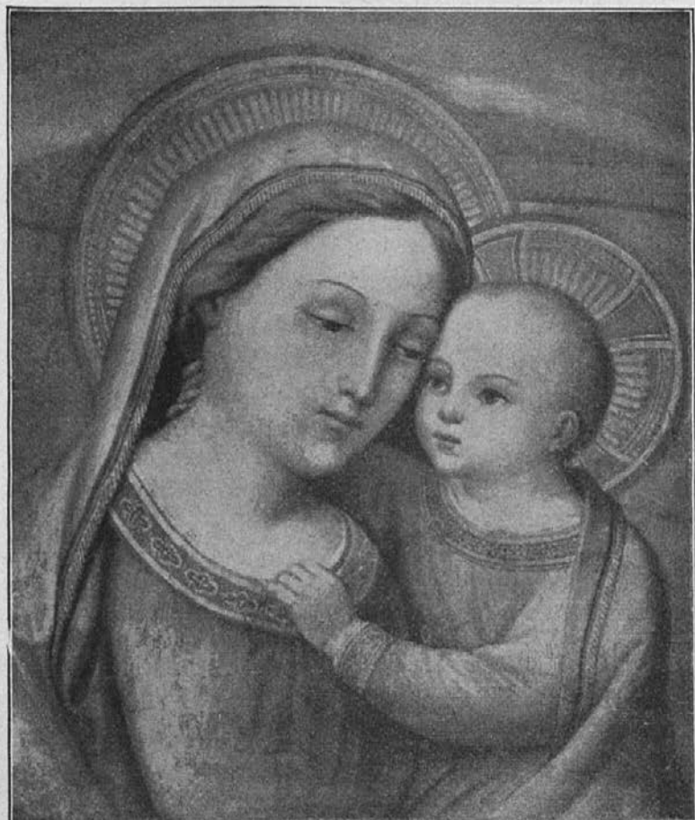
VERA IMAGO B EA T AE MARIAE VIRGINIS. DE BONO CONSIGLIO NUNTIATA IN GENAZZANO VENERANDA

Marija, mati dobrega sveta, prosi za nas