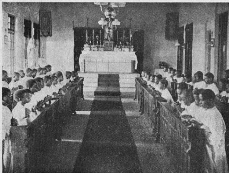
Zamorski semeniščniki, zbrani v kapeli pri molitvi.