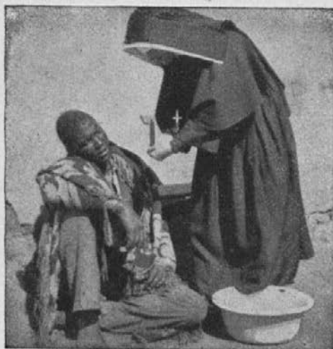
Kako hvaležni so bolniki za ljubeznivo postržbo.