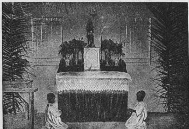
Tukaj prebiva Jezus, ki bo kmalu prišel v najini srca.