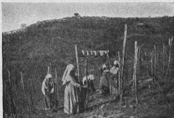
Misijonarke učijo zamorce tudi vrtnarstva.

povedala isto kakor meni prejšnji dan. Rekla je: »Ozdravela bom; potem pa bom postala kristjana in bom s sestrami molila.«