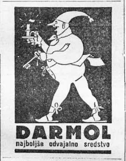
DARMOL najboljšo odvajalno sredstvo

Lasje se tvorijo iz kože. Iz čisto iste snovi so kakor nohli ali kakor zunanja površina naše polti, kakor pri plitkih perle ali pri govedu roževina.