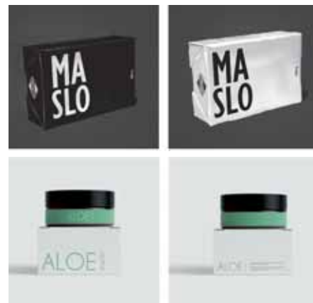
Bistvo številnih projektov oblikovanja embalaže na NTF je trajnost.