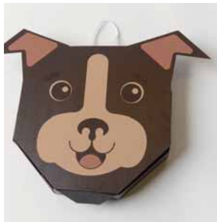
1. nagrada - zlata medalja: ŠPELA LUKMAN.