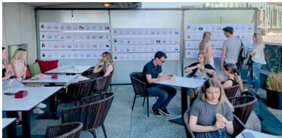
Predstavitev in skupna razstava izdelkov na prostem v 13. nadstropju stolpnice TR3 z naslovom Horizontale.